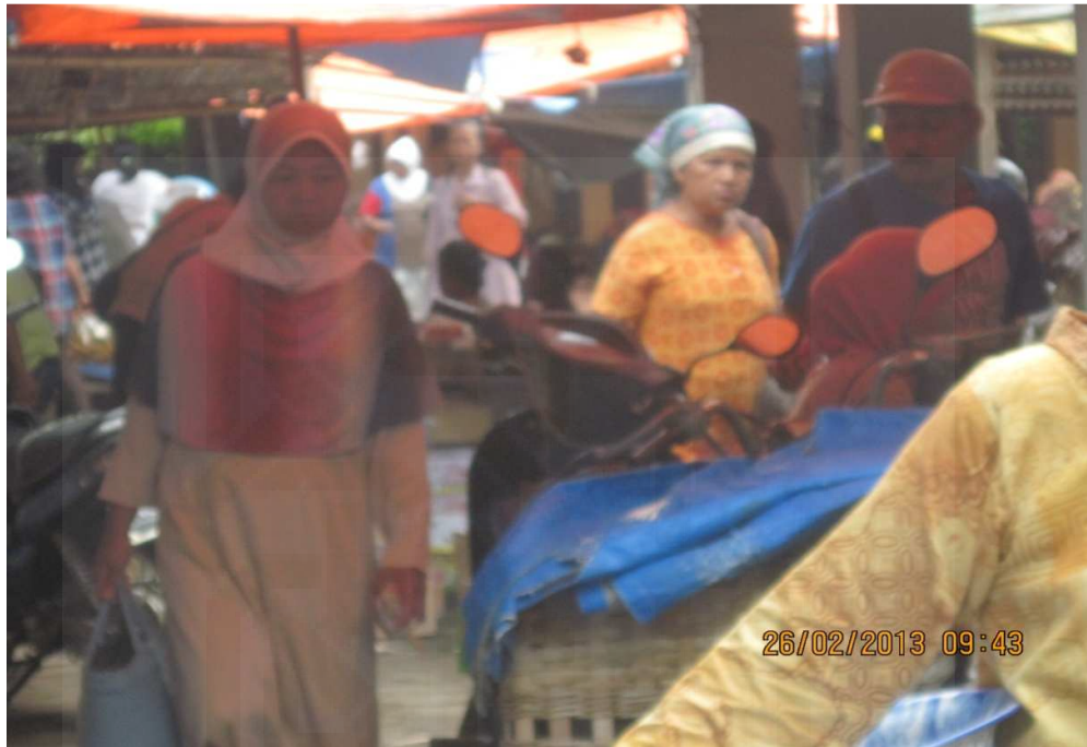
Gambar 1: Suasana di Pasar Brosot Kulon Progo