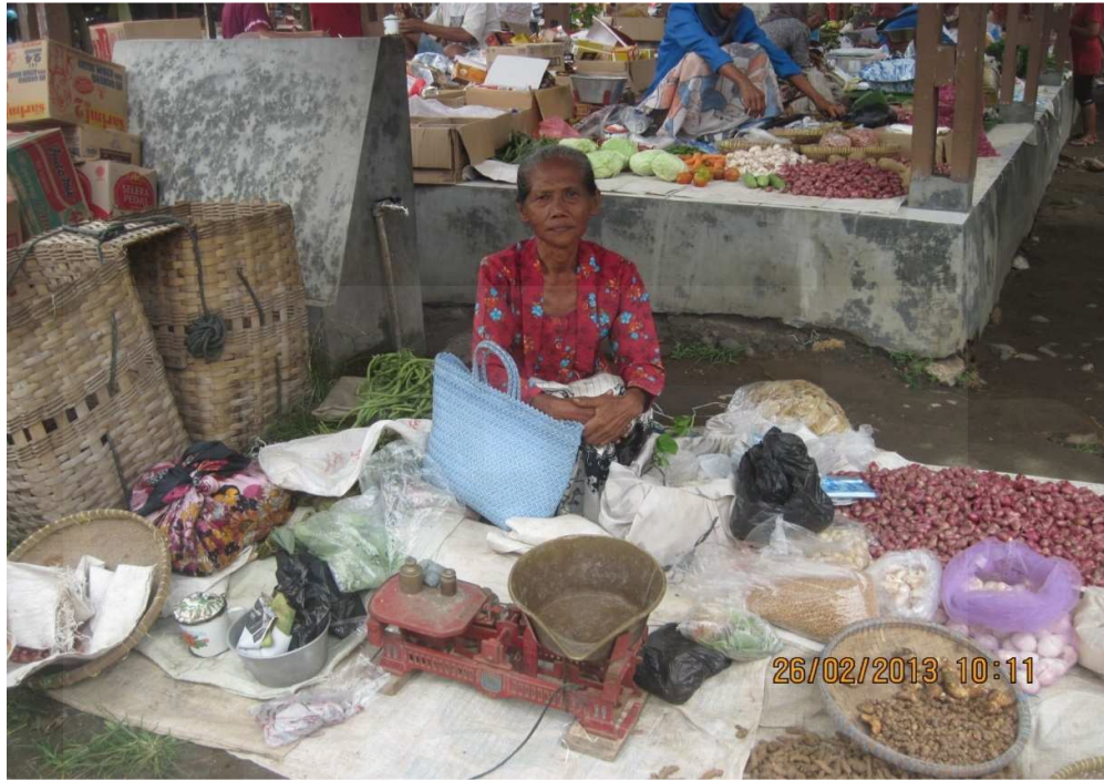
Gambar 3: Pedagang lansia perempuan