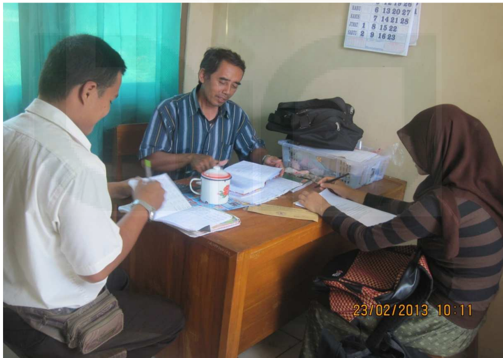
Gambar 2: Wawancara kepada petugas Pasar Brosot Kulon Progo