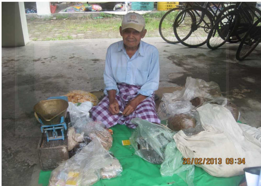
Gambar 4: Pedagang lansia laki-laki