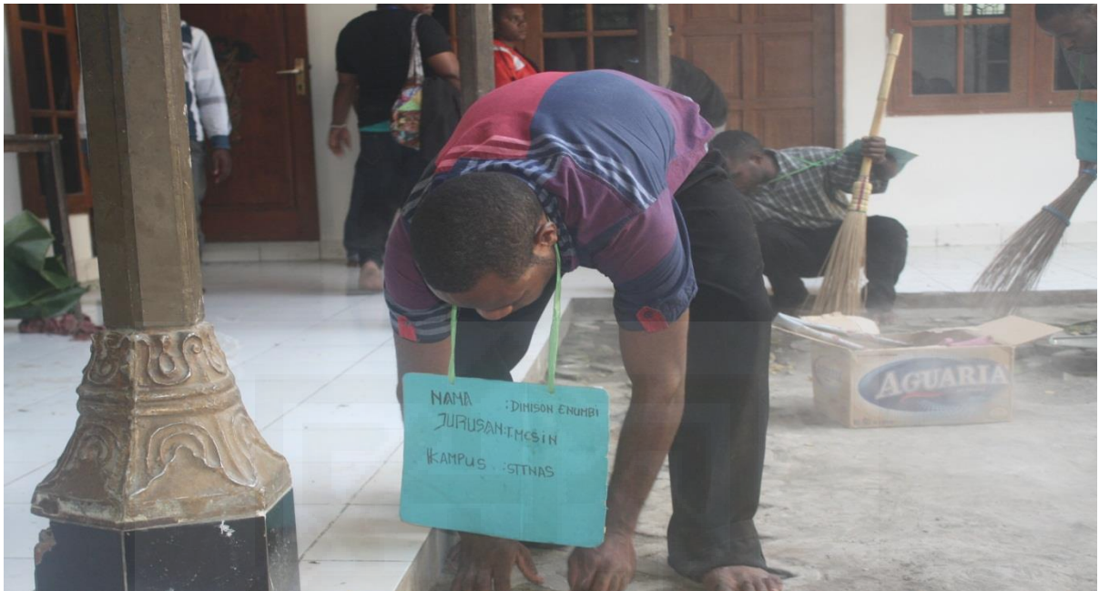
Dokumentasi 3. Gambar kegiatan kerja bakti yang dilakukan mahasiswa baru IPMAPUJA didalam asrama Papua Puncak Jaya Yogyakarta.