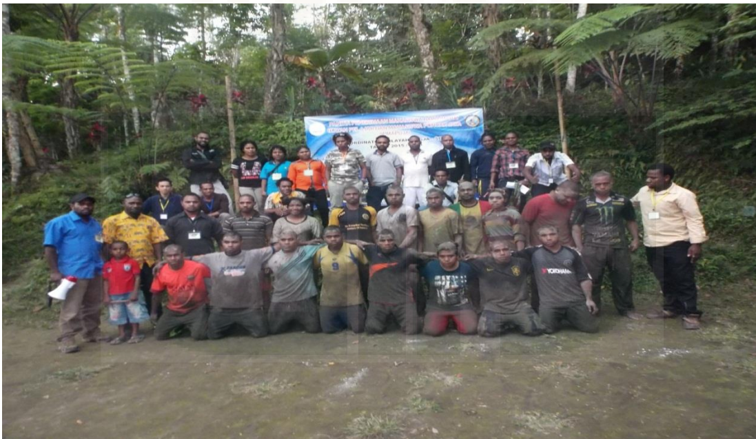
Dokumentasi 2. Gambar Kegiatan Makrab mahasiswa baru IPMAPUJA(Ikatan Pelajar Mahasiswa Papua Puncak Jaya Yogyakarta)