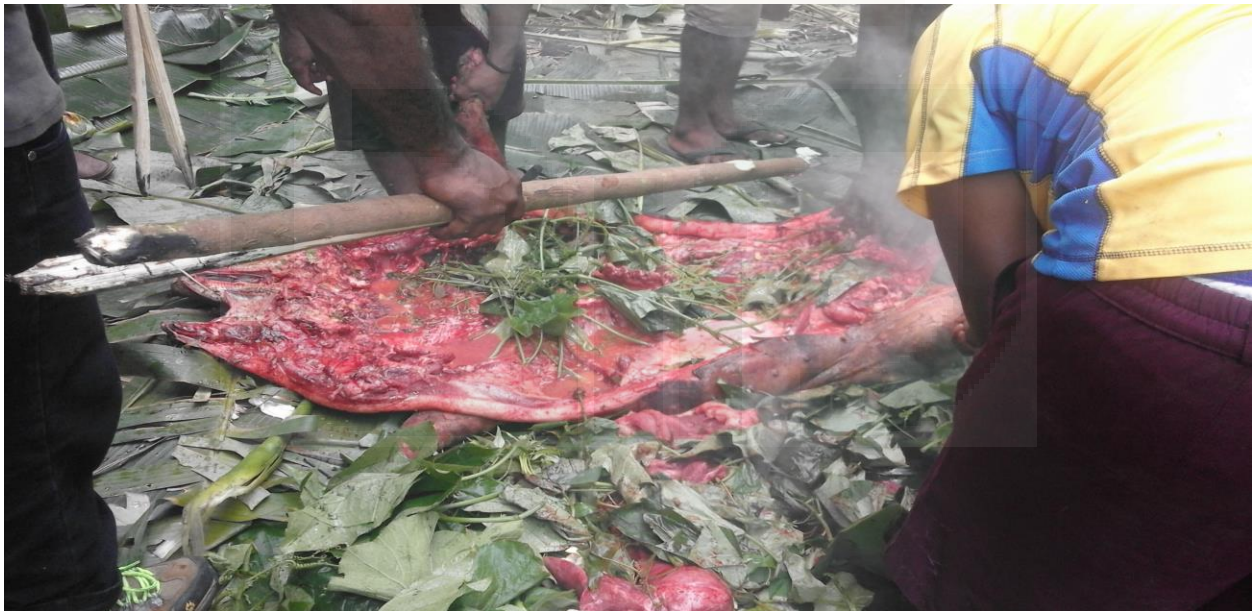
Dokumentasi 7-8. Gambar proses pemindahan daging babi dalam tradisi bakar batu.