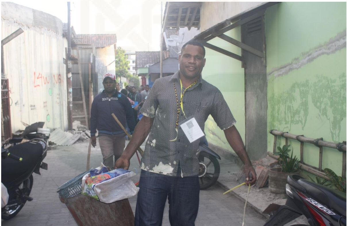
Dokumentasi 4. Gambar kegiatan kerja bakti IPMAPUJA dilingkungan RT.06, RW. 02, kampung Puluhdadi, Caturtunggal, Depok Sleman Yogyakarta.