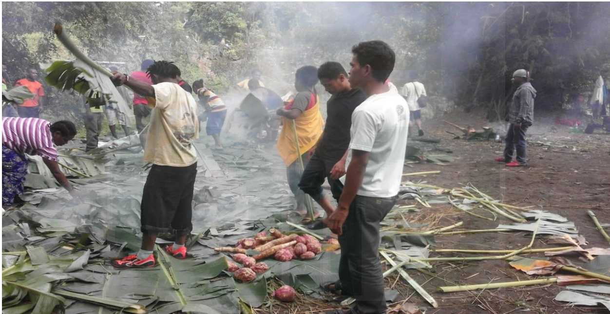
Dokumentasi 5-6. Gambar kegiatan tradisi bakar batu dalam komunitas mahasiswa Papua Puncak Jaya Yogyakarta.