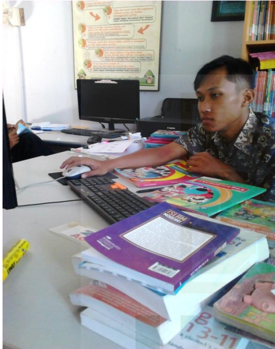
Input Buku Tematik