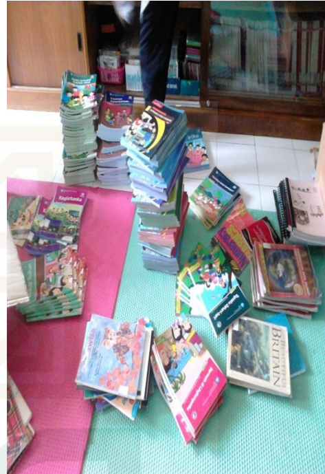
Shelving Buku Tematik