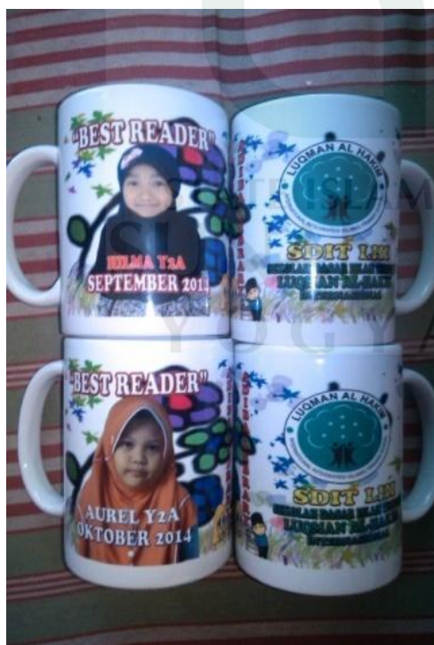
Mug untuk Best Reader