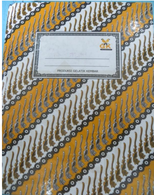
Buku Peminjaman Murid