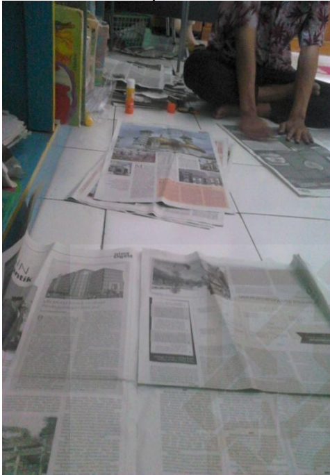
Pengeleman koran koran yang Telah dipilih