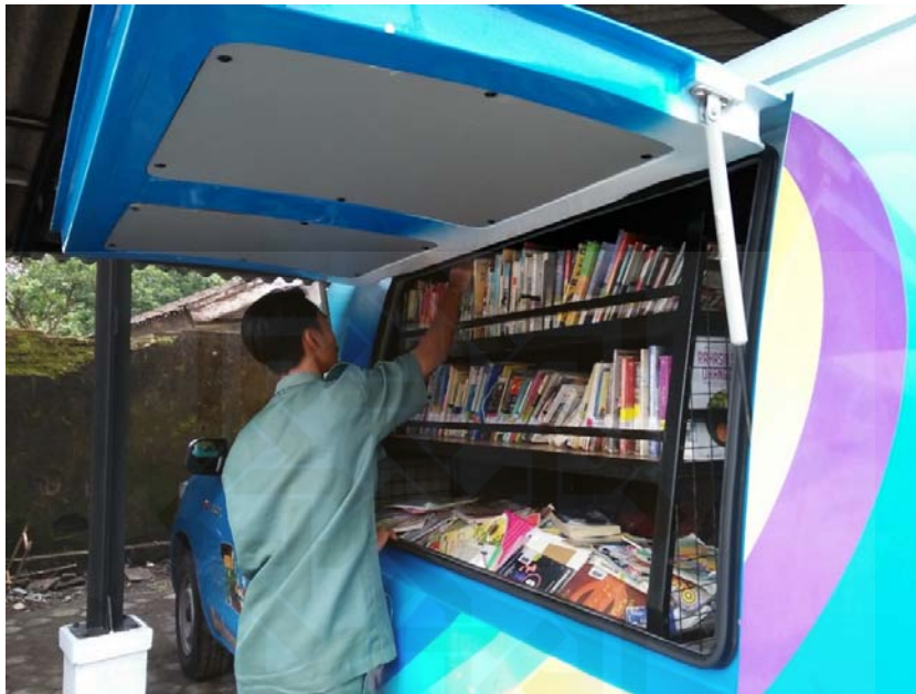
Petugas (siswa PKL) Shelving Koleksi