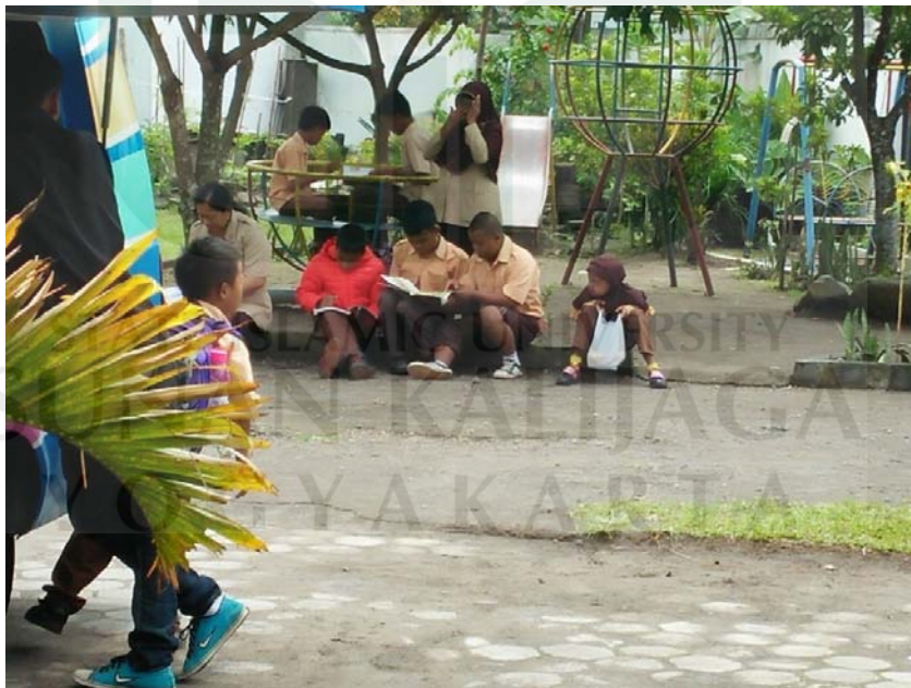
Siswa SLB Tunas Kasih, Turi Membaca di tempat