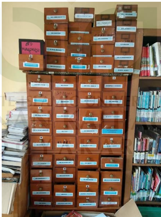
Kotak Kartu Anggota Layanan Perpustakaan Keliling