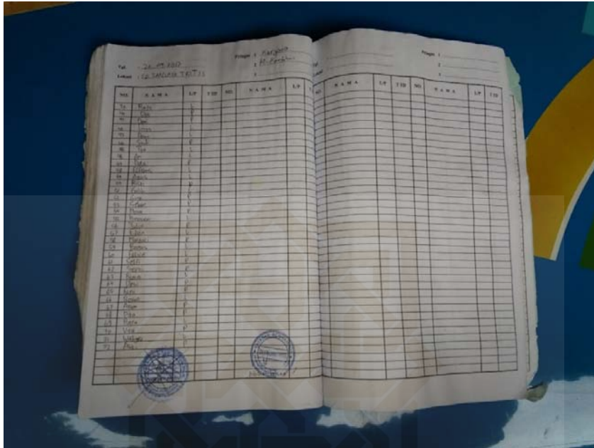
Buku Daftar Hadir Siswa di Perpustakaan Keliling