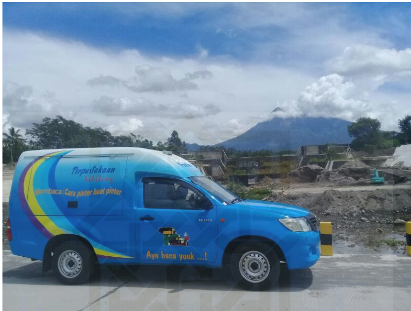
Mobil Toyota Hilux