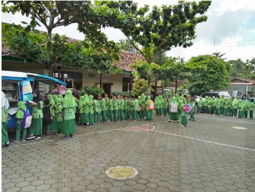
Antrian Siswa SD N Susukan Mengisi Daftar Hadir Perpusing