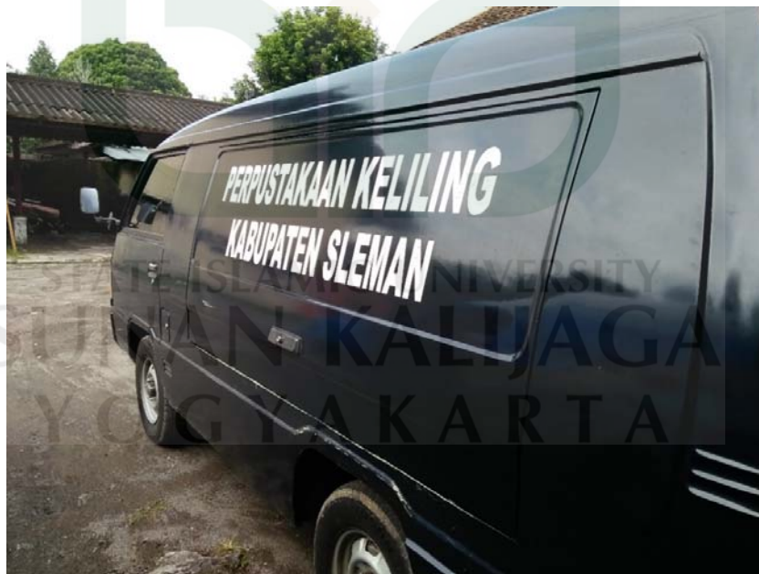
Mobil Mitsubishi L300