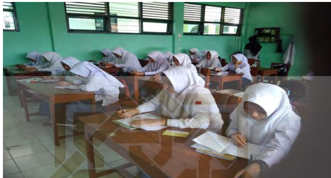
Peserta didik mengerjakan pretest