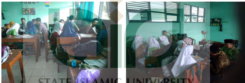
Peserta didik menggunakan Media Gambar dalam pembelajaran