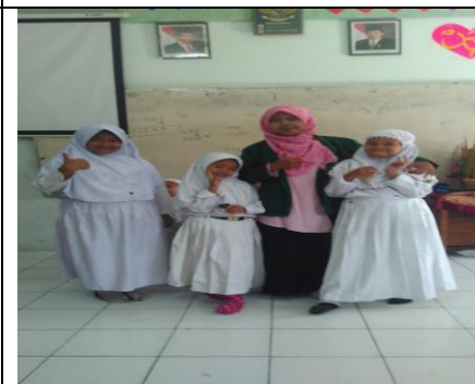
Wawancara Dengan Peserta Didik Kelas III C