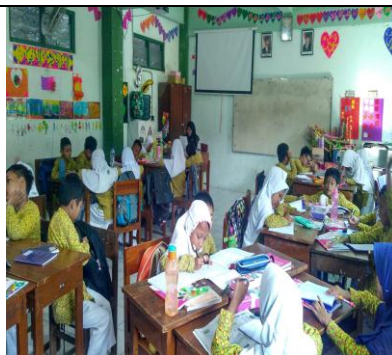
Peserta Didik Mengerjakan Tugas Dengan Tekun