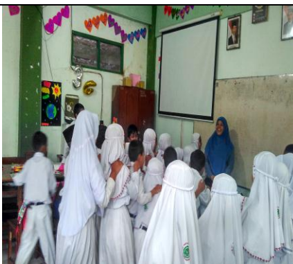
Guru Membagi Kelompok Belajar