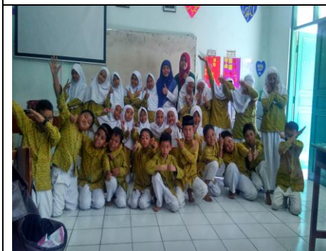
Guru Dan Peserta Didik Kelas III C