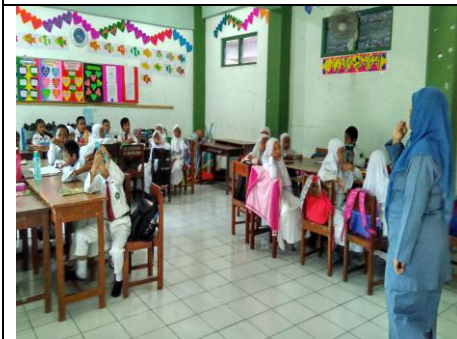
Peserta Didik Mendengarkan Lagu Dari Guru