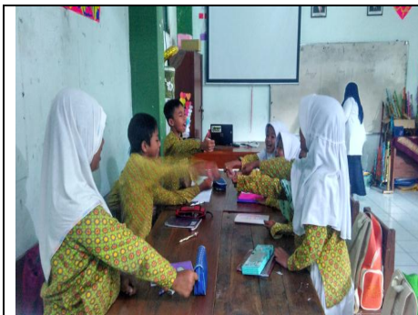
Peserta Didik Menampilkan Media Lagu