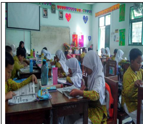
Suasana Kelas III C Yang Kondusif