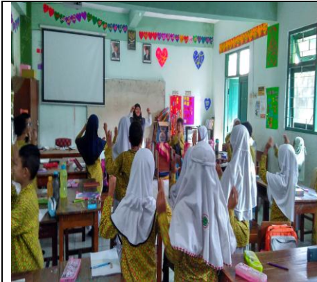
Guru Memberikan Contoh Media Lagu