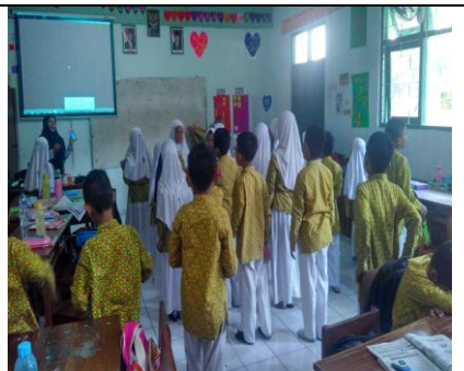
Peserta Didik Mendengarkan Lagu Dari Audio Visual