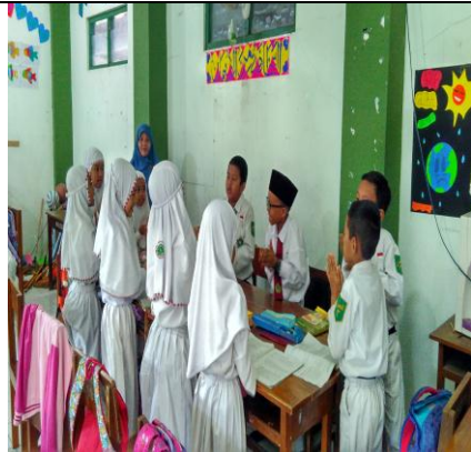
Peserta Didik Berlatih Menyanyikan Lagu