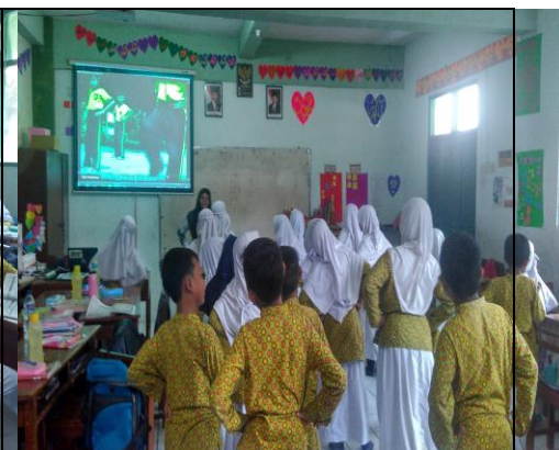
Guru Menggunakan Sarana Prasana Sekolah Dalam Pembelajaran