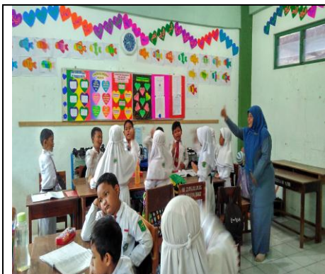
Guru Memberikan Motivasi Belajar