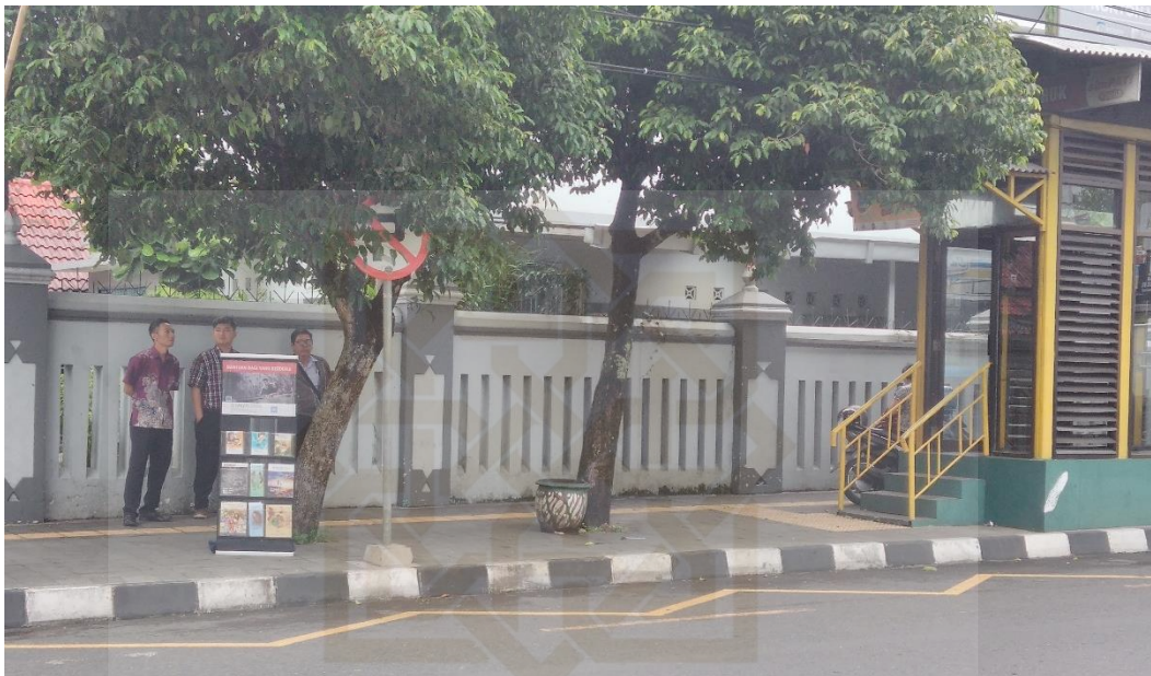
Gambar 1: Saksi-Saksi Yehuwa Sidang Yogyakarta Selatan membuka stand di daerah Halte Bus Lempuyangan (23 Januari 2019)