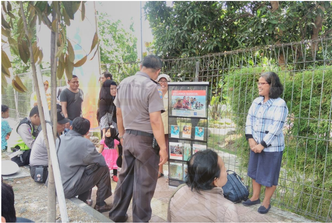
Gambar 4: Saksi-Saksi Yehuwa Sidang Yogyakarta Utara membuka stand di daerah Sunmor UGM (28 Oktober 2018)