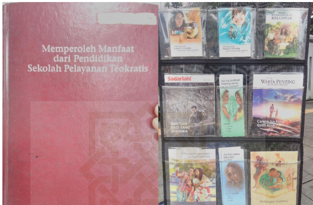
Gambar 6: Buku Pelayanan Teokratis (Buku Dinas) dan beberapa hasil publikasi lainnya