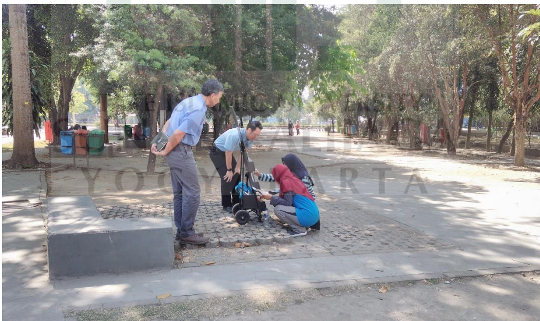
Gambar 2: Saksi-Saksi Yehuwa Sidang Bahasa Inggris membuka stand di depan Fakultas Filsafat UGM (18 November 2018)