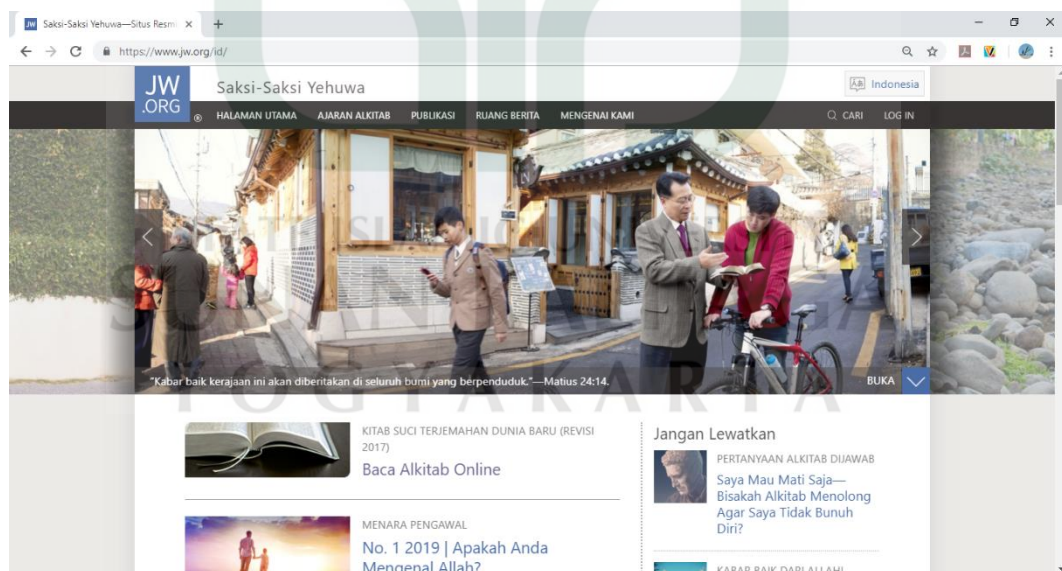
Gambar 6: jw.org , situs web resmi Saksi-Saksi Yehuwa yang tersedia dalam 991 bahasa diseluruh dunia