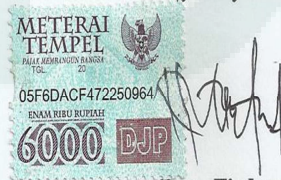
Bayu Firdaus NIM. 09540057