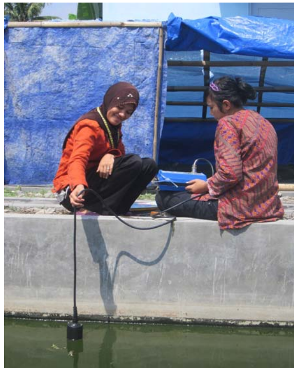
Pengukuran kualitas air