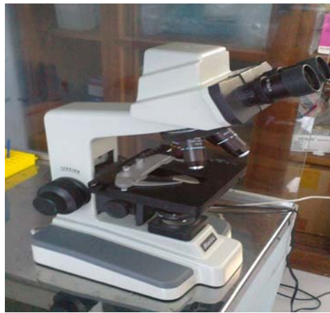
Pengamatan preparat di mikroskop dan mikroskop elektrik binokuler