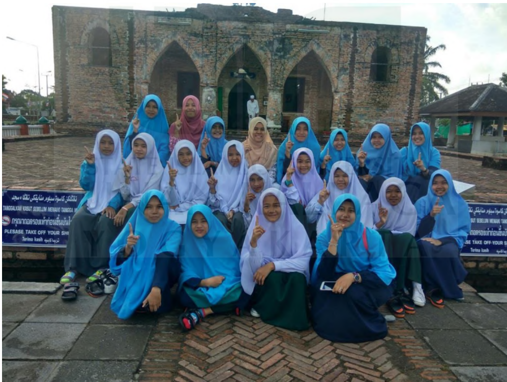
Gambar 12. Peneliti foto bersama siswi saat kunjungan Masjid Krisek Provinsi Pattani