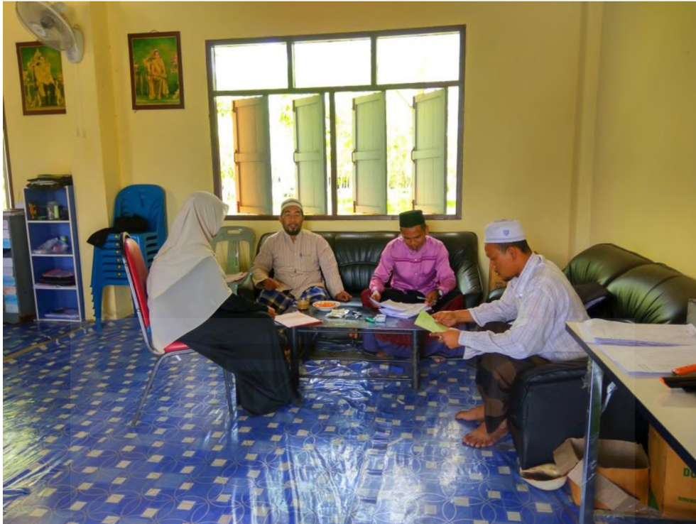
Gambar 7. Wawancara guru agama sekolah Sri Patani Witthaya