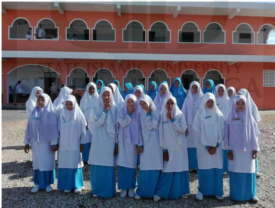
Gambar 6. Uniform siswi sekolah Sri Patani Witthaya.