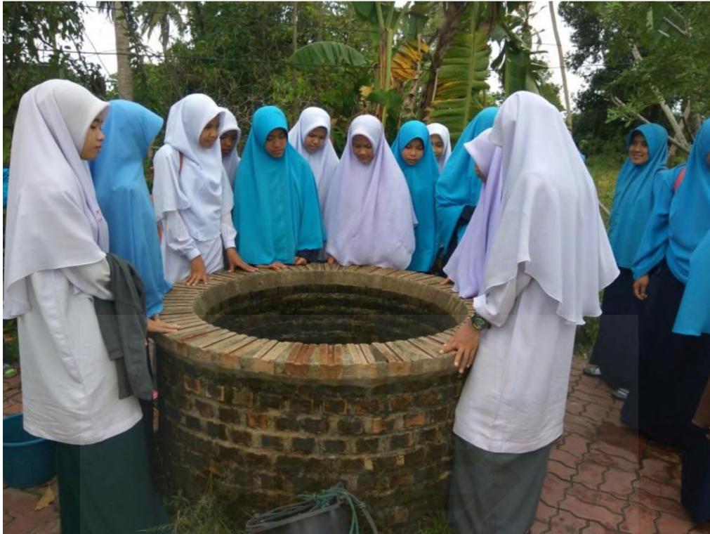
Gambar 11. Kegiatan Belajar di Luar kelas kunjungi Telaga Syekh Daud Al fatoni