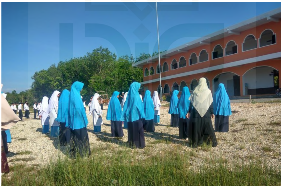
Gambar 8. Peneliti mengamati upacara bendera Siswa dan Siswi sekolah Sri Patani Witthaya