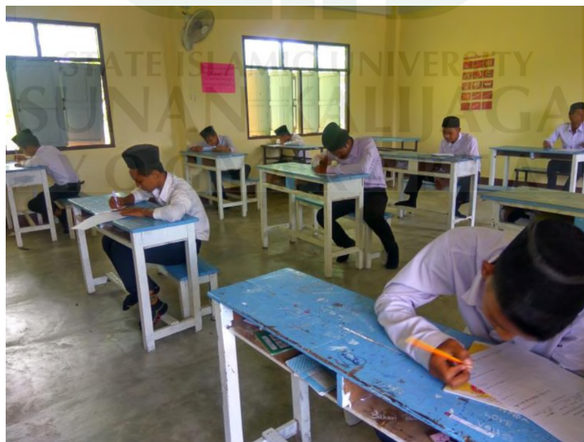
Gambar 10. Suasana siswa sedang Ujian Akhir Semester