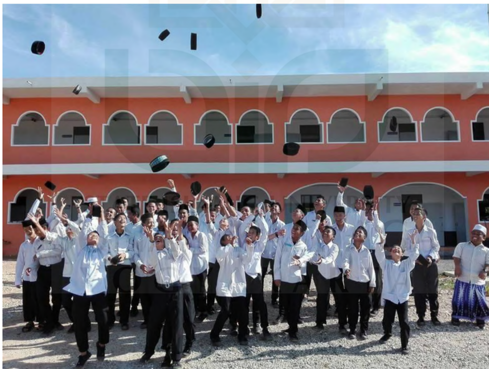
Gambar 4. Suasana gembira Siswa setelah belajar di depan gedung dua lantai sekolah Sri Patani Witthaya.