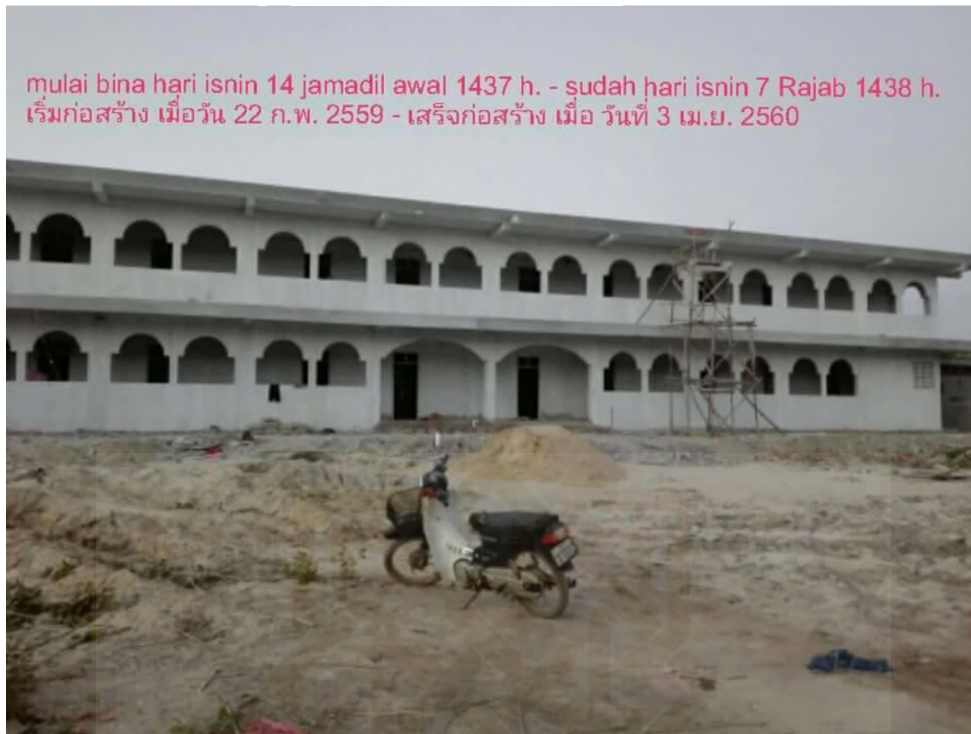
Gambar 3. 22 Feb 2016 Awal berdiri Gedung dua lantai sekolah Sri Patani Witthaya.