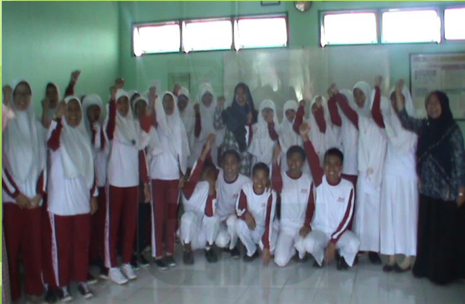
Foto bersama siswa-siswi kelas XI Agama dan guru bahasa Arab kelas XI Agama