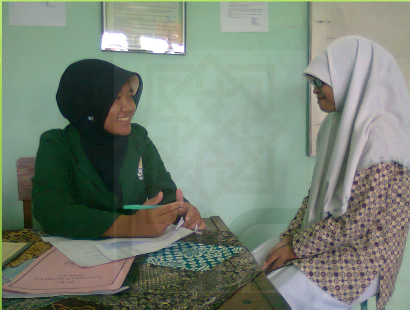
Pelaksanaan pretest di kelas XI Agama