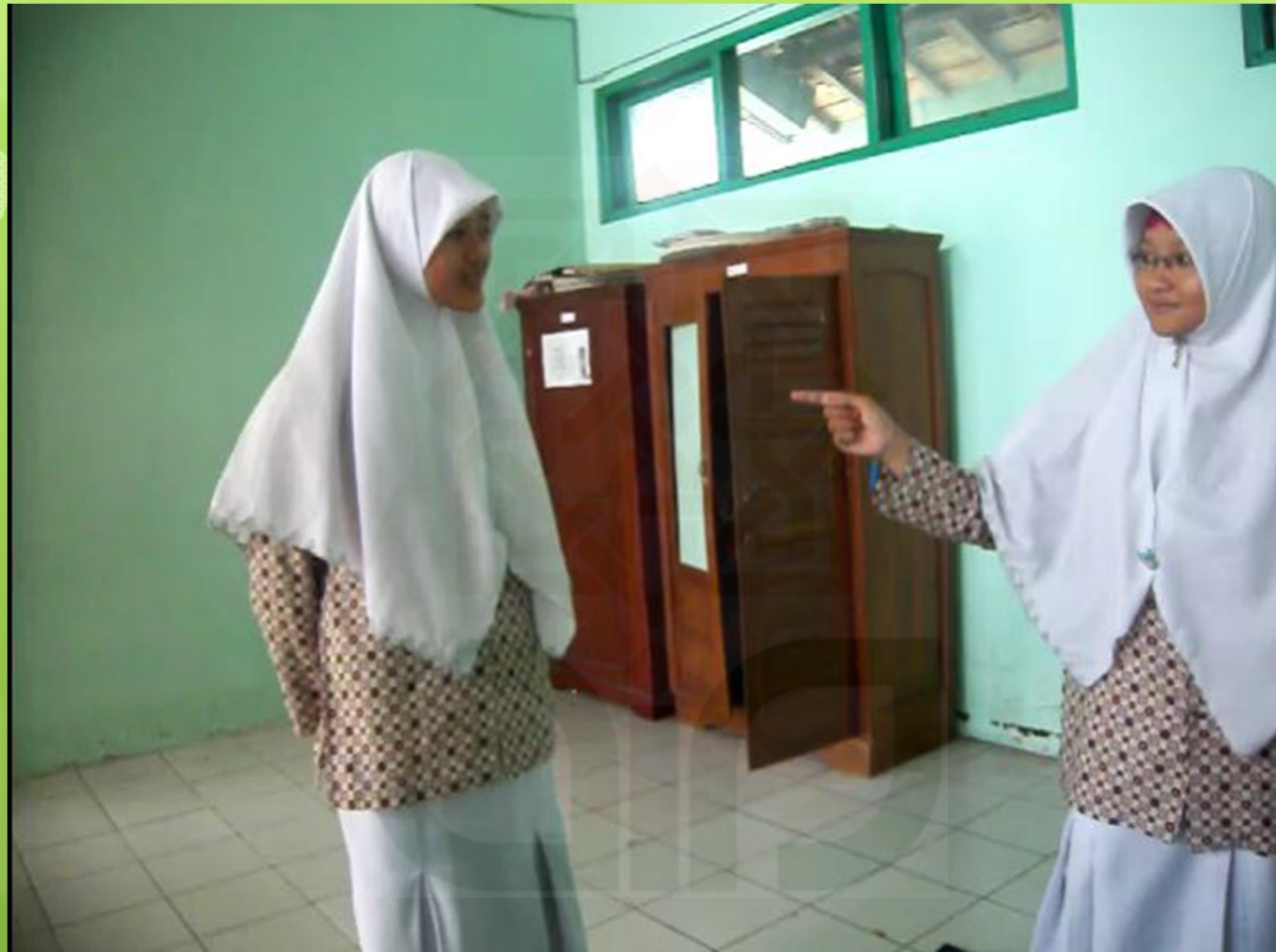
Siswa-siswi dari kelompok eksperimen saat bermain peran bersama kelompoknya