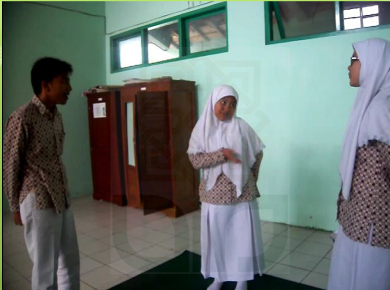
Siswa-siswi dari kelompok eksperimen saat bermain peran bersama kelompoknya