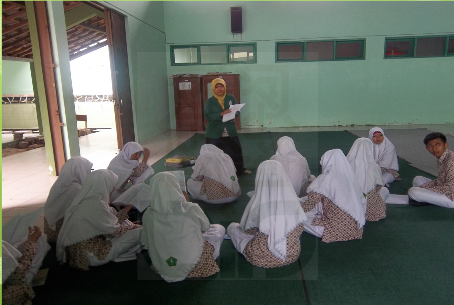
Peneliti saat menjelaskan tentang strategi Role Play