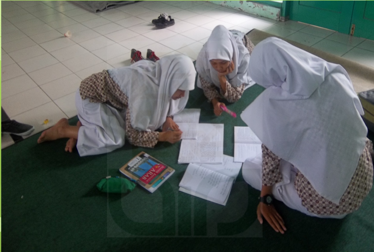
Siswa-siswa dari Kelompok eksperimen saat diberi tugas untuk menyusun naskah untuk bermain peran