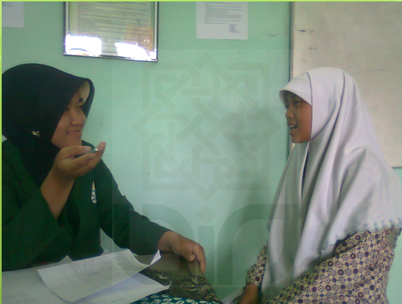
Pelaksanaan post test di kelas XI Agama