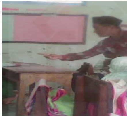
Guru mempraktekkan metode tanya jawab