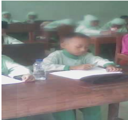
Siswa mengerjakan tugas dari guru