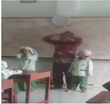
Guru mempraktekkan metode demonstrasi