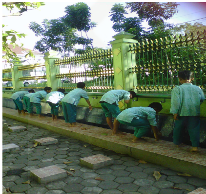
Siswa melakukan praktek wudhu