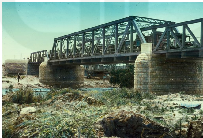
Larger bridge built in the ١٩٣٠'s next to the original one visible behind it

(Diakses pada ٢٠ Desember ٢٠١٣ pukul ١٤.٠٥ WIB)