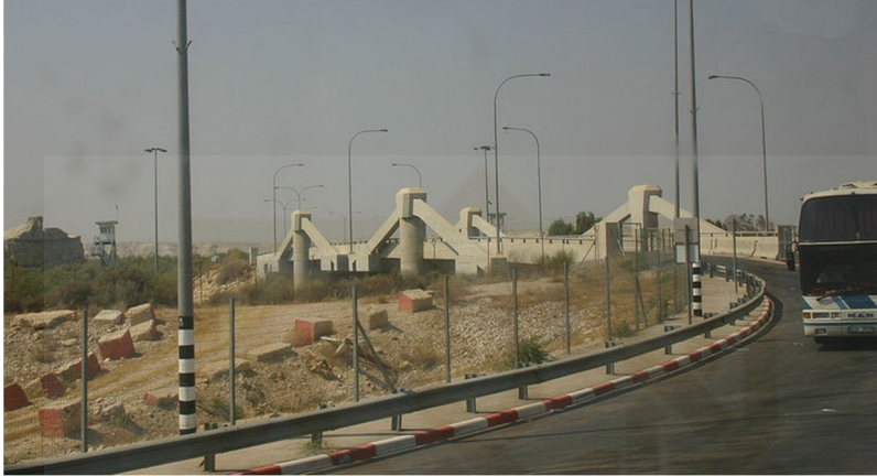
Present day Allenby Bridge, photo from ٢٠٠٦

http://en.wikipedia.org/wiki/File:Allenby_Bridge_LOC_Matson_22904.jpg (Diakses pada ٢٠ Desember ٢٠١٣ pukul ١٤.١٠ WIB)