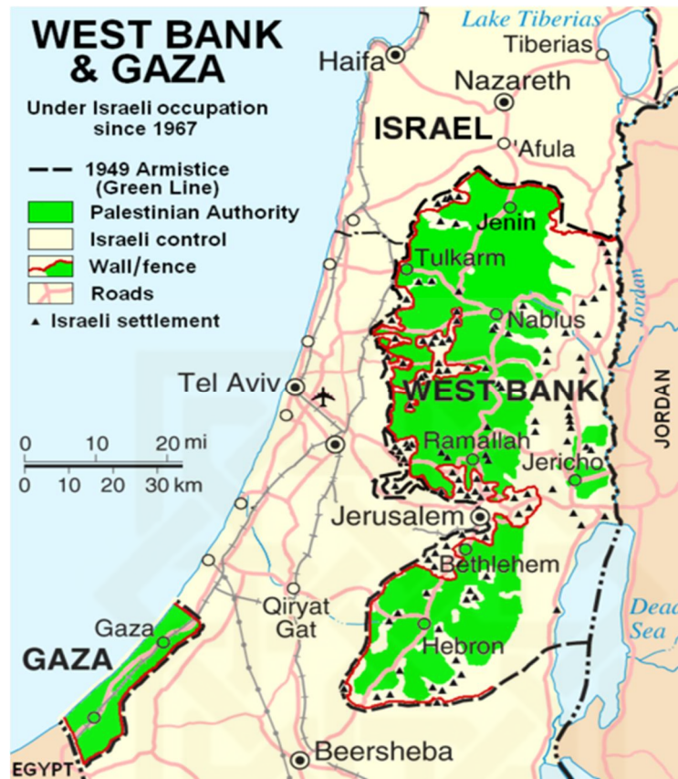
Map of the West Bank and the Gaza Strip, ٢٠٠٧

http://upload.wikimedia.org/wikipedia/commons/thumb/6/6a/West_Bank_%26_Gaza_Map_2007_%28Settlements%29.png/482px-West_Bank_%26_Gaza_Map_2007_%28Settlements%29.png (diakses pada ٢٠ Desember ٢٠١٣ pukul ١٤.٣٧ WIB)