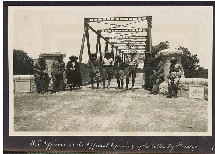
The opening of the original Allenby Bridge in ١٩١٨