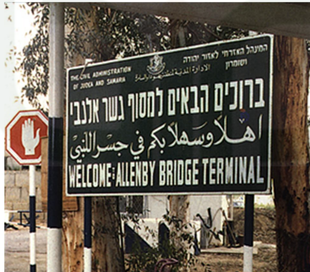
The Allenby Bridge between the West Bank and Jordan

http://en.wikipedia.org/wiki/File:Allenby-Br%C3%BCcke.jpg (Diakses pada ٢٠ Desember ٢٠١٣ pukul ١٤.١٥ WIB)