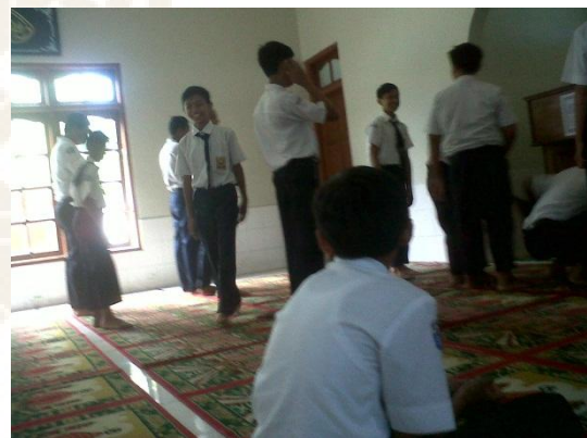
Persiapan Shalat Dzuhur