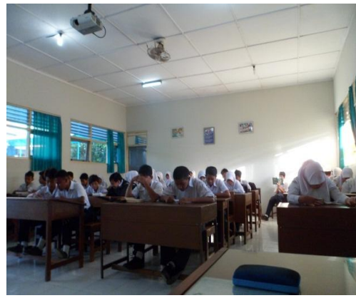
Tadarus Al Qur'an