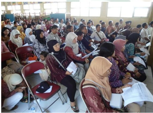
Rapat dengan Orang Tua/ Wali Siswa