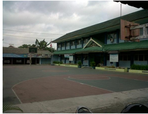
Keadaan Lingkungan Sekolah