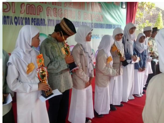
Juara Lomba Keagamaan