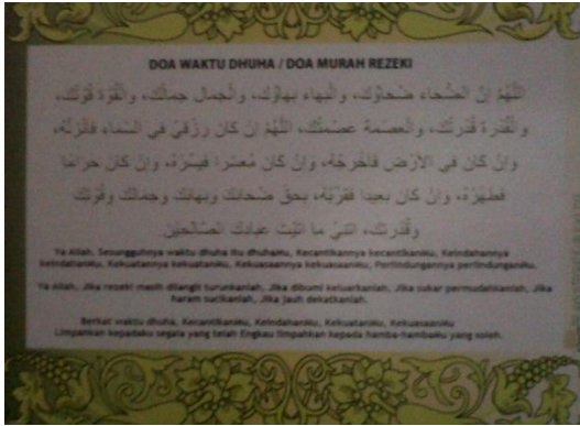
Do'a Setelah Shalat Dhuha