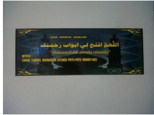
Do'a Masuk Masjid