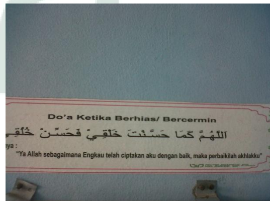
Do'a Ketika Bercermin