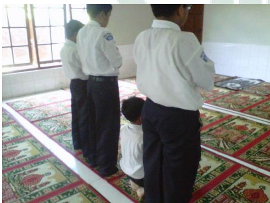
Pelaksanaan Shalat Dhuha