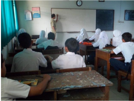
Observasi Pembelajaran di Kelas