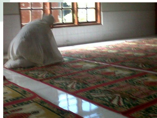
Ibu Guru yang Sedang Melaksanakan Shalat Dhuha