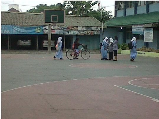
Salam Kepada Bapak/Ibu Guru