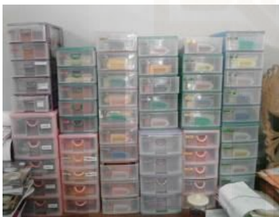
Laci penyimpanan kartu peminjaman masing-masing kelas 2013/2014