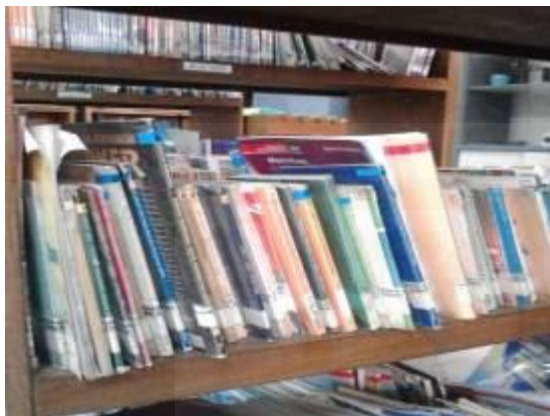
Buku Non Paket