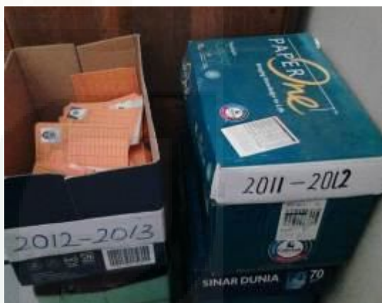
Penyimpanan kartu peminjaman 2011-2013