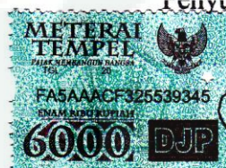
Intan Khusnul Khotimala Putri