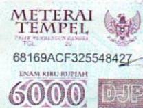
Imam Syafi'i Nim.10210112

Yogyakarta, 03 Juni 2014. Yang menyatakan,