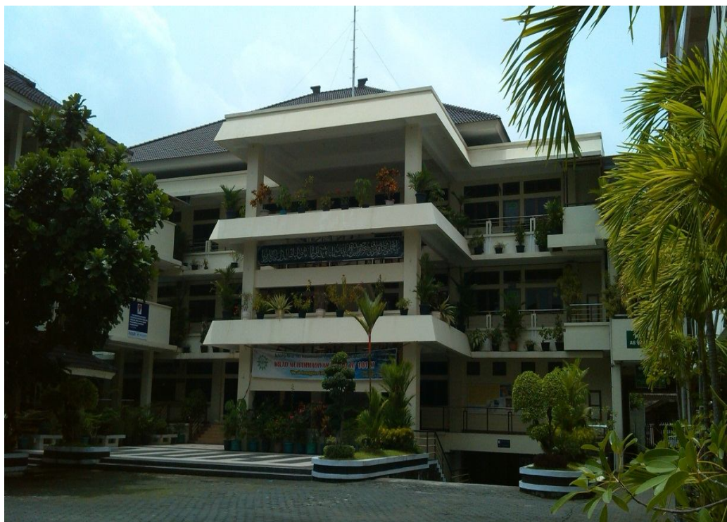
Gedung SMA Muhammadiyah 1 Yogyakarta