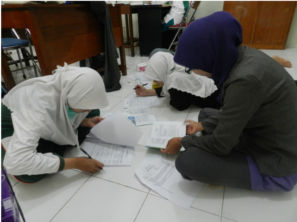
Keakraban penulis bersamasiswa akselerasi