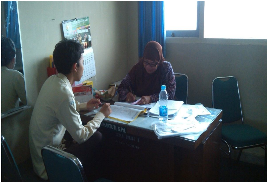
Siswa Emelakukankonseling individual dengan guru BK