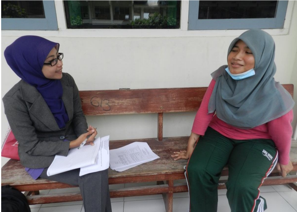
Wawancara dengan siswa akselerasi