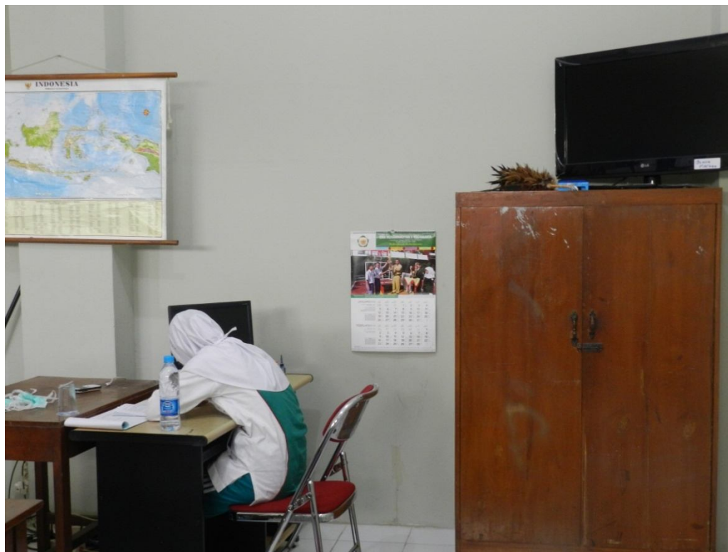
Fasilitas di kelas akselerasi seperti adanya televisi dan komputer