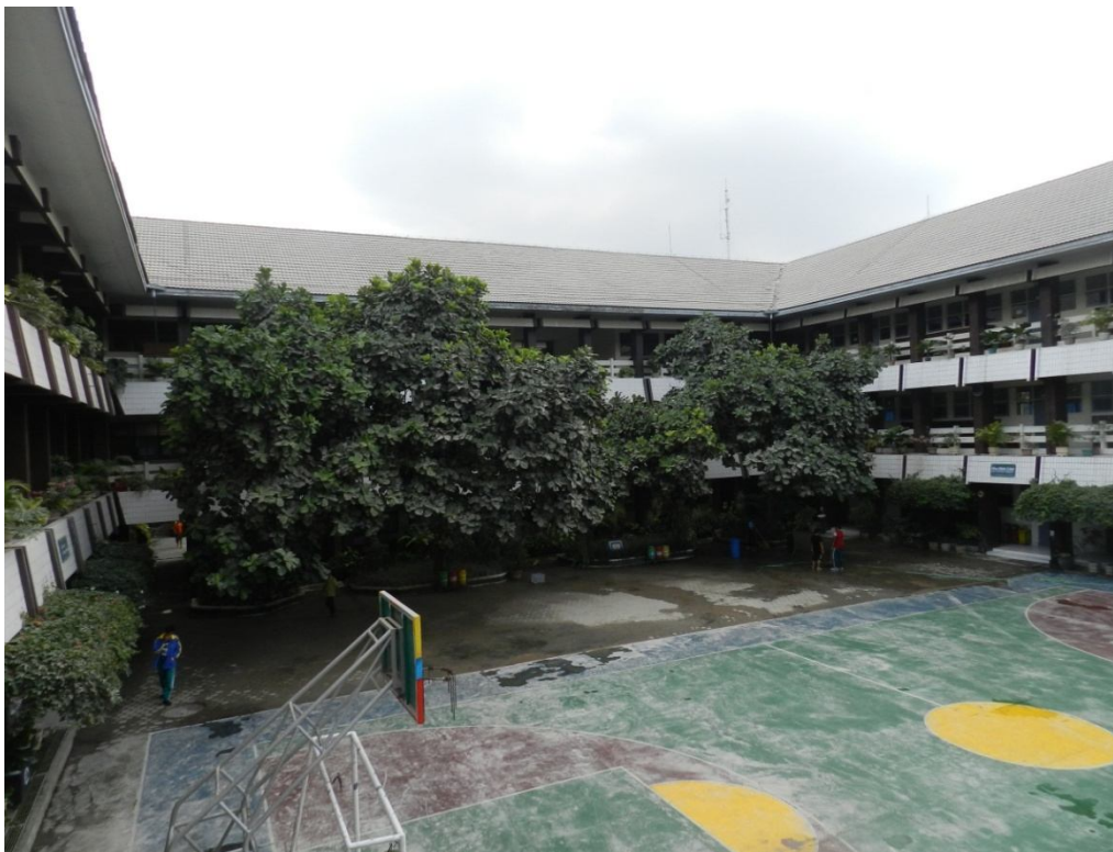
Halaman tengah dan lapangan basket SMA Muhammadiyah 1 Yogyakarta