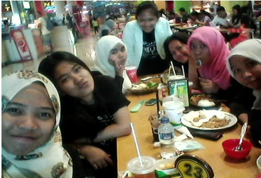
Gb.1 Komunitas Shawol Kota Yogyakarta sedang berkumpul di salah satu tempat makan