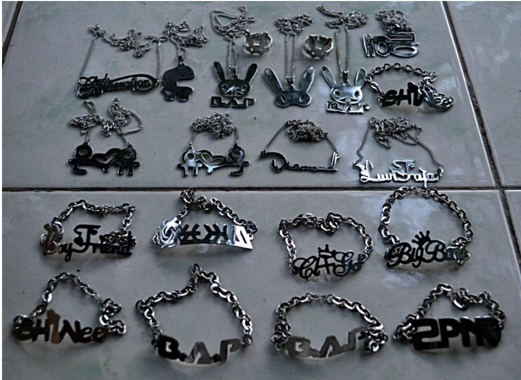
Gb. 9 Pernak-pernik yang dimiliki Kpopers Shawol