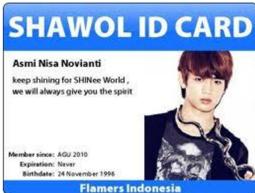
Gb. 4 Salah satu contoh ID card Shawol