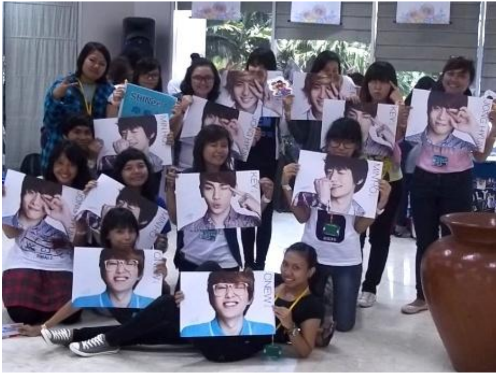
Gb.5 Kpopers Shawol membawa poster masing-masing personil Shinee