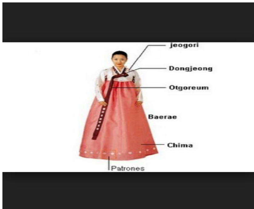
Gb. 15 Pakaian tradisional Hanbok untuk wanita