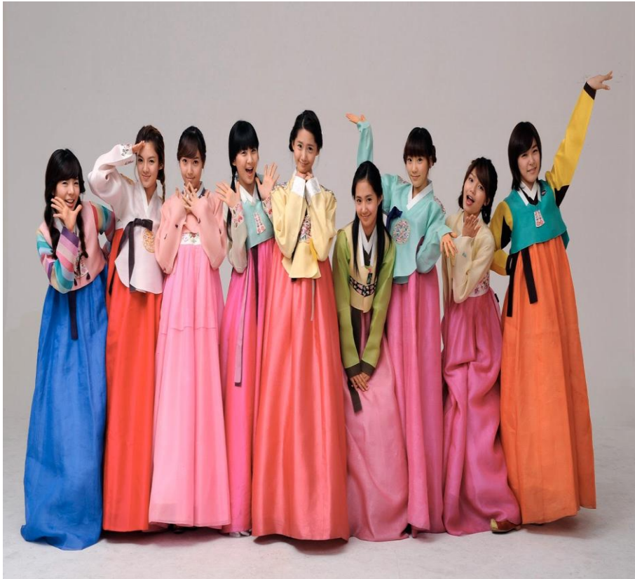
Gb.7 Contoh pakaian tradisional Korea Selatan yang bernama Hanbok