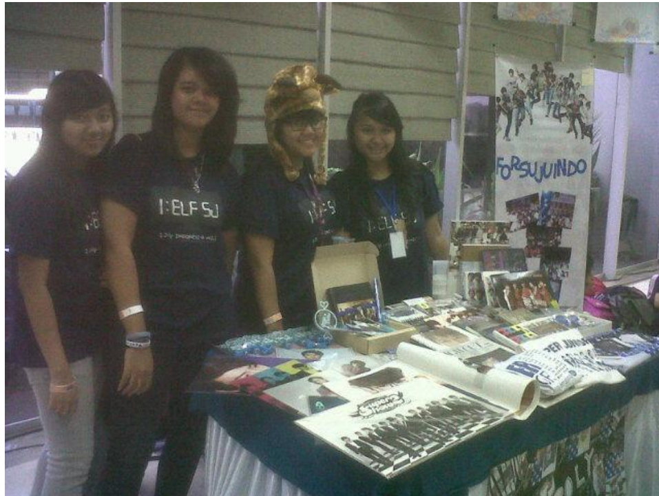
Gb.3 Kpopers menjual pernak-pernak dalam acara festival Kpop