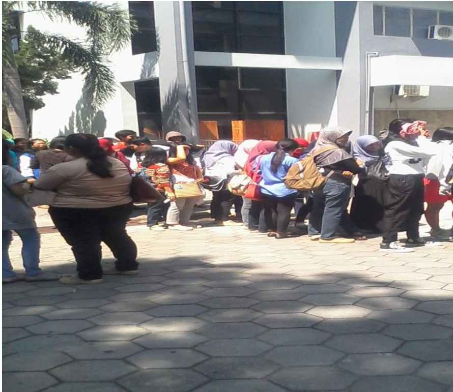
Gb. 11 Kpopers sedang menunggu acara gathering