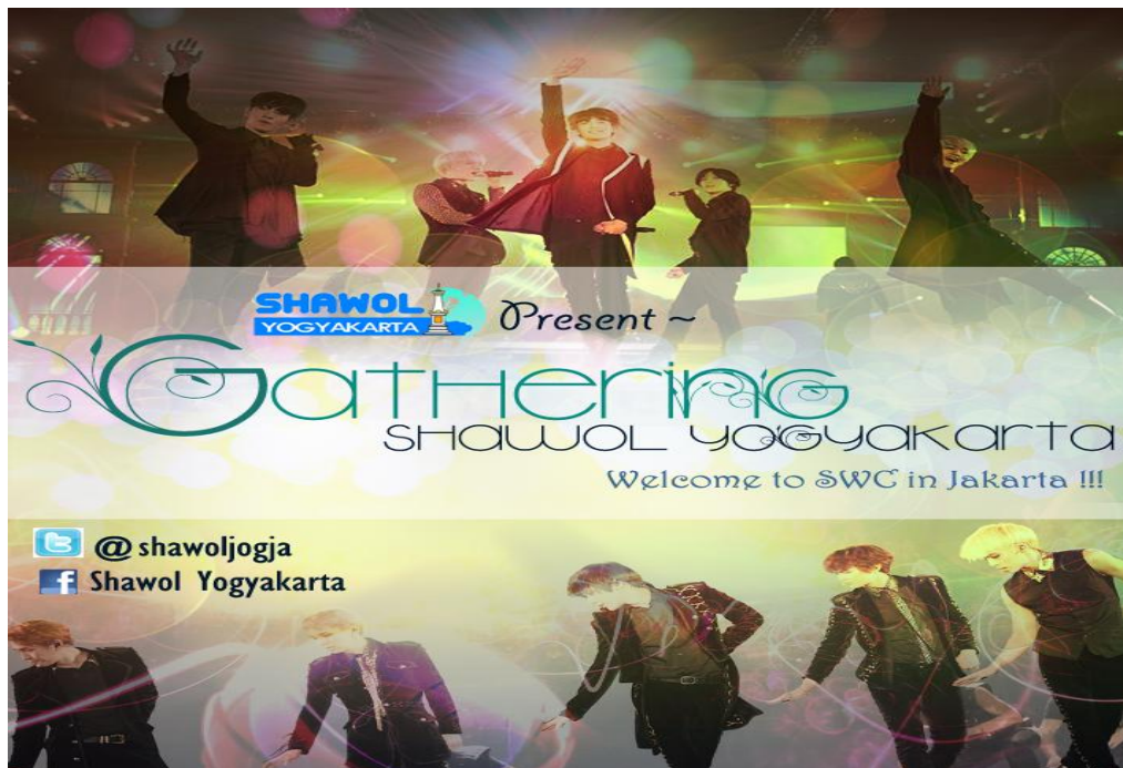
Gb. 8 Contoh poster acara Gathering Shawol Kota Yogyakarta