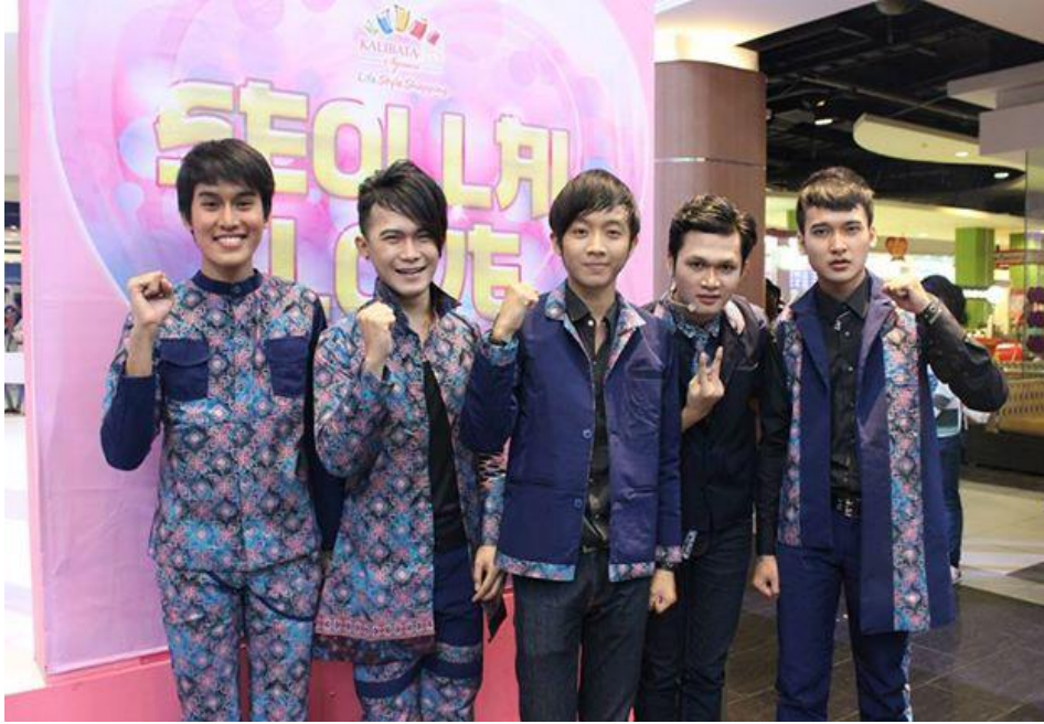
Gb. 13 Personil cover Shinee yaitu Skynee