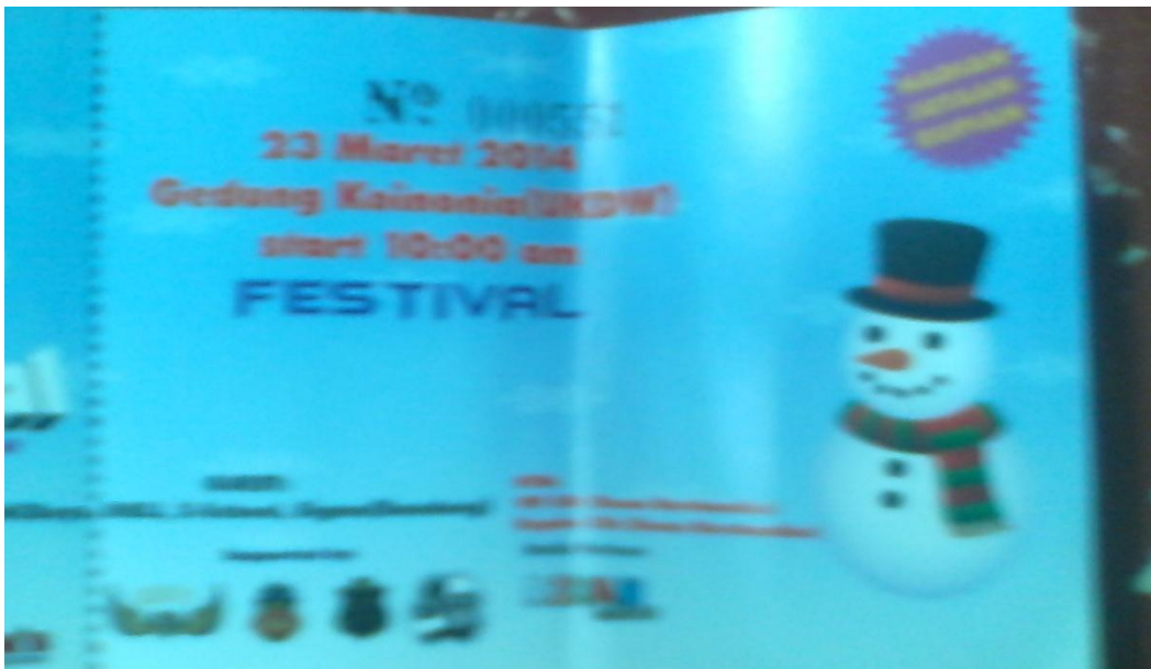
Gb. 10 Contoh ticket untuk acara festival Kpop