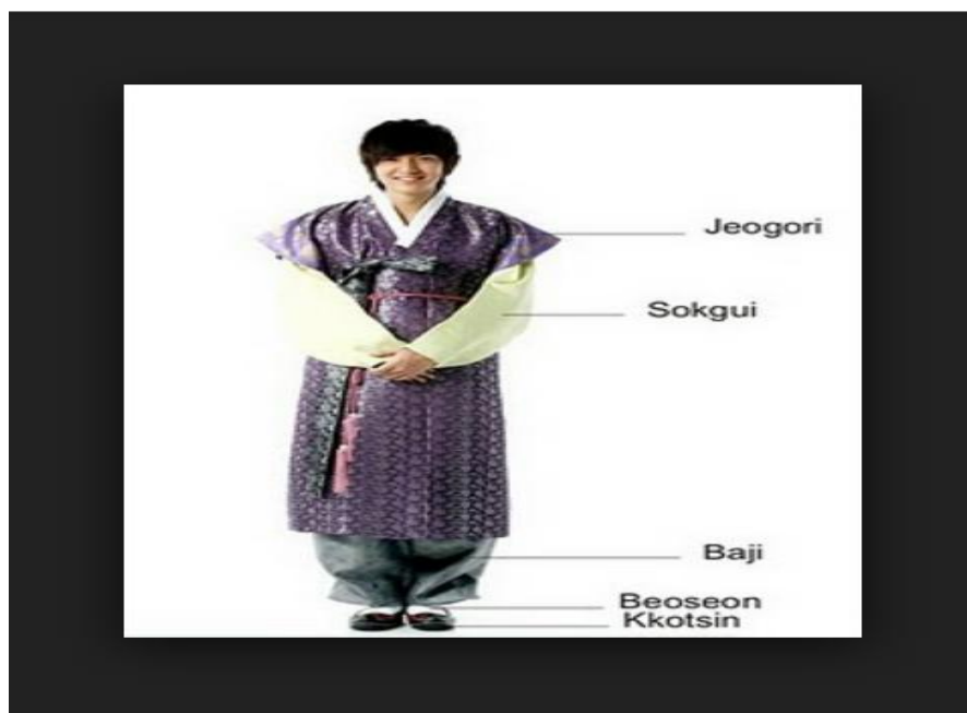
Gb. 16 Pakaian tradisional Hanbok untuk laki-laki