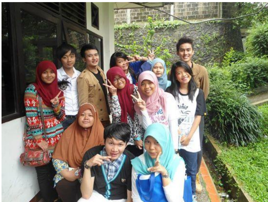
Gb.2 Kpopers Shawol sedang berfoto bersama cover Shinee yaitu Skynee