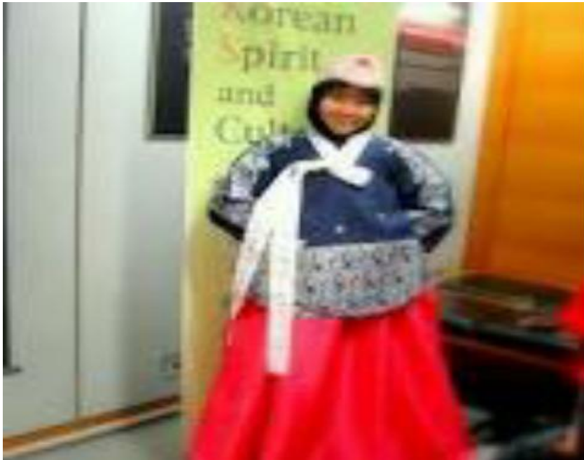
Gb, 14 Pakaian tradisioanal Hanbok memakai hijab