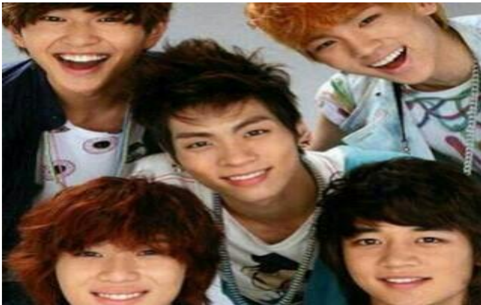
Gb. 6 Personil Shinee