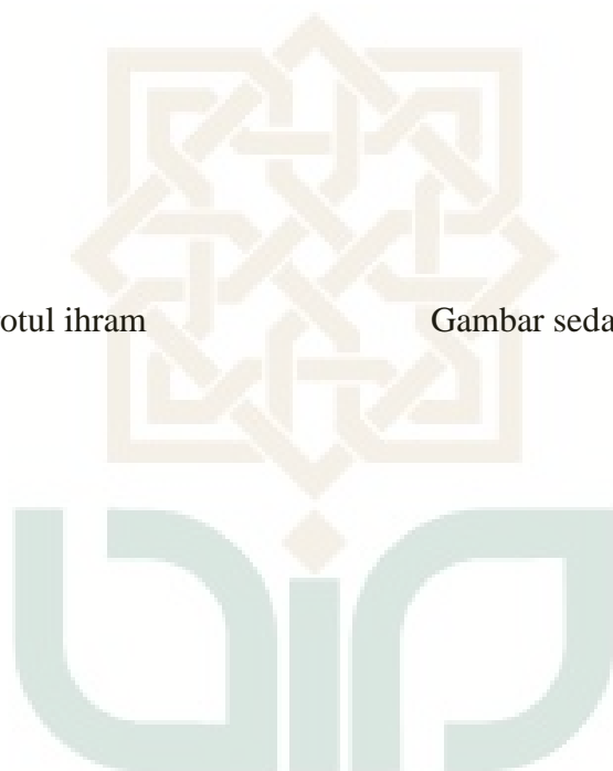
Gambar sedang rukuk