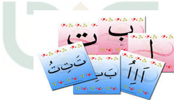
Gambar 1. Word Cards Huruf Hija'iyah

Kartu kata bergambar ini akan menjadi media yang nantinya saat pembelajaran, siswa akan menemui macam-macam kartu yang berbeda tulisan serta gambarnya. Dan dalam penggunaannya bisa divariasikan