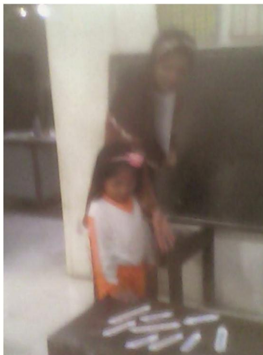
Gambar 4 Siswa Mencari Kartu Kata Untuk Permainan Kartu Kata Bergambar Pada Siklus II