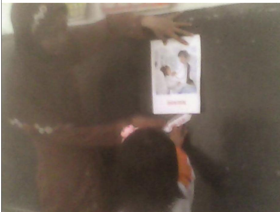
Gambar 5 Siswa Menempelkan Kartu Kata Pada Gambar Pada Siklus II