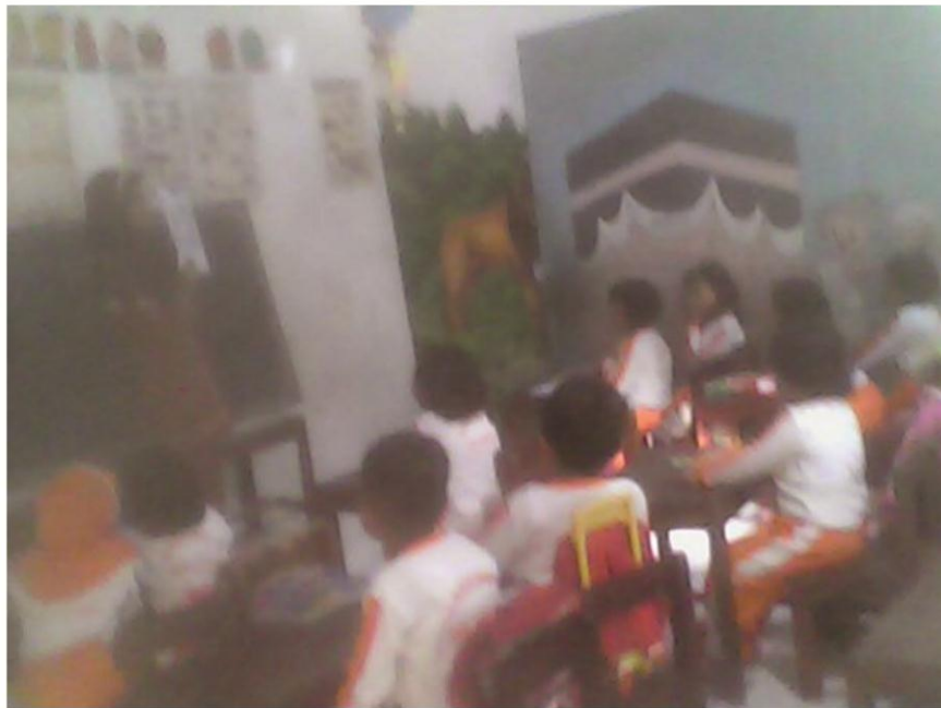
Gambar 1 Siswa Memperhatikan Penjelasan Guru Pada Siklus I