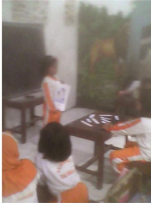
Gambar 3 Siswa Memperagakan Merangkai Kartu Kata Bergambar Pada Siklus I