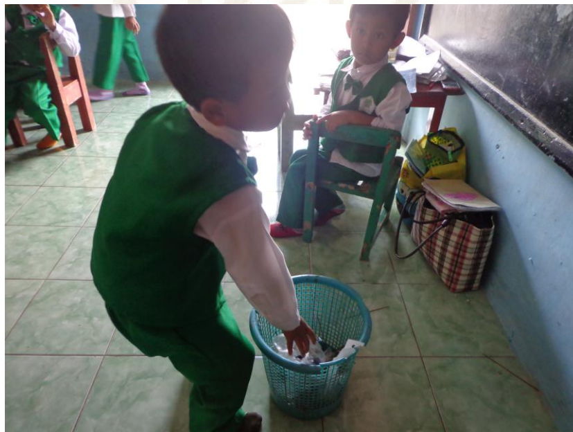
Praktik Role Play “Membuang sampah pada tempatnya”