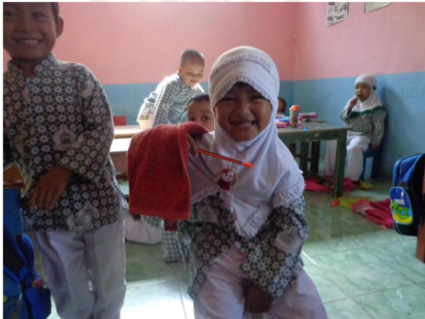
Praktik Role Play “Cara menggosok gigi yang baik”