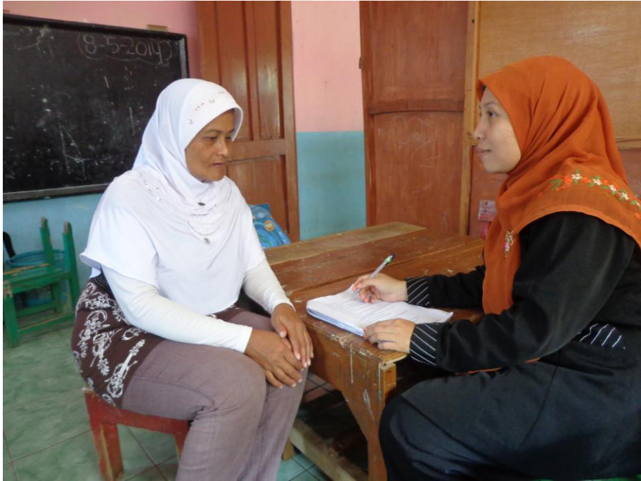
Interview dengan orang tua/pengasuh