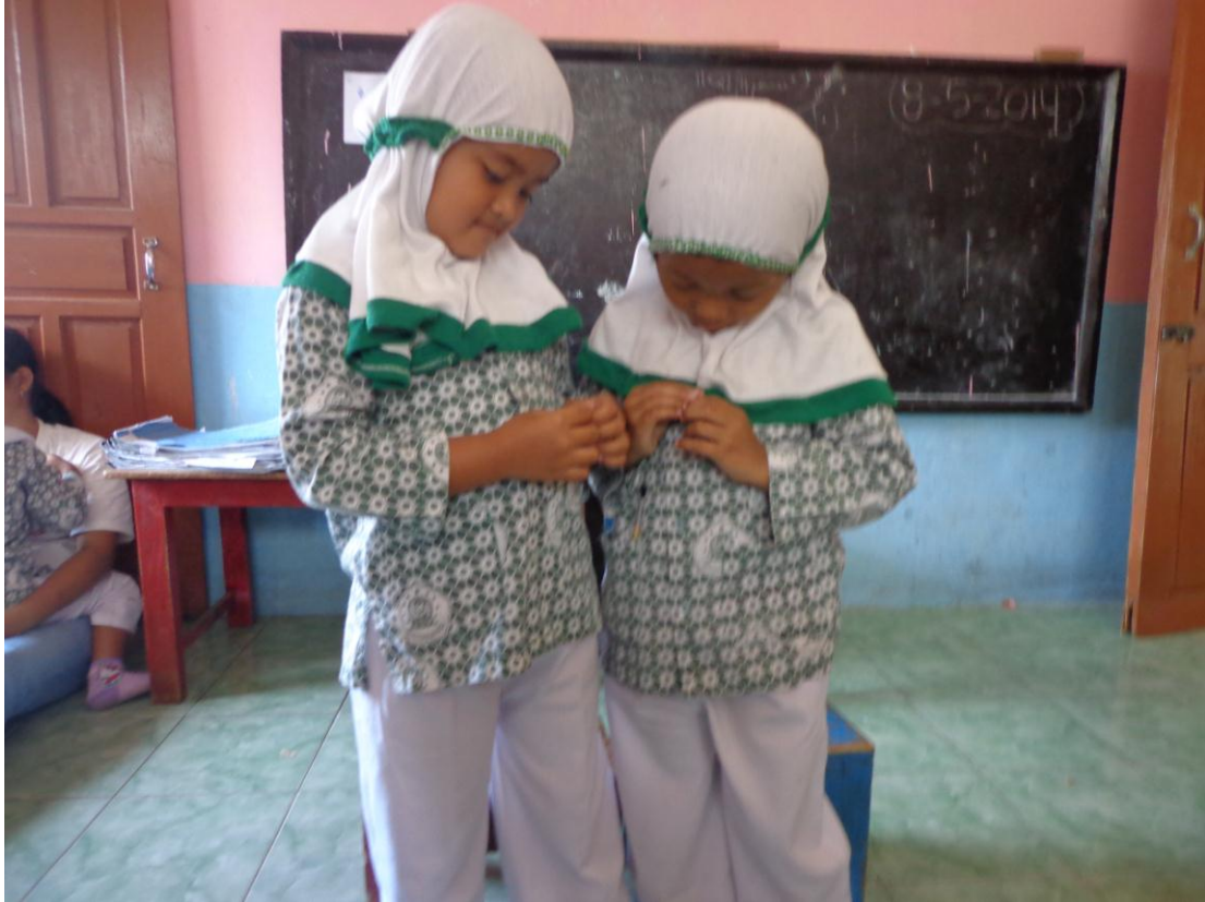
Praktik Role Play “Merawat kebersihan kuku/memotong kuku”