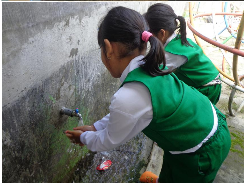
Praktik Role Play “Mencuci tangan dan mengguyur”