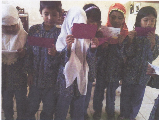
SEORANG SISWA MENYANGGAH HASIL DISKUSI KELOMPOK LAIN