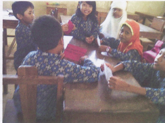
SISWA MENCATAT HASIL DISKUSI