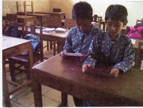
SISWA MENCOCOKKAN KARTU GAMBAR DENGAN TEMANNYA