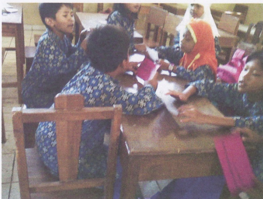
SISWA SALING BEREBut UNTUK SALING BERPRESTASI