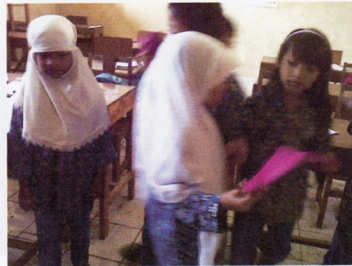
SISWA Diskusi dengan kelompoknya