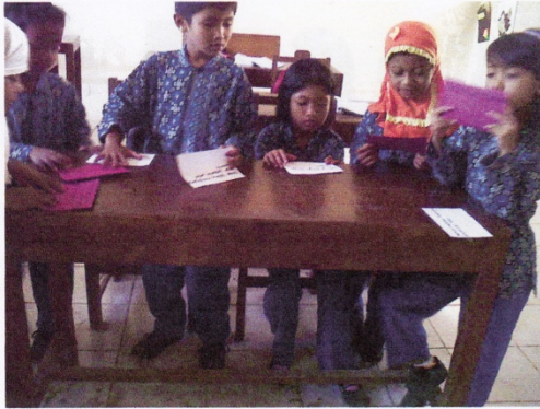
SISWA MENGAMBIL KARTU