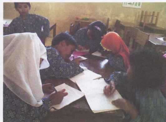
SISWA MENCATAT HASIL DISKUSI