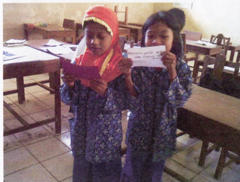
SISWA Mencari teman untuk membentuk kelompok