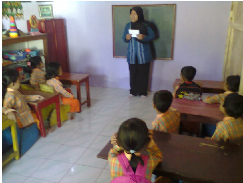
Gambar V : Kegiatan Pembelajaran membilang dengan Kartu Angka Bergambar