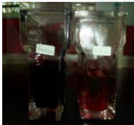
Hematoxylin dan eosin (dari kiri ke kanan)