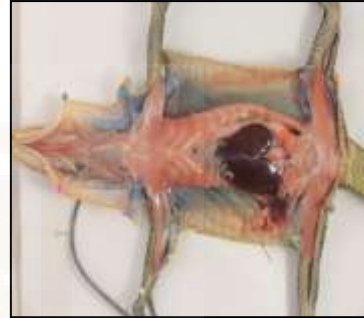
Biawak ( Varanus yuwonoi )