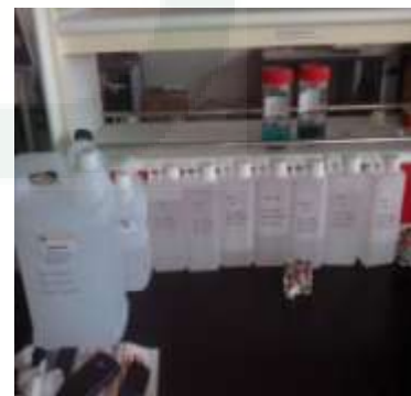
Alkohol 30%- 96%