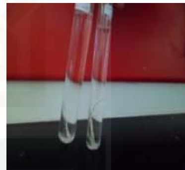
Larutan etanol 96%