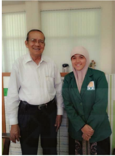
Wawancara dengan narasumber Dinas Pendidikan Bagian XII Yala