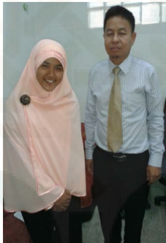
Wawancara dengan narasumber Dinas Pendidikan Swasta Propinsi Pattani