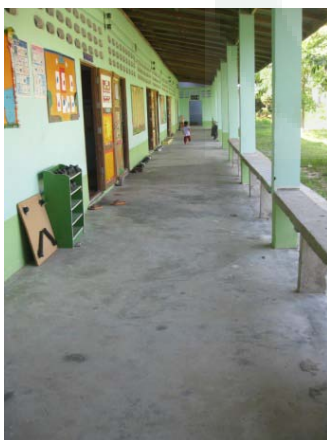
Lingkungan sekolah tingkatan PAUD, TEKA, SD