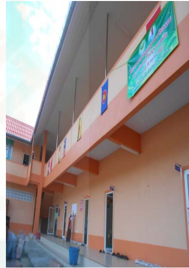
Lingkungan sekolah tingkat SMP, SMA