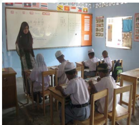
Ruang Kelas sekolah tiingkat SD