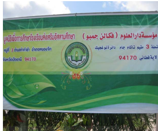
Papan nama sekolah Songserm Islam Seksa (SSIS)