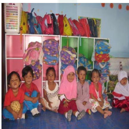
Ruang Kelas sekolah tiingkat PAUD