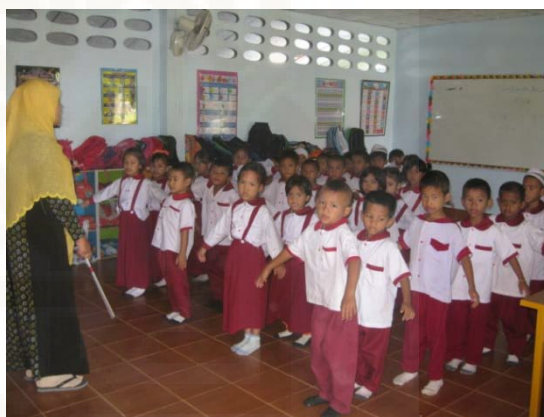
Ruang Kelas sekolah tiingkat TEKA