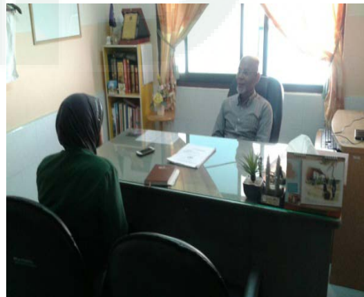
Wawancara dengan Dinas Pendidikan Swasta Kabupaten Nongchik