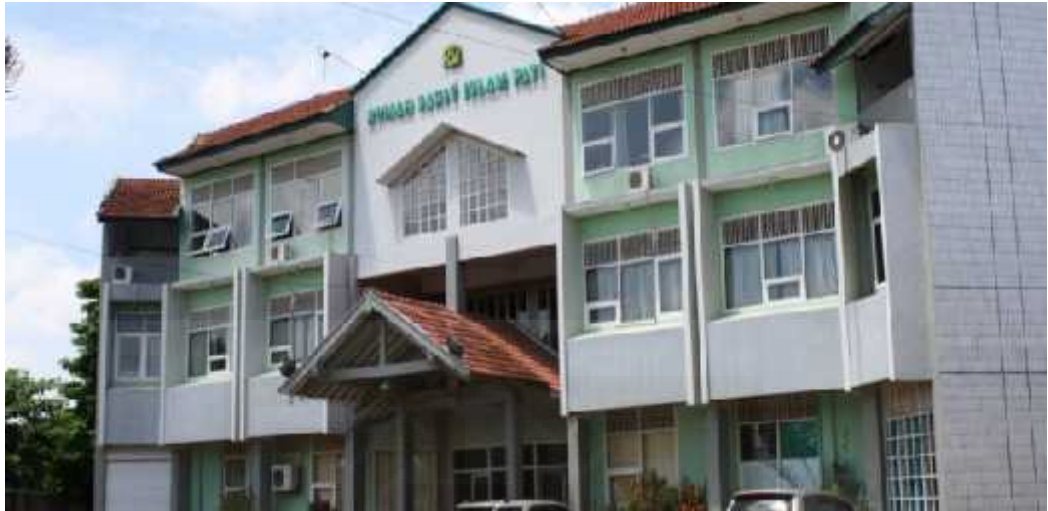
Rumah Sakit Islam Pati di Desa Ngeplak Kidul Kec. Margoyoso