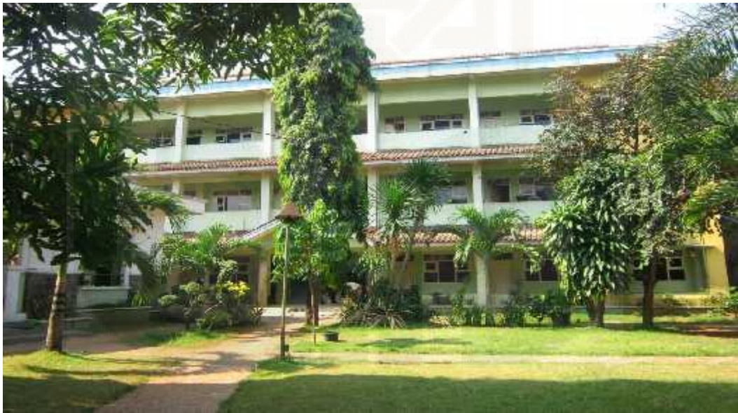
Gedung Pesantren Maslakul Huda Kajen