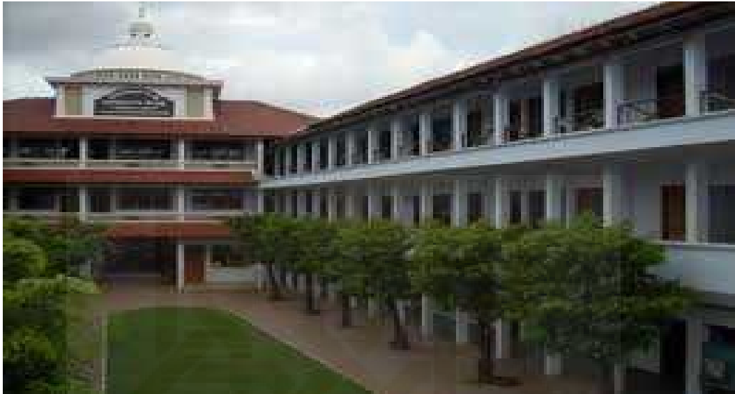
Madrasah Matholi'ul Falah Kajen