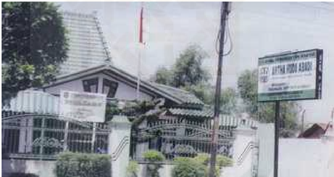
Salah Satu Kantor BPR Arta Huda Abadi di Jl. Tayu-Jepara