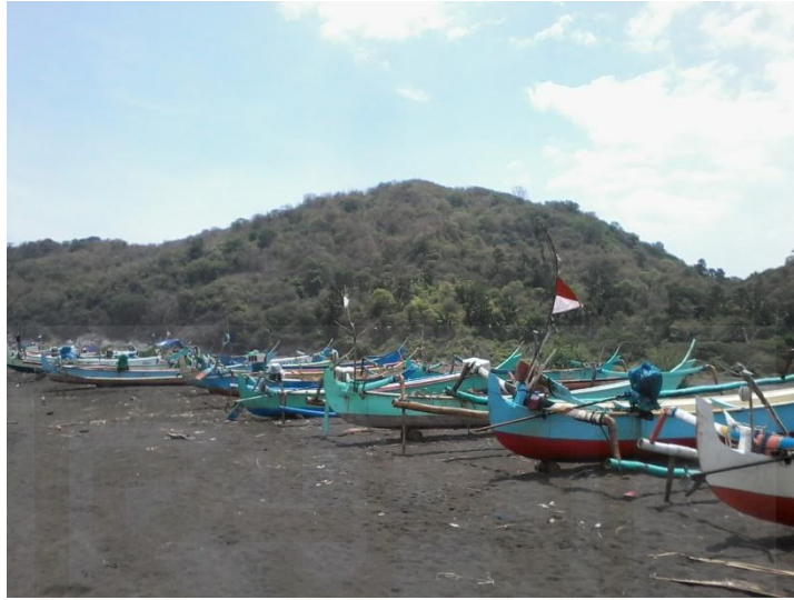
Perahu Nelayan Lampon di Pesisir Pantai Lampon