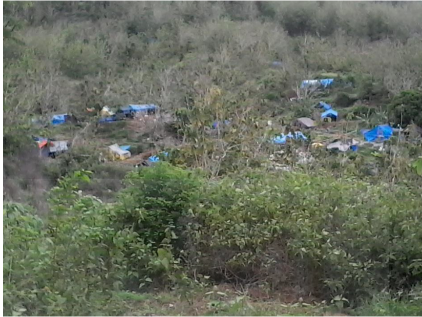
Lokasi Penambangan Gunung Tumpang Pitu