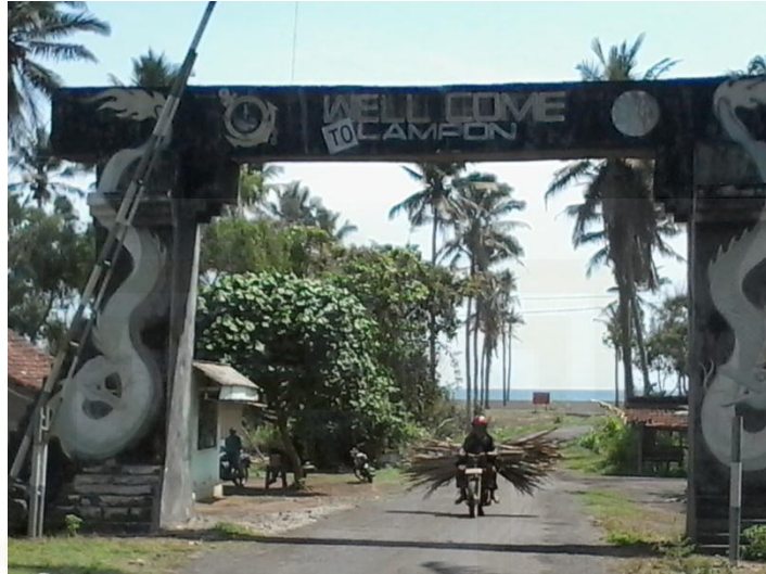
Gapura Lampon Dusun Ringinsari Desa Pesanggaran Kec. Pesanggaran Kab. Banyuwangi