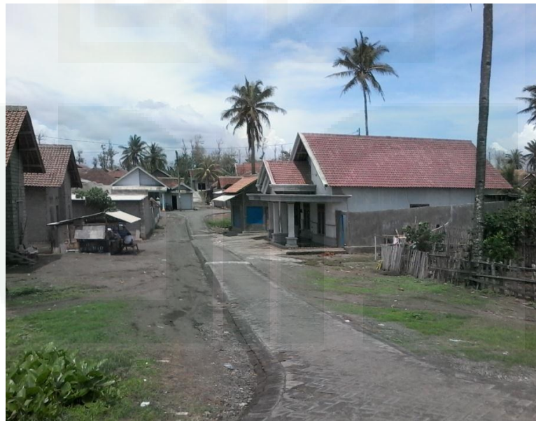
Rumah-Rumah Penduduk Lampon