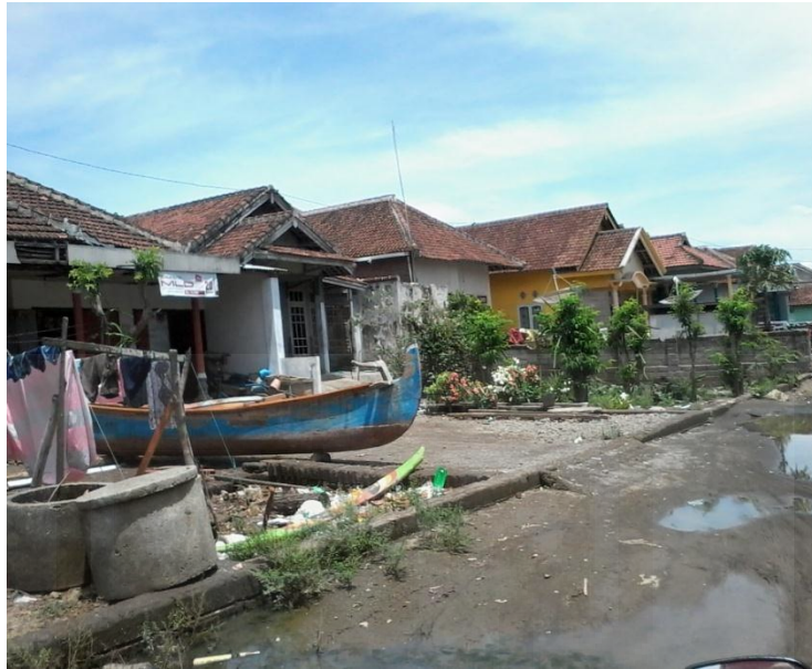
Rumah-Rumah Penduduk Lampon