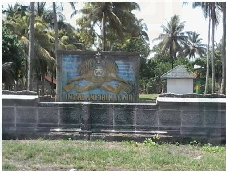
Pangkalan Mariner di Pesisir Pantai Lampon