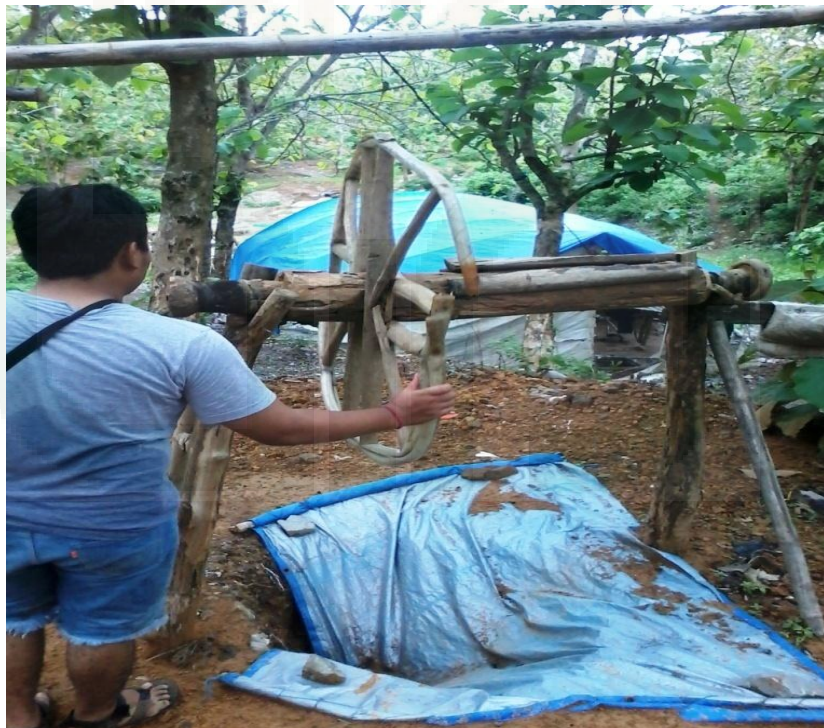
Alat dan Tenda Penambangan di Gunung Tumpang Pitu