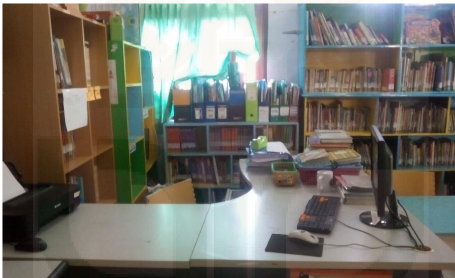
Foto Ruang Perpustakaan SDIT Luqman Al Hakim Internasional