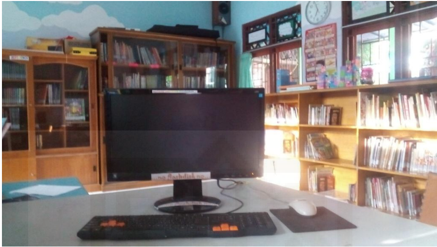
Foto Ruang Perpustakaan SDIT Luqman Al Hakim Internasional