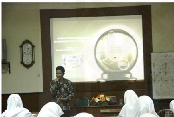
Pustakawan yang sedang menyampaikan materi literasi informasi