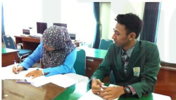
Peneliti yang sedang menyebarkan kuesioner sekaligus wawancara kepada salah satu guru