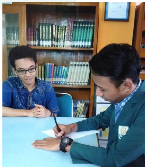
Wawancara dengan salah satu pustakawan