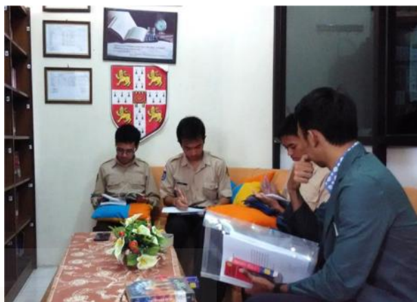
Responden yang sedang mengisi kuesioner