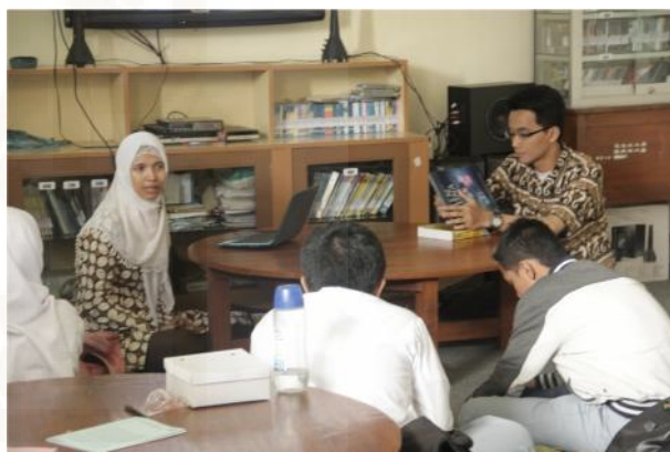
Pustakawan yang sedang memberikan materi dalam kegiatan pendidikan pemakai