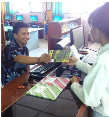
Pustakawan yang sedang melayani pemustaka