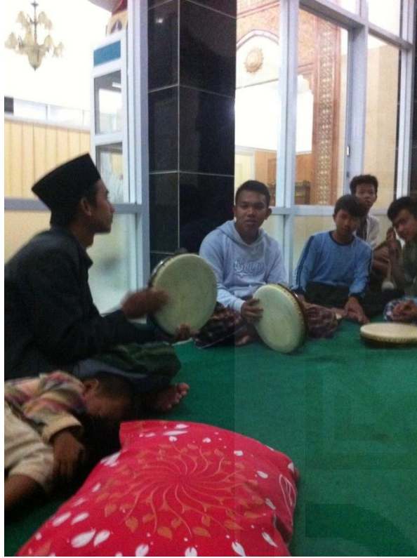
(Kegiatan Hadroh Santri PP. Entrepreneur Ad-Dhuha)