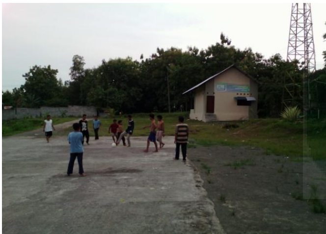
Olahraga Santri Setiap Jum'at Sore