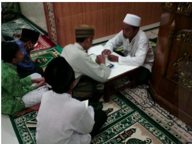
Kegiatan Ngaji Sorogan