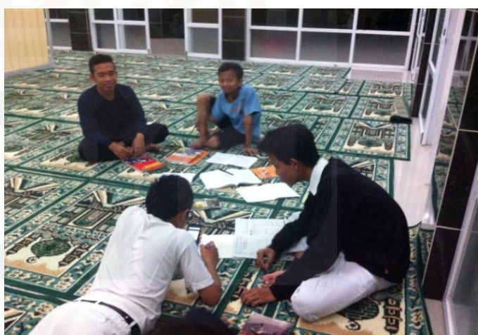
Kegiatan Belajar Mandiri Santri