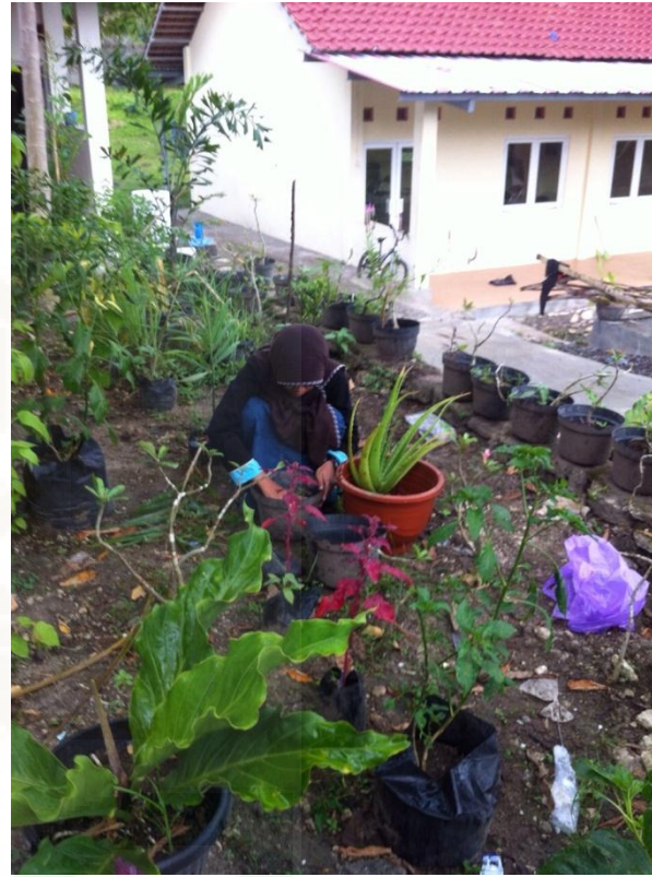
(kegiatan menanam bunga)