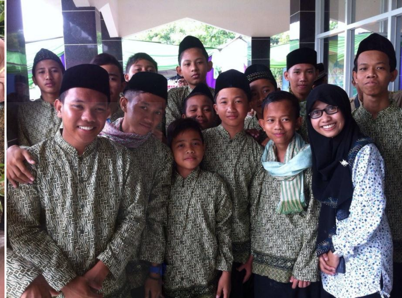
santri Pon-Pes Ad-Dhuha bersama penulis