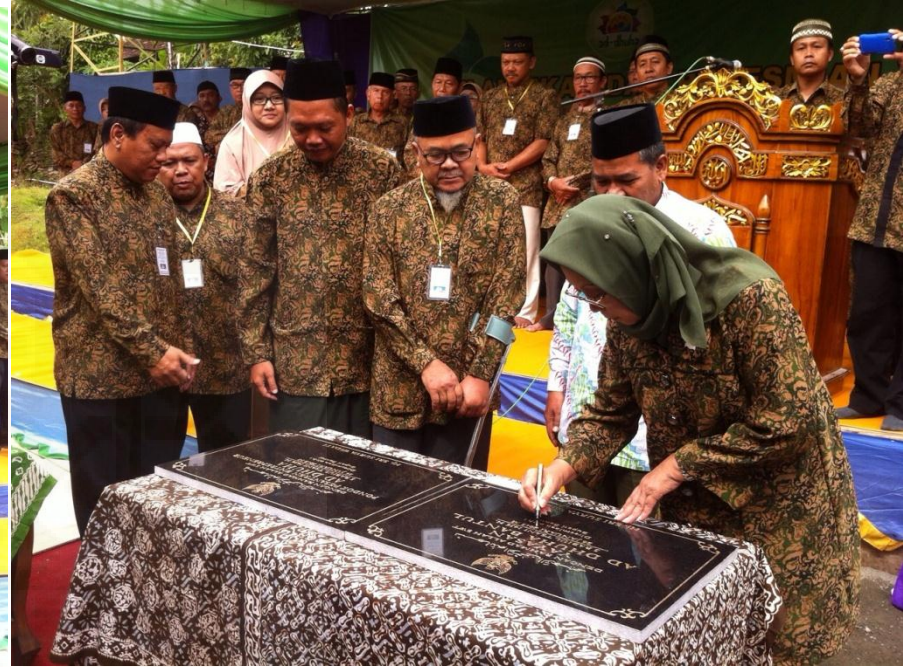
Peresmian Pondok pesantren entrepreneur Ad-Dhuha Bantul Yogyakarta