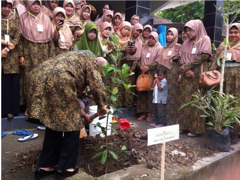
Penanaman pohon penghijauan