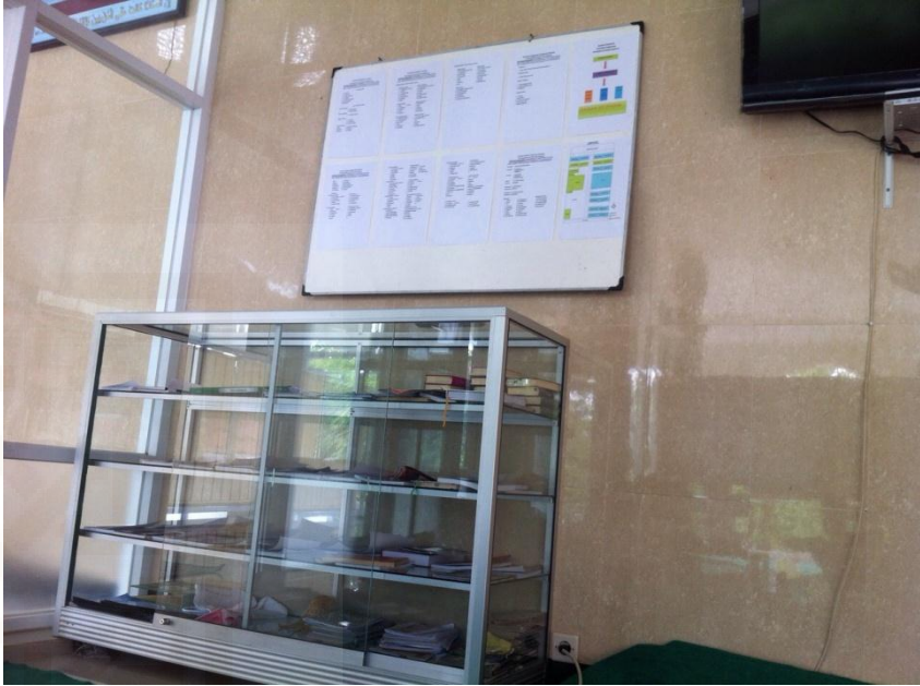
Koprasi Pondok pesantren entrepreneur Ad-Dhuha Bantul Yogyakarta