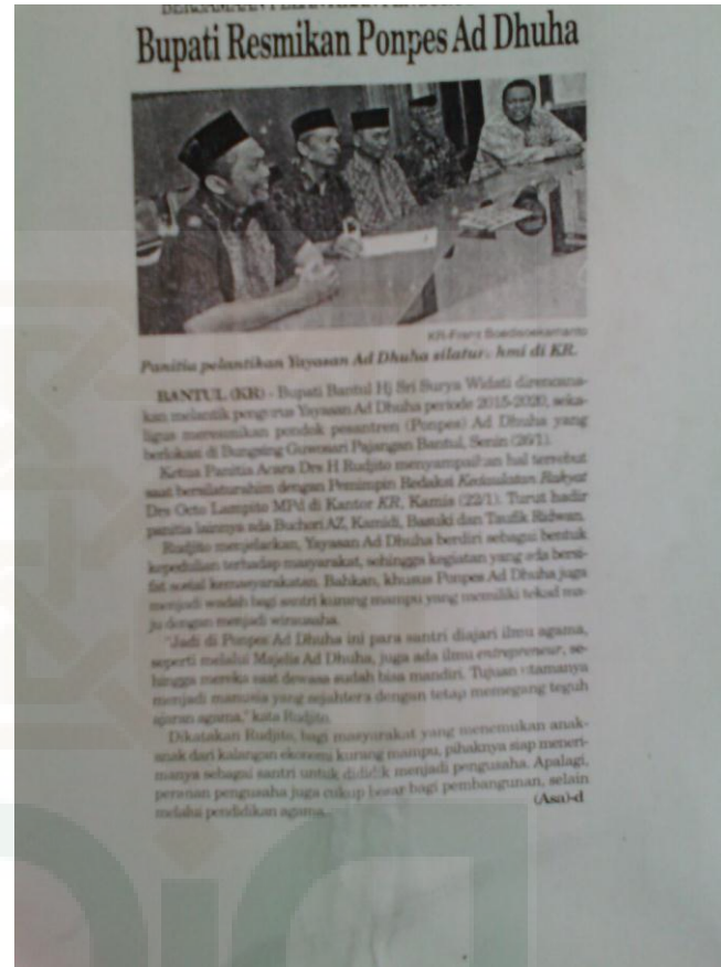
Peresmian Pondok Pesantren Entrepreneur Ad-Dhuha Bantul