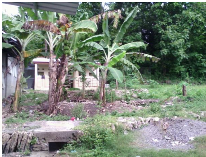
Kebun Pisang untuk kegiatan Budidaya Pisang