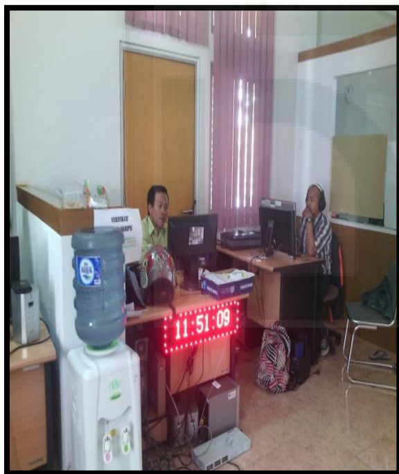
Ruang Bagian informasi Digital