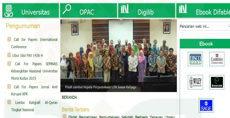
Gambar 1. website perpustakaan UIN Sunan Kallijaga

dituangkan dalam bentuk cetak, non cetak atau dalam bentuk elektronik seperti : digital library, e-book, e-journal serta layanan berbasis online yang lain. Informasi yang dapat diakses tersebut merupakan salah satu perkembangan informasi yang membuat perpustakaan ikut andil dalam mengembangkan layanan perpustakaan berbasis website . Sarana ini akan membantu dan memudahkan pemustaka dalam mencari informasi di dalam sebuah perpustakaan. Sebagai contoh kita dapat melihat tampilan website perpustakaan UIN Sunan Kalijaga Yogyakarta yang terlihat menarik pada tampilan antar muka di bawah ini :