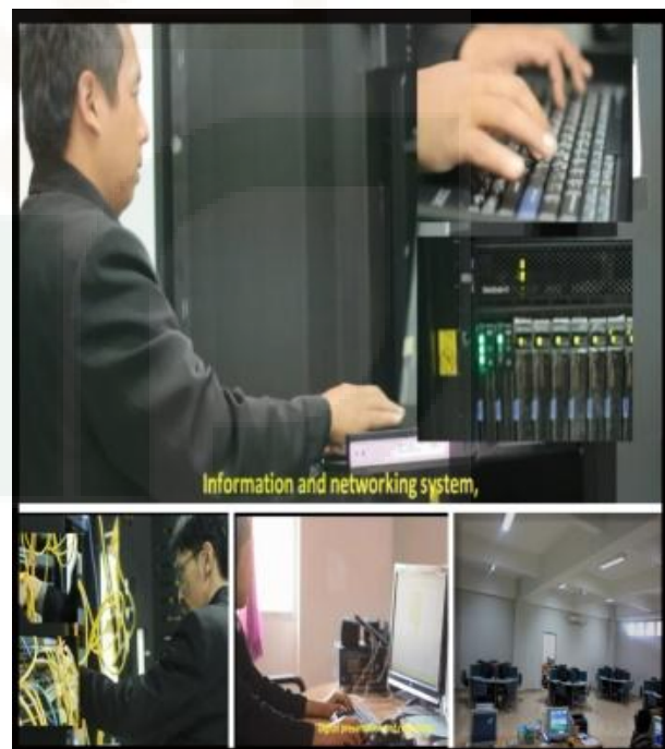
Informasi dan Jaringan Sistem