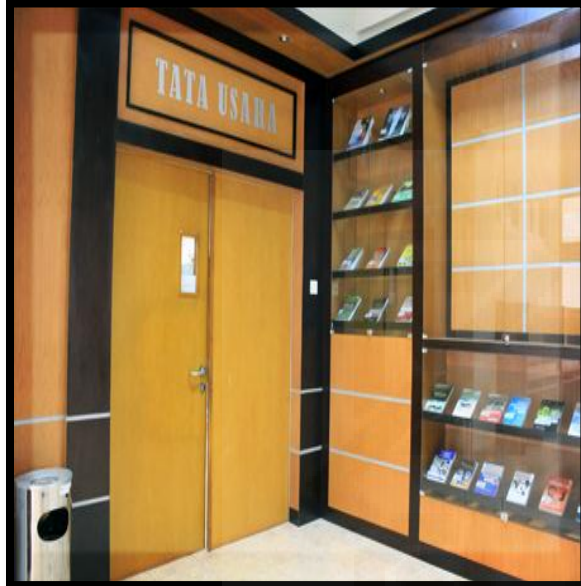
Rang Tata usaha