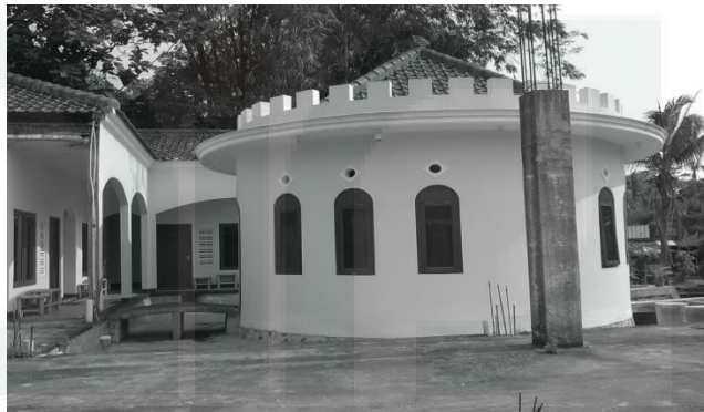
Gambar 14. Home Stay Terbaru KAS