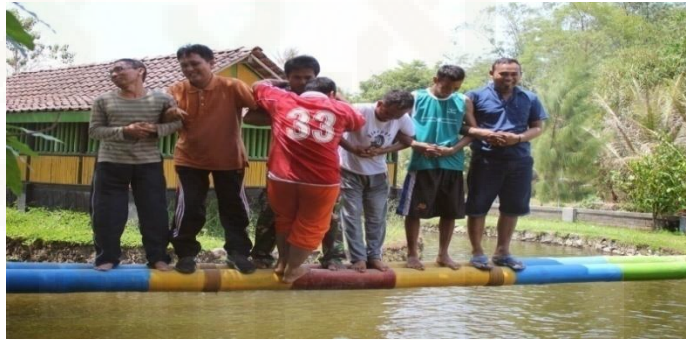
Gambar 10. PT Sumekar Mengikuti Outbound Family Gathering

Dalam mempererat tali silaturahmi antar keluarga karyawan dapat menumbuhkan rasa kekeluargaan yang tinggi dalam sebuah perusahaan yang memungkinkan akan meningkatkan kinerja demi kejayaan perusahaan.