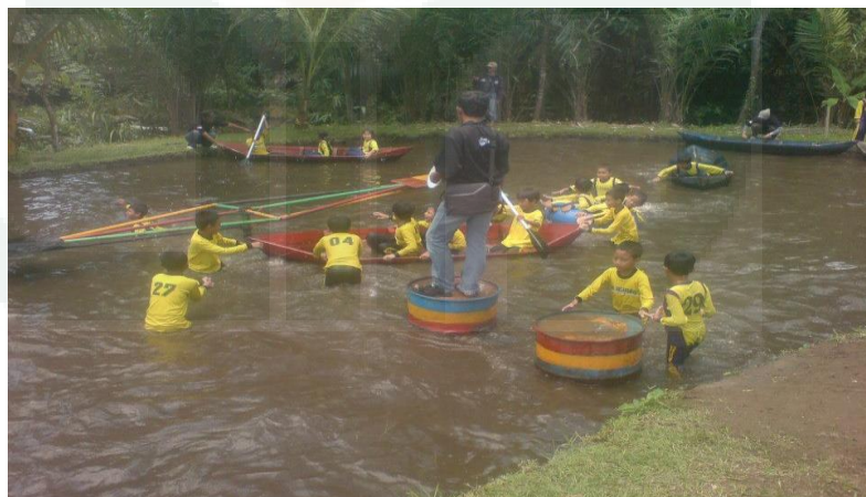
Gambar 5. Outbound SD Jetisharjo (19 April 2014)