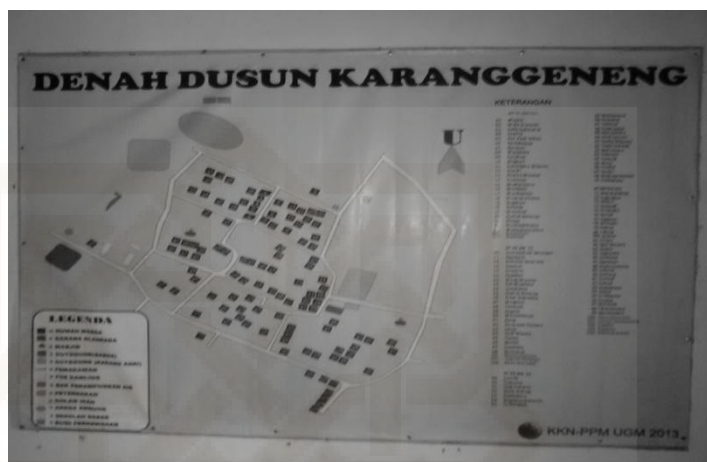
Gambar 1. Denah Dusun Karanggeneng

Sebelah barat Dusun Karanggeneng berbatasan langsung dengan Dusun Gabungan yang masuk dalam wilayah Kecamatan Turi, karena Dusun Karanggeneng merupakan wilayah Kecamatan Pakem yang paling barat.