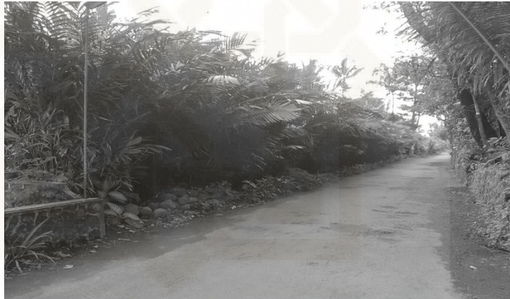
Gambar 2. Perkebunan Salak

masih terdiri dari sawah pertanian, serta kebun salak pondoh yang luasnya melebihi lahan permukiman penduduk. Sepanjang jalan di dusun Karanggeneng akan banyak ditemui pohon-pohon salak yang ditanam di pinggir jalan, di perkebunan maupun pohon salak yang ditanam di teras rumah penduduk. Penanaman pohon salak pondoh di daerah ini mulai dikenal sekitar tahun 1975, sebagian besar mendapatkan benih salak pondoh dari Dusun Sorowulan dan Kadilobo.