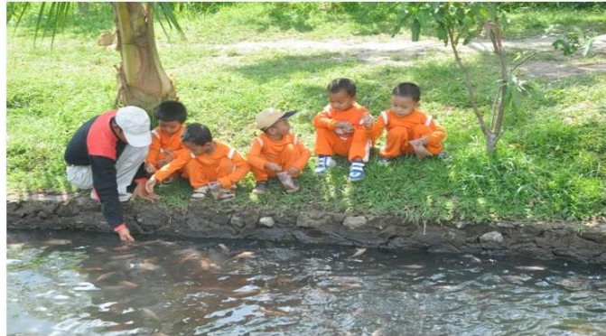
Gambar 6. Memberi Makan Ikan