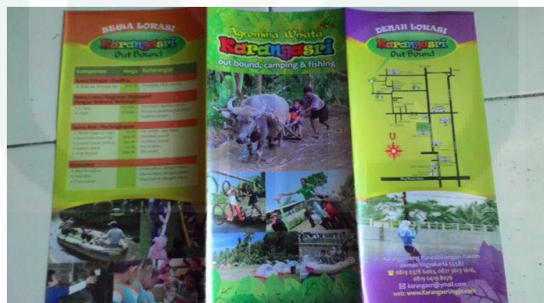
Gambar 24. Brosur KAS

Penyebaran informasi dengan cara ini sangat umum dilakukan oleh berbagai pihak dalam mempromosikan produk dan keunggulan yang dimiliki oleh suatu perusahaan. Selain cara penyebaran lembaran brosur yang dapat dilakukan di mana saja, untuk memahami isinya juga tidak memerlukan keahlian tertentu.