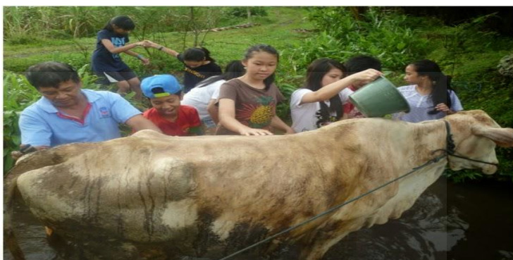
Gambar 17. Memandikan Sapi