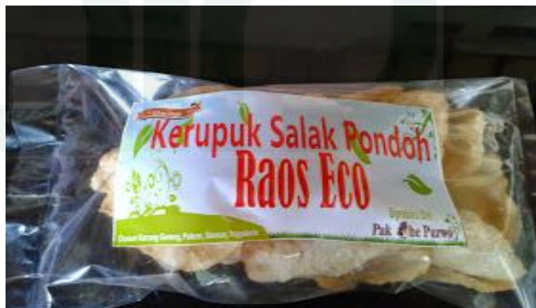
Gambar 25. Olahan Salak Pondoh di Karanggeneng

Selain menyediakan layanan Catering di KAS, para ibu-ibu yang tergabung dalam kelompok pengolahan salak Palwa dan Salwa. Dapat menjual hasil olahannya kepada para pengunjung yang datang ke KAS. Proses penjualannya dilakukan dengan asongan atau langsung digabungkan dengan paket perkebunan sebagai suvenir yang dapat dibawa pulang. 134