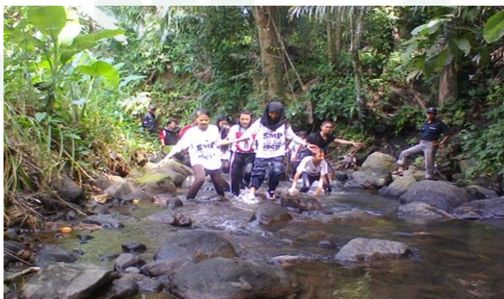
Gambar 9. Susur Sungai