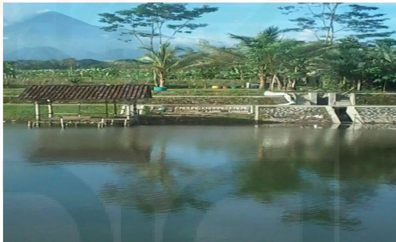
Gambar 4. Embung Karanggeneng

yang dapat mewujudkan konsep desa Wisata Purwobinangun. Salah satu usahanya dengan mendirikan Embung (danau kecil) Karanggeneng di atas tanah kas desa di daerah persawahan Dusun Karanggeneng pada tahun 2008. Dengan fungsi utama sebagai konservasi air pada musim penghujan, embung seluas 1,1 hektar menjadi sarana pendukung pembangunan Desa Purwobinangun di bidang pariwisata dan pemanfaatan potensi alam secara maksimal warga Dusun Karanggeneng pada khususnya dan Desa Purwobinangun pada umumnya. Pembangunan embung dimulai pada tahun 2008 sampai tahun 2009. 72