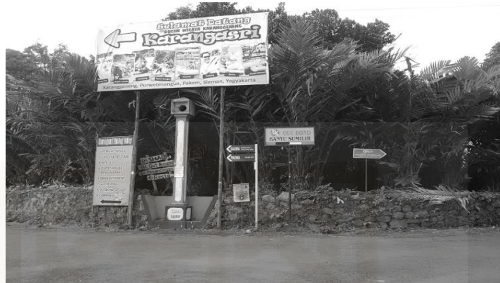
Gambar 23. Plang ke KAS, dan Dusun wisata Karanggeneng.

keunggulan wisata argo, dan keberadaan KAS sebagai sentral pariwisata di Dusun Karanggeneng.