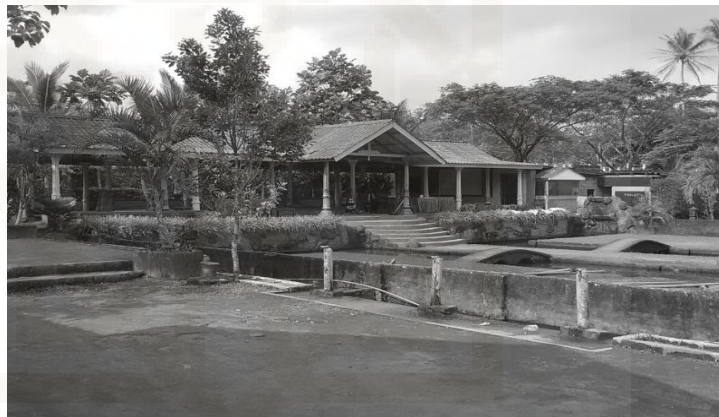
Gambar 21. Pendopo 1