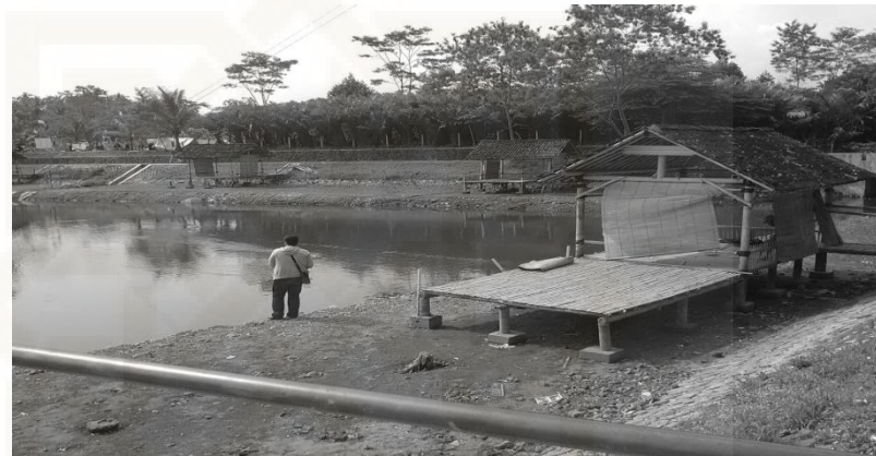
Gambar 26. Pemandangan Embung Karanggeneng

Selain sebagai pusat pasokan air, embung juga digunakan untuk fasilitas pemancingan dengan latar belakang gunung Merapi yang akan terlihat saat siang hari.