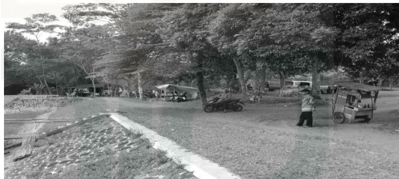
Gambar 27. Warung dekat Kawasan KAS

Selain warung terdapat beberapa warga yang menjual aneka makanan lainnya kepada pengunjung dalam bentuk penjual asongan. Tidak hanya warung saja yang berjualan disana, terdapat sekitar 13 orang penjual asongan yang berjualan ketika suasana ramai pengunjung di KAS, mereka menjual aneka gorengan, manisan salak, dan es krim. Mereka semua tidak akan memiliki banyak pelanggan jika dikawasan itu tidak ada KAS, karena yang akan datang hanya pelanggan dari penduduk Dusun Karanggeneng saja, tetapi berkat adanya KAS yang memiliki pengunjung dari berbagai tempat, jumlah orang yang akan membeli juga semakin banyak.