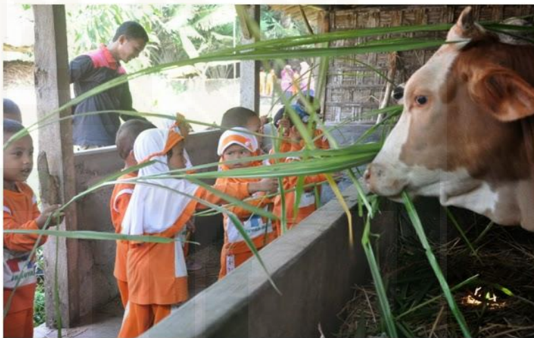
Gambar 13. Memberi Makan Sapi

Selain paket utama berupa outbound , susur sungai, camping ground , dan pemancingan, desa wisata Karangasri juga memiliki wisata minat khusus lainnya. Paket wisata khusus tersebut antara lain paket pertanian, paket perkebunan, paket peternakan, dan paket budaya. Semua kegiatan tersebut akan didampingi oleh mentor yang memiliki kompetensi di bidangnya. 95