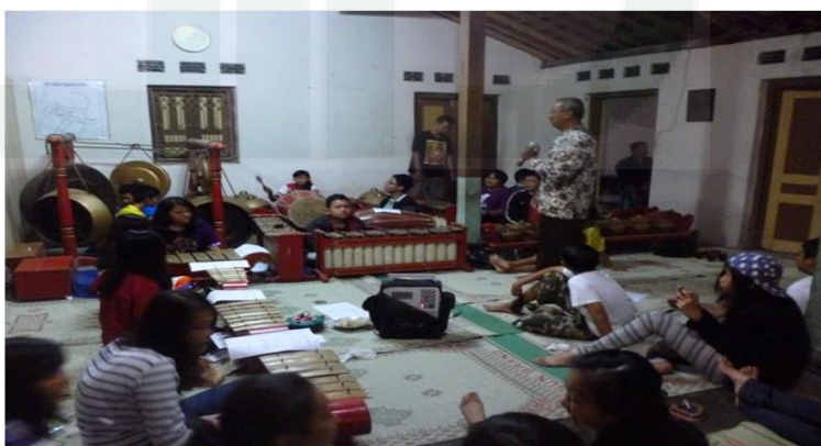
Gambar 18. Karawitan

Bagi para pengunjung yang ingin belajar kesenian Karawitan KAS memiliki mentor yang siap memberi pelatihan singkat ( Short course ) dan pengetahuan tentang kesenian Karawitan. Paket ini dilakukan di rumah kepala Dusun Karanggeneng, karena memang beliau yang memiliki tempat yang cukup luas untuk menyimpan peralatannya.