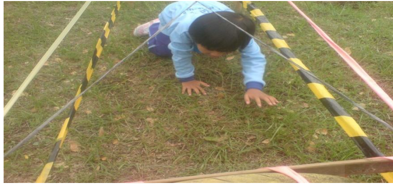
Gambar 8. Salah satu Fun Game paket Fun Kids