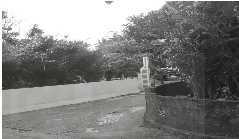
Gambar 3. Jalan Cor Block Dusun Karanggeneng

dengan dana swadaya masyarakat, dan dana dari bantuan KAS. Sehingga pembangunan jalan di Dusun Karanggeneng bisa merata. 69