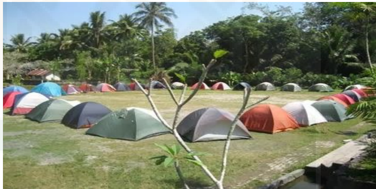
Gambar 12. Suasana Camping Family Camp