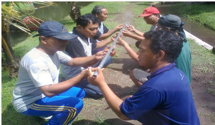
Gambar 11. Para Karyawan yang Melakukan Outbound