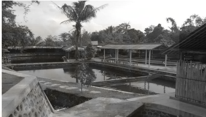
Gambar 15. Kolam Pemancingan

yang umum ada dipemancingan lainnya. Dengan system catch and release (ikan berhasil ditangkap pemancing sendiri) dan kiloan. Tersedia juga kolam yang dapat disewa untuk mengadakan event mancing. 98