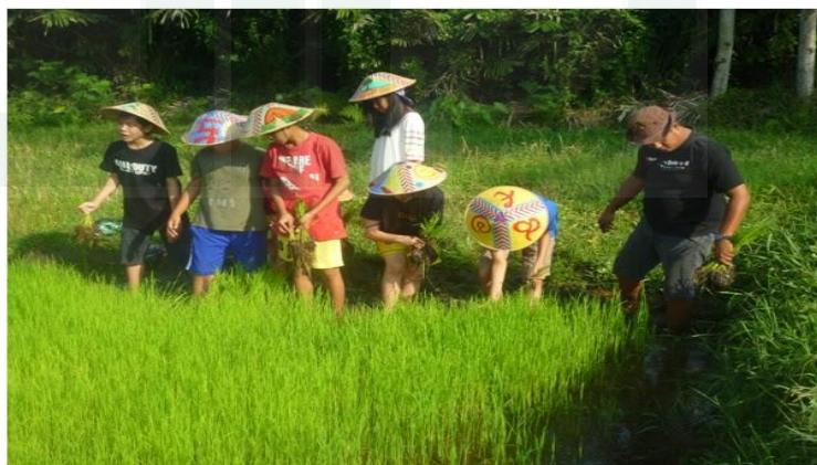
Gambar 20, Pengunjung yang Memakai caping hasil lukisnya