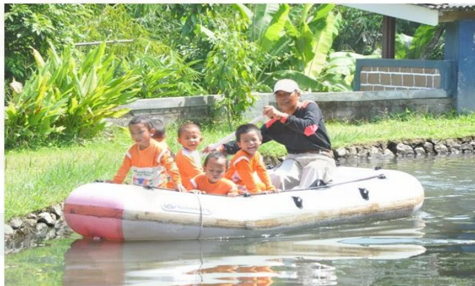
Gambar 7. Wisata Perahu

4) Fun Game . Fasilitas ini adalah salah satu fasilitas yang cukup Privasi , karena merupakan strategi KAS dalam memberikan kepuasan kepada pengunjung. Namun gambaran umumnya adalah bermacam-macam permainan yang disepakati antar kedua belah pihak. Macam permainannya menggunakan berbagai alat permainan yang telah dimiliki oleh KAS. Jenis permainan untuk paket ini telah disesuaikan dengan tingkat kemampuan anak-anak.