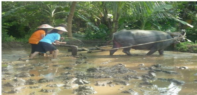
Gambar 16. Membajak Sawah

Pengunjung yang memilih paket pertanian akan mendapatkan pengalaman membajak sawah menggunakan kerbau, naik ke punggung kerbau, dan menanam padi dengan pengawasan dari bapak-bapak yang telah ditunjuk. 99