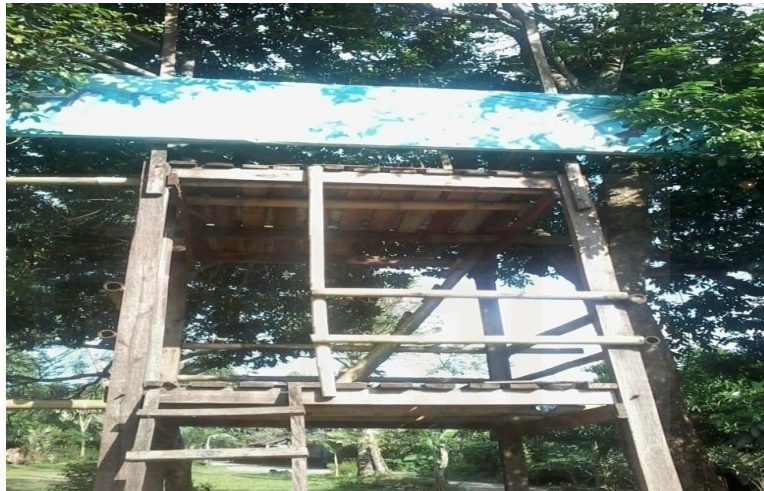
Gambar 19. Wahana Flying Fox