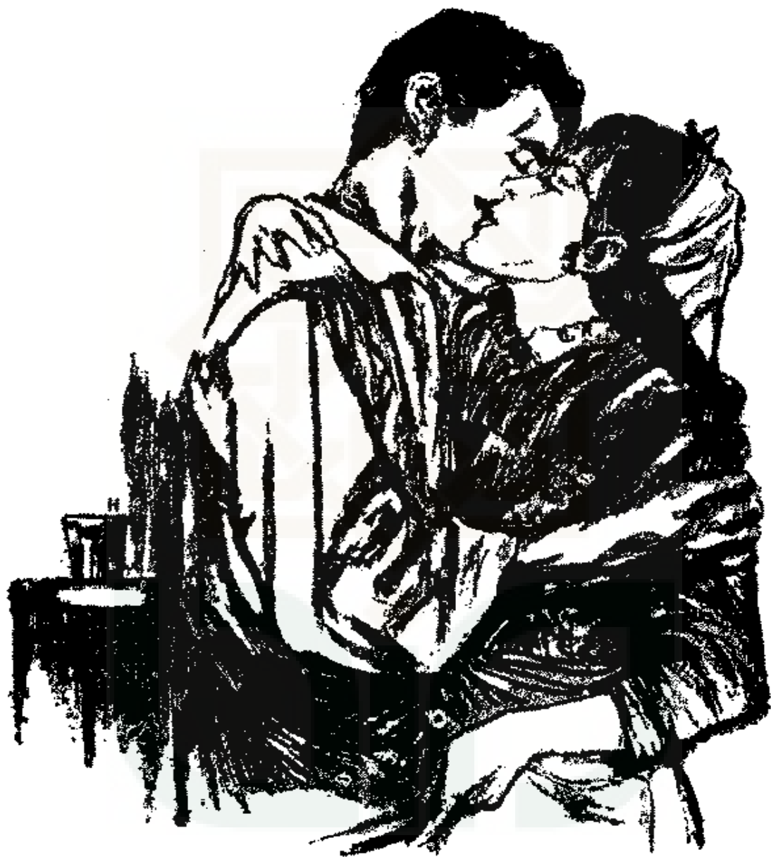
فاحتويتها بذراعي و قبلت خدها