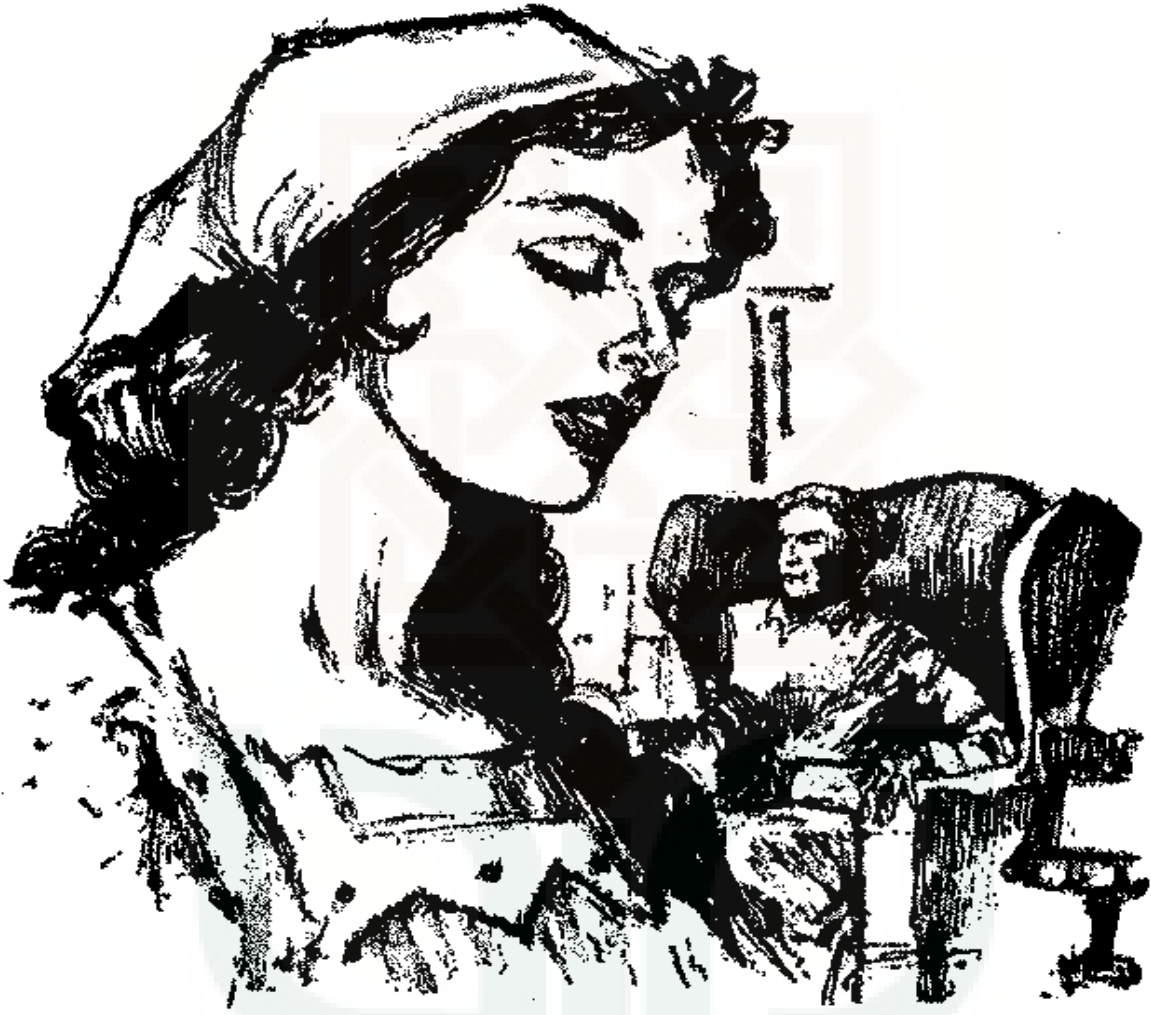
زهرة بنت رجل طيب يا مسيو عامر