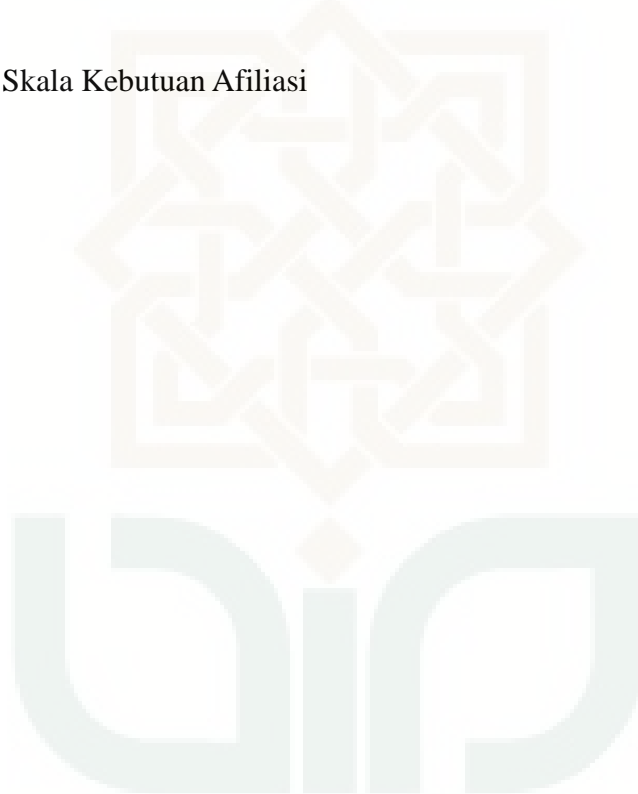
Lampiran 16. Tabulasi Data Penelitian Skala Kebutuhan Afiliasi