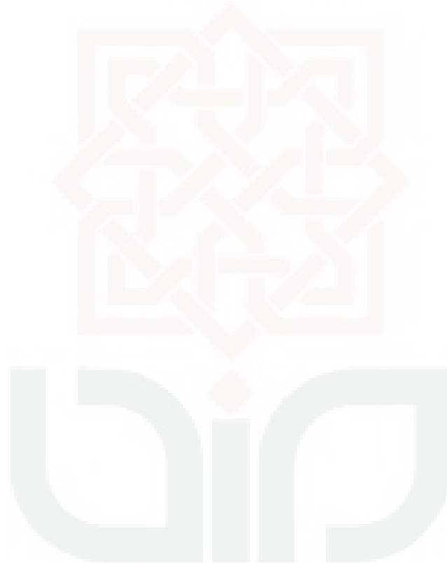
Lampiran 17. Uji Normalitas dan Uji Linieritas