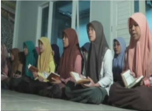
Santri mengikuti Pengajian Al-Qur'an Ba'da Subuh, pada 4 Mei 2015