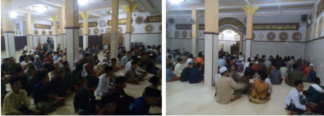
Praktik pembacaan al-Qur'an surat al-Wāqī'ah (Santri Putra) pada 29 April 2015