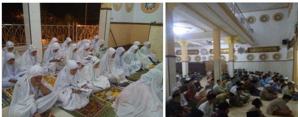
Praktik pembacaan al-Qur'an surat Yāsīn pada 30 April 2015