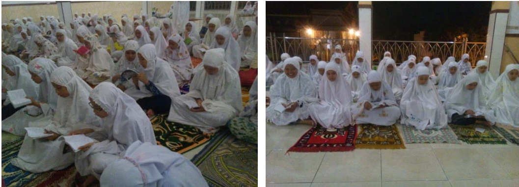
Praktik pembacaan al-Qur'an surat al-Wāqī'ah (Santri Putri) pada 29 April 2015