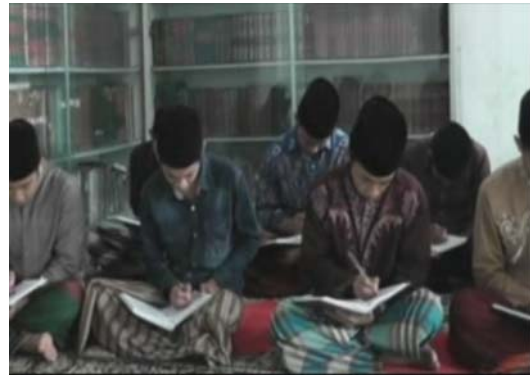
Santri mengikuti Pengajian Kitab Pagi (Tafsir Rawā'i' Al-Bayān ), 3 Mei 2015