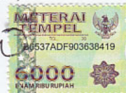
Oktavia Nugraheni NIM. 11110037