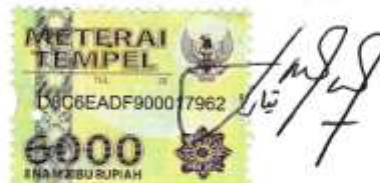
Tiara Yucha NIM. 11110130