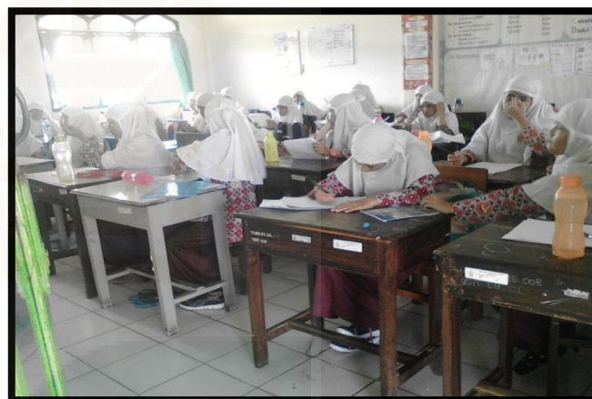
Siswa kelas 5 mengisi angket penelitian