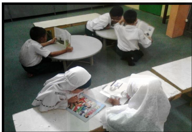
Belajar Tematik di Perpustakaan