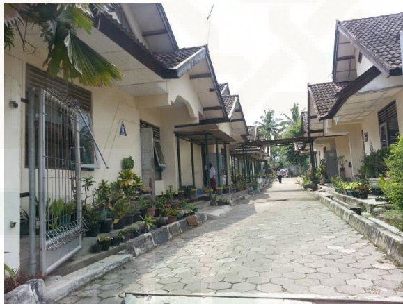
Gambar 7: Foto keadaan wisma panti di BRSPA (Balai Rehabilitasi Sosial dan Pengasuhan Anak) Sleman, Yogyakarta