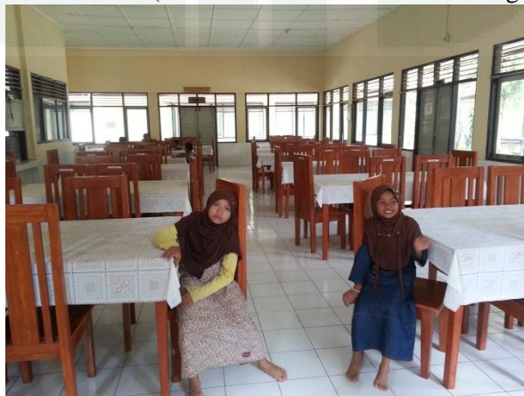
Gambar 8: Foto ruang makan BRSPA (Balai Rehabilitasi Sosial dan Pengasuhan Anak)

Sumber: Dokumentasi Peneliti, Februari 2016