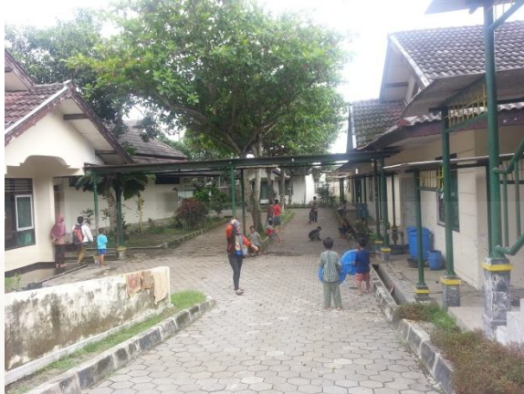
Foto anak – anak BRSPA (Balai Rehabilitasi Sosial dan Pengasuhan Anak) Sleman, Yogyakarta saat melakukan kerja bhakti membersihkan lingkungan Panti