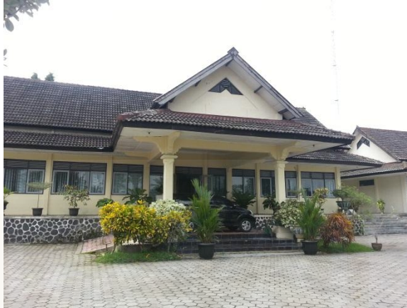
Gambar 6: Foto tampak depan gedung BRSPA (Balai Rehabilitasi Sosial dan Pengasuhan Anak) Sleman, Yogyakarta