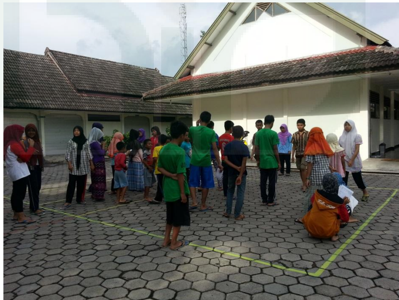
Gambar 2: Foto anak – anak BRSPA (Balai Rehabilitasi Sosial dan Pengasuhan Anak) Sleman, Yogyakarta saat mengikuti kegiatan rutin apel sore.