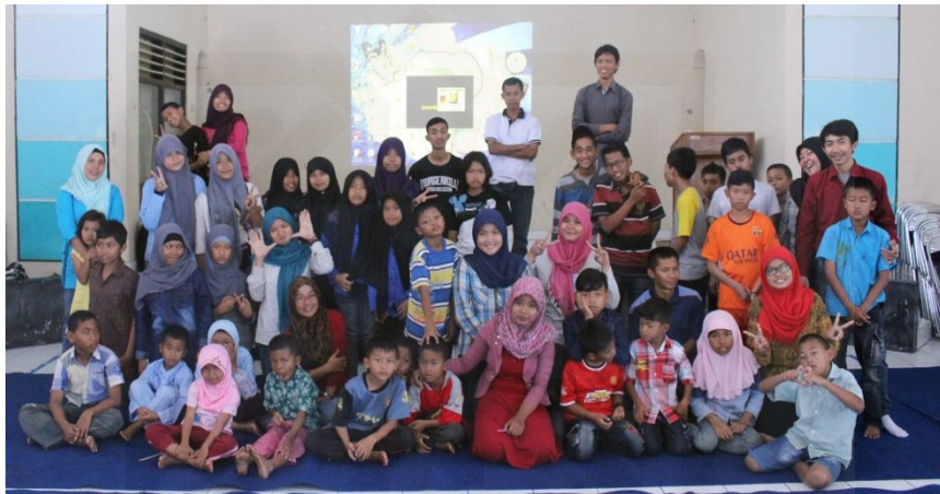
Gambar 1: Foto anak – anak BRSPA (Balai Rehabilitasi Sosial dan Pengasuhan Anak) Sleman, Yogyakarta