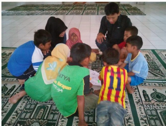
Foto anak – anak BRSPA (Balai Rehabilitasi Sosial dan Pengasuhan Anak) Sleman, Yogyakarta saat belajar bersama dengan peneliti