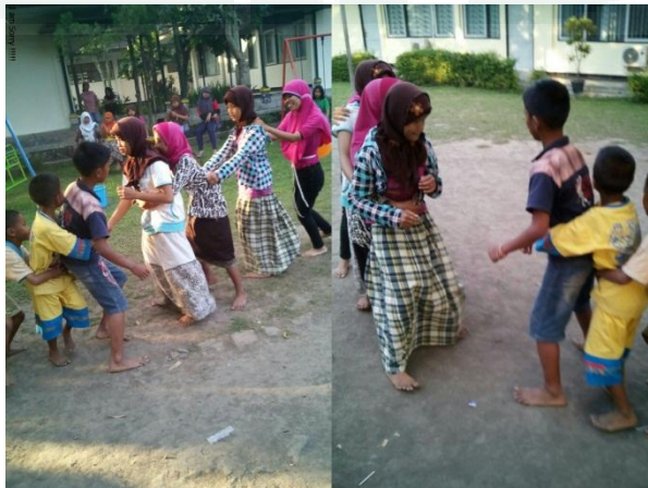
Foto anak – anak BRSPA (Balai Rehabilitasi Sosial dan Pengasuhan Anak) Sleman, Yogyakarta saat bermain outbond bersama peneliti