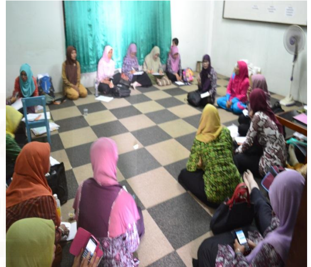
Gambar: Rapat Kordinator Kecamatan