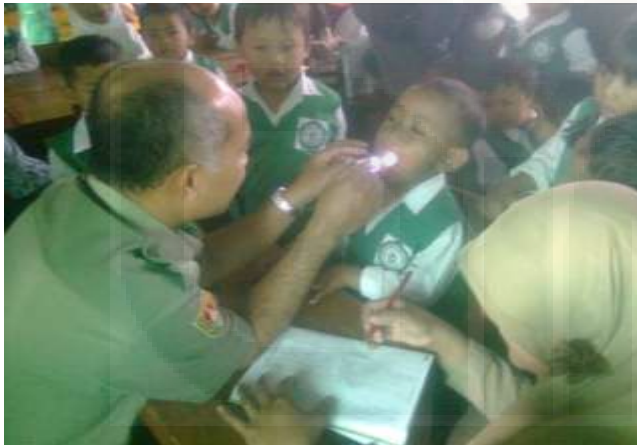
Gambar: Pemeriksaan Kesehatan Kerjasama dengan Puskesmas