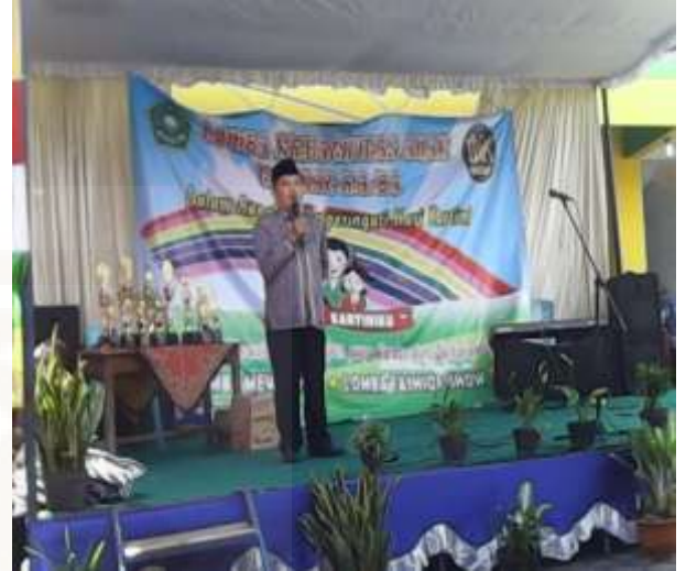
Gambar: Sambutan Kasi Dikmat dalam acara Lomba Kreasi Anak, kerjasama IGTKM dengan KEMENAG