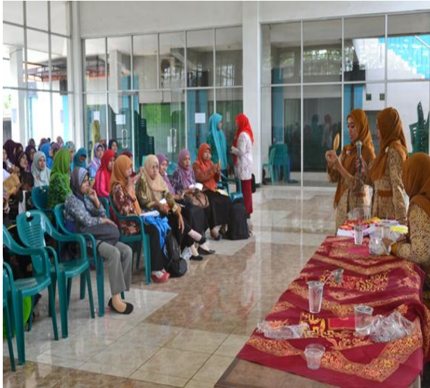
Gambar: Pelatihan Rutin Jum'at Kedua