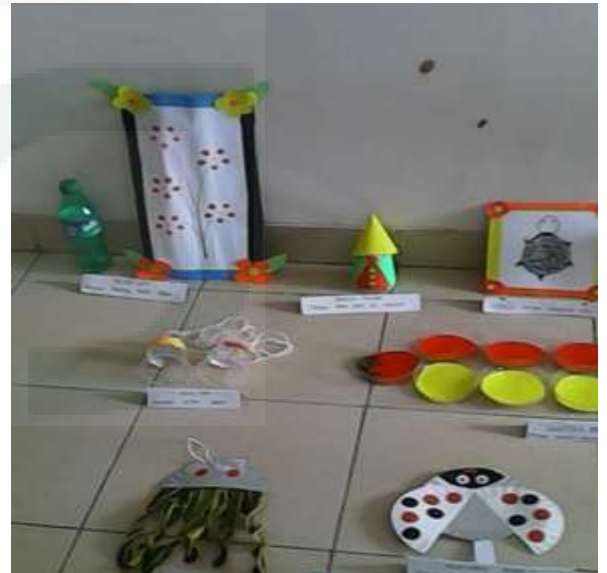
Gambar: Hasil Karya Guru