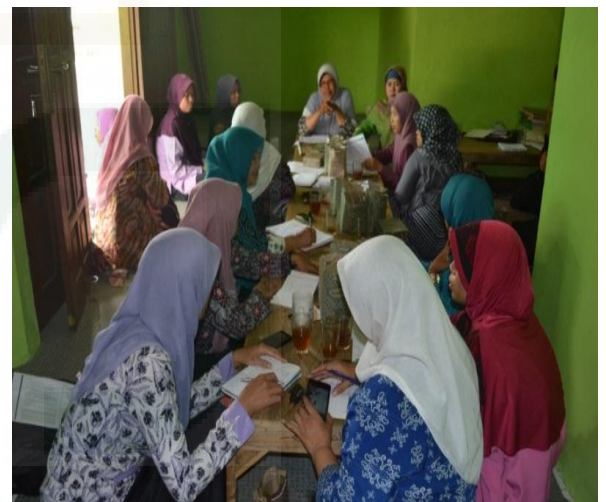
Gambar: Rapat Kordinasi dengan YPM