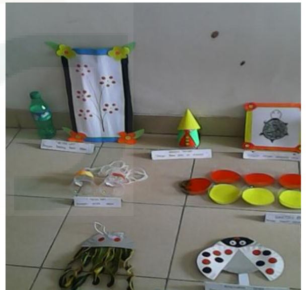
Gambar: Hasil Karya Guru