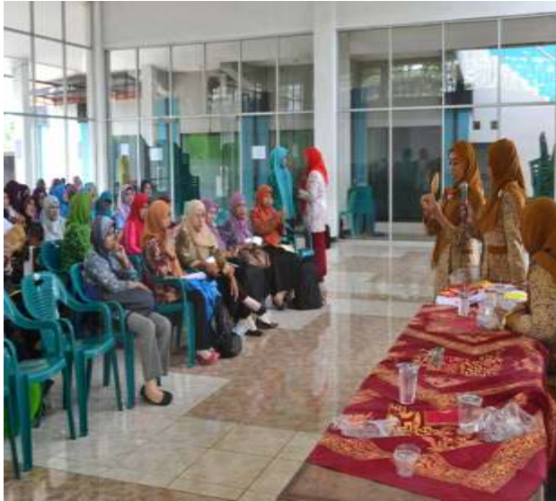
Gambar: Pelatihan Rutin Jum'at Kedua