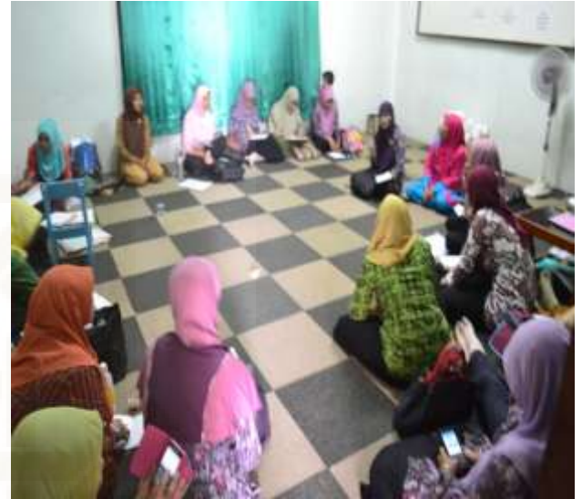
Gambar: Rapat Kordinator Kecamatan