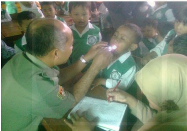
Gambar: Pemeriksaan Kesehatan Kerjasama dengan Puskesmas