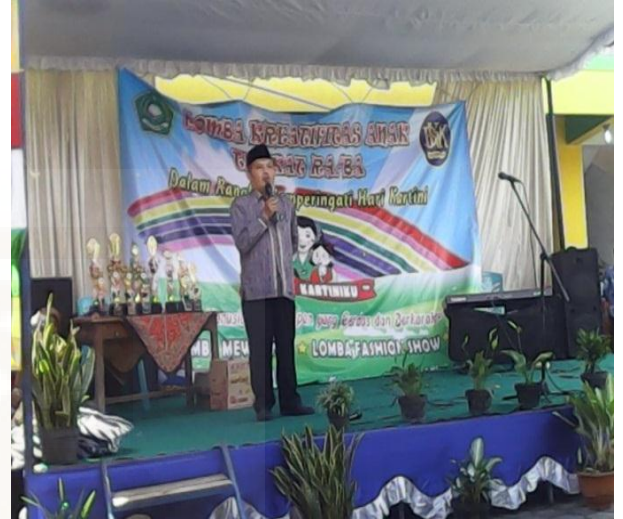
Gambar: Sambutan Kasi Dikmat dalam acara Lomba Kreasi Anak, kerjasama IGTKM dengan KEMENAG