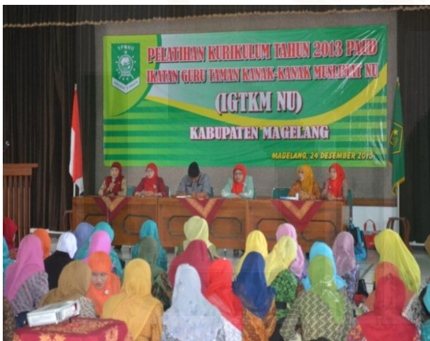
Gambar: Pelatihan Kurikulum