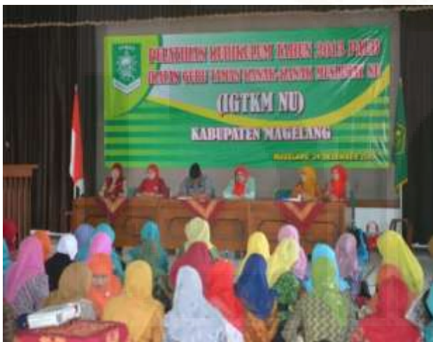
Gambar: Pelatihan Kurikulum