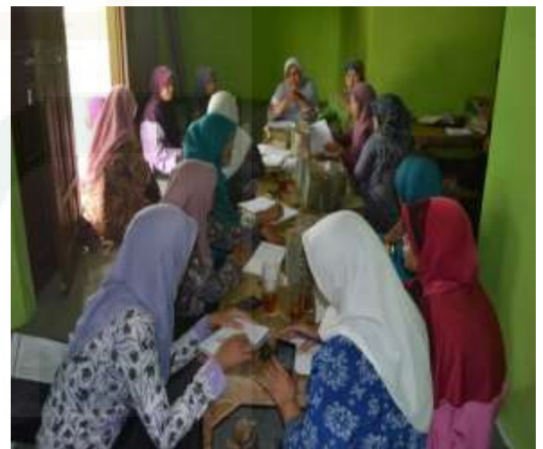
Gambar: Rapat Kordinasi dengan YPM