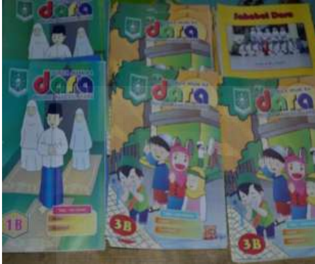
Gambar: Majalah Dara terbitan IGTKM Kab. Magelang