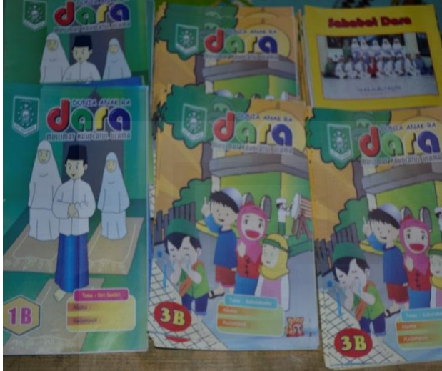
Gambar: Majalah Dara terbitan IGTKM Kab. Magelang