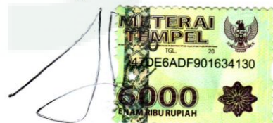
Fikri Amali 08238025

Yogyakarta, 27 Januari 2016 Yang menyatakan