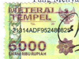
Sri Wahyuningsih 09110025