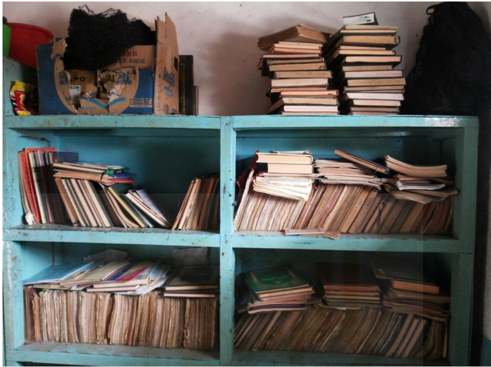
Gambar 5. Susunan Kitab Santri