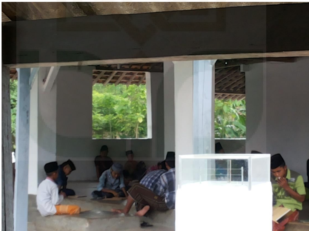
Gambar 6. Santri sedang Musawwarah Kitab