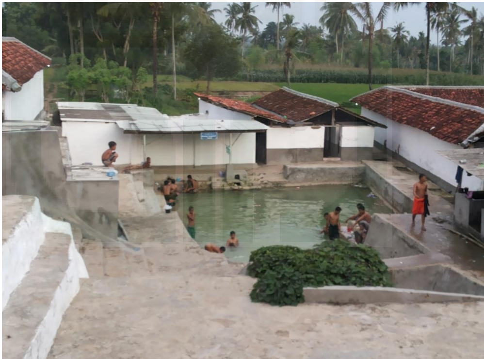
Gambar 10. Santri di Waktu Mandi di Taman