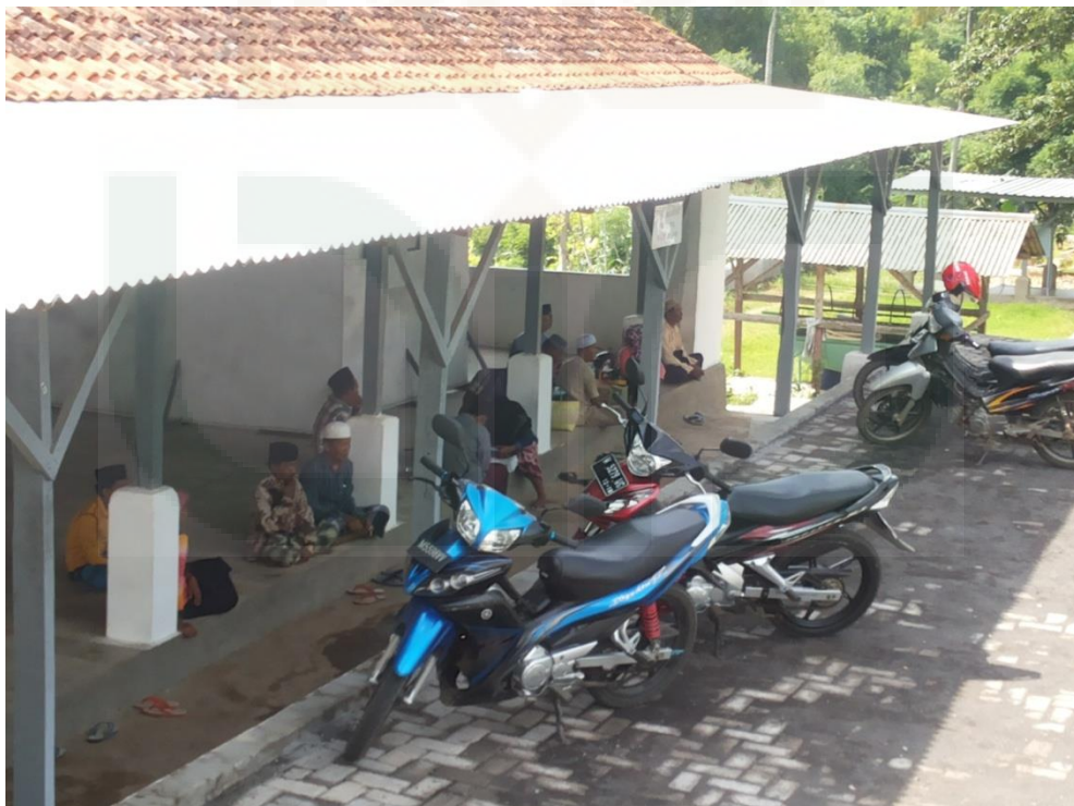
Gambar 8. Suasana Santri pada Waktu Kunjungan