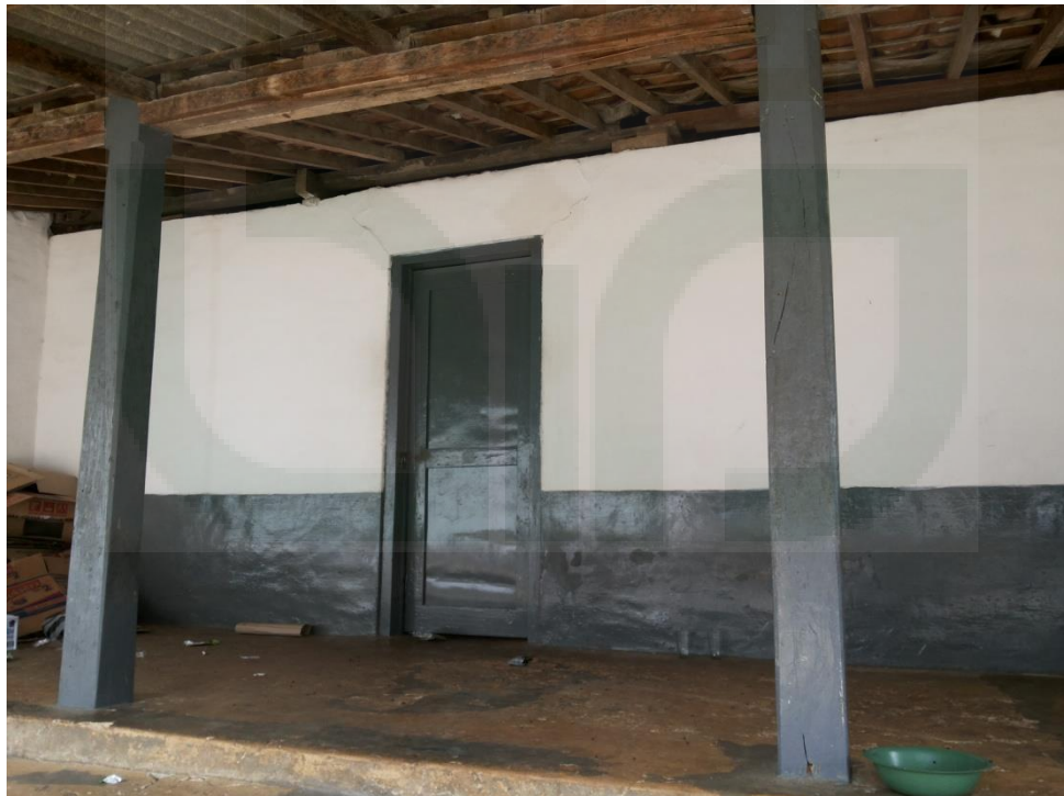
Gambar 2. Koperasi Pondok Pesantren