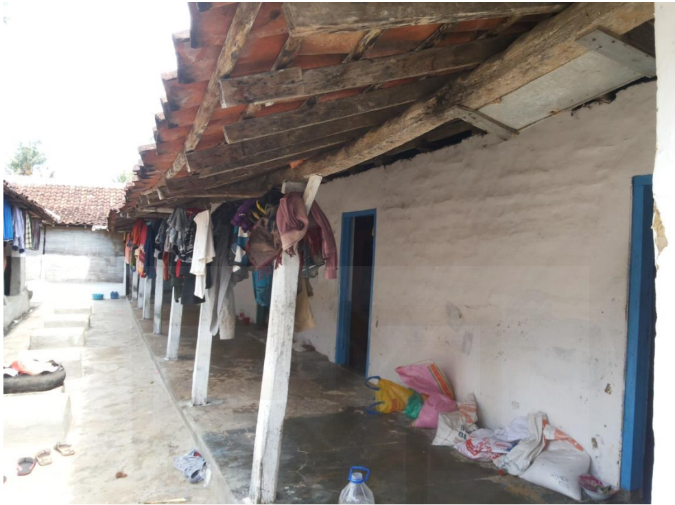
Gambar 3. Kamar Santri dari Luar