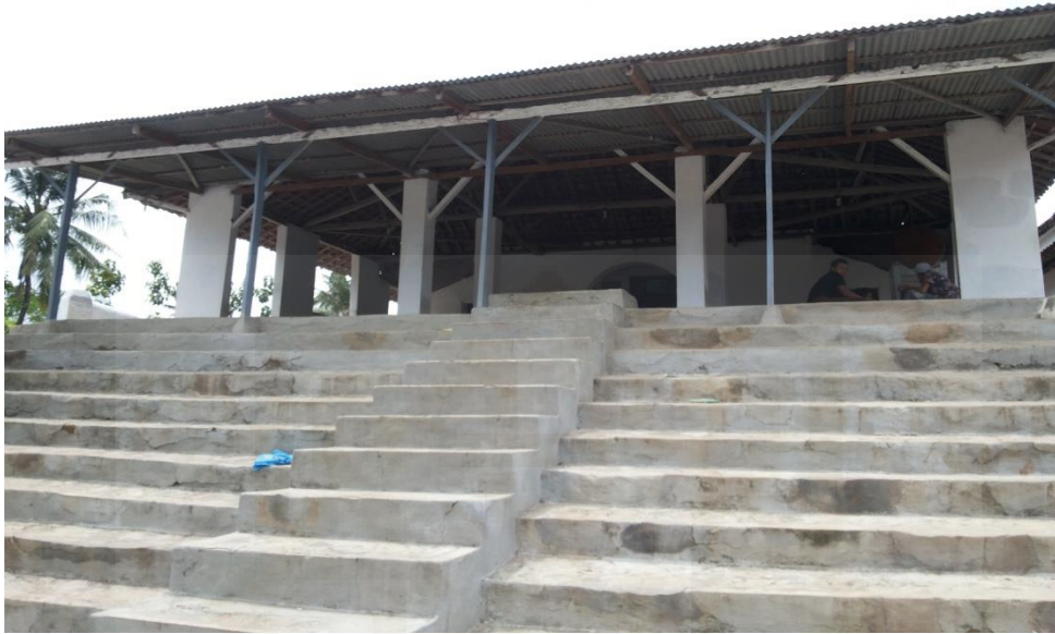
Gambar 1. Masjid Pondok Pesantren