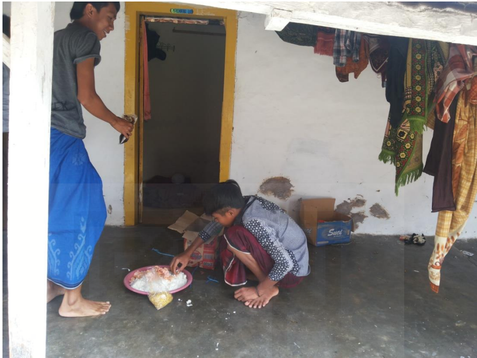
Gambar 9. Santri di Waktu Makan