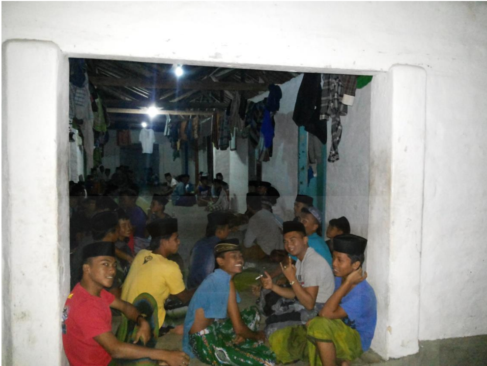
Gambar 7. Santri Sedang Baca Tamrin setiap Malam Jumat dan Senin