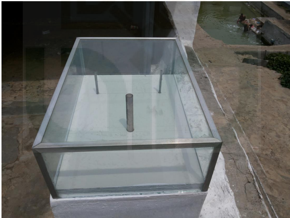
Gambar 4. Jam Matahari