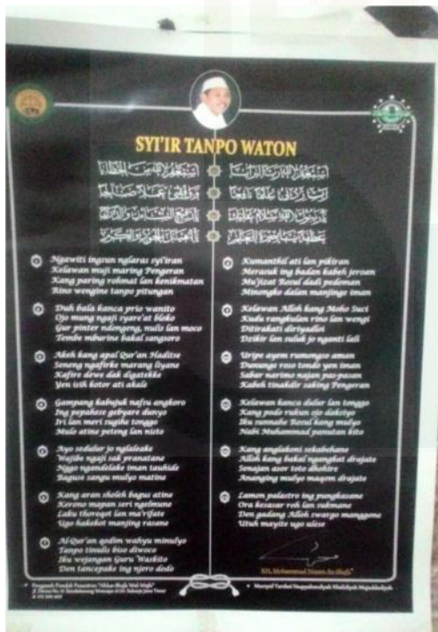
Tanggal 18 Mei 2016