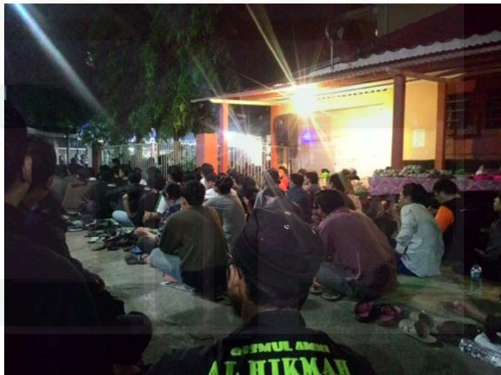
Gambar 2. Jamaah Maiyah Cak Nun saat mengikuti pengajian