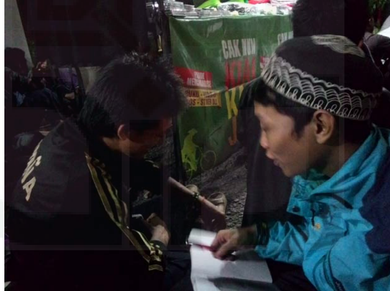
Gambar 4. Proses wawancara dengan informan