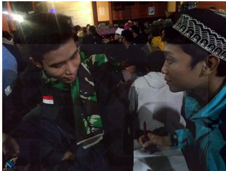
Gambar 1. Proses wawancara dengan informan