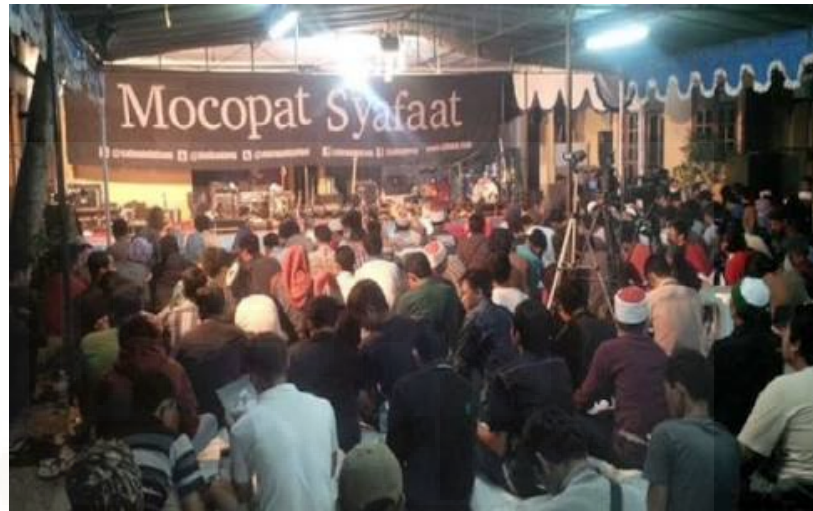
Gambar 3. Proses pengajian Mocopat Syafaat