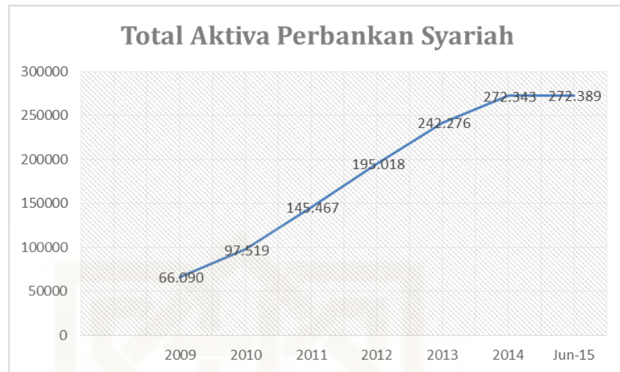
Grafik 1. Total Aktiva Perbankan Syariah 4

Dari beberapa gejolak krisis yang terjadi di Indonesia kekuatan perbankan syariah dalam menahan dampak krisis ekonomi global di Indonesia telah terbukti pada 1998. Berdasarkan pengumuman Badan Pengawas Perbankan Nasional pada tanggal 13 Maret 1999, Bank Muamalat sebagai satu-satunya bank syariah pada saat itu, dinyatakan sebagai bank sehat dan tidak berpotensi bangkrut pada saat terjadinya krisis moneter 1997-1998 5 .