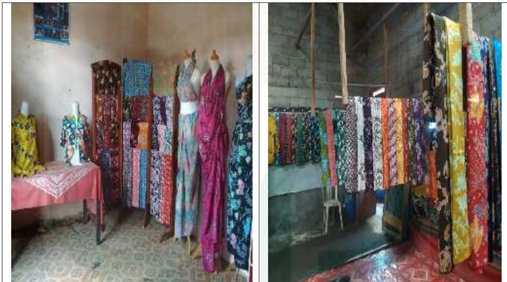
Gambar 8. Showroom yang ada di ruang depan dan ruang tengah rumah industri batik Desa Talunombo 16

“untuk pemasaran sering konsumen datang langsung ke tempat produksi untuk membeli kain batiknya, karena kita juga menyediakan showroom di industri batik ini, baik yang ada diruang depan maupun ruang tengah, selain itu pemasaran juga kita lakukan secara online , pemesananjuga bisa lewat SMS atau telephon langsung, nanti bisa diambil di sini, tapi kita juga bisa langsung mengantar yang penting ada alamat lengkapnya saja” 15 .