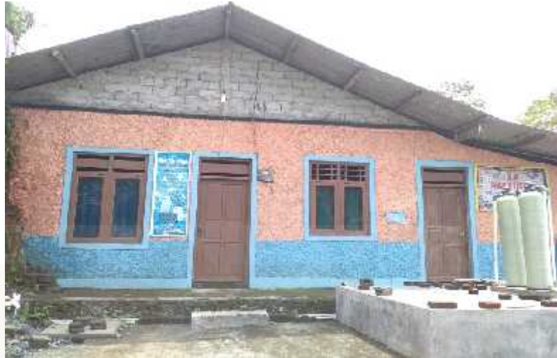
Gambar 3. Rumah Produksi Batik Carica Lestari 13

Rumah produksi yang terletak di Klamat ini merupakan rumah produksi yang berdiri dari tahun 2008 dan sampai sekarang rumah produksi tersebut masih beralamat disitu dan belum berpindah-pindah. Rumah produksi tersebut dibangun dengan dana dari swadaya masyarakat, dan tanahnya menyewa kepada salah satu warga Desa Talunombo.