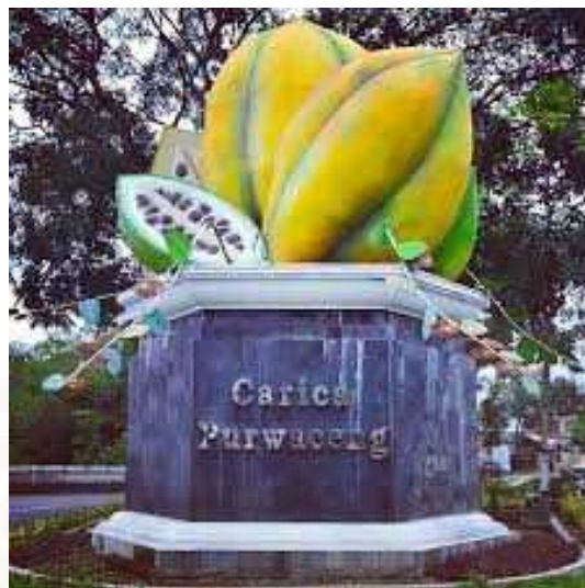
Gambar 4. Patung carica dan purwaceng yang merupakan ikon dari Kota Wonosobo 14

Dengan memanfaatkan potensi lokal yang ada di Wonosobo, dan dengan nama carica ini akan membawa pengaruh besar terhadap usaha yang di jalankan di industri batik carica lestari, sehingga motif dari batik khas Wonosobo inipun menggunakan motif carica dan purwaceng, tetapi batik yang banyak diminati oleh konsumen yaitu batik yang bermotif carica. Sebagaimana diutarakan oleh Ibu Alfiah sebagai berikut :