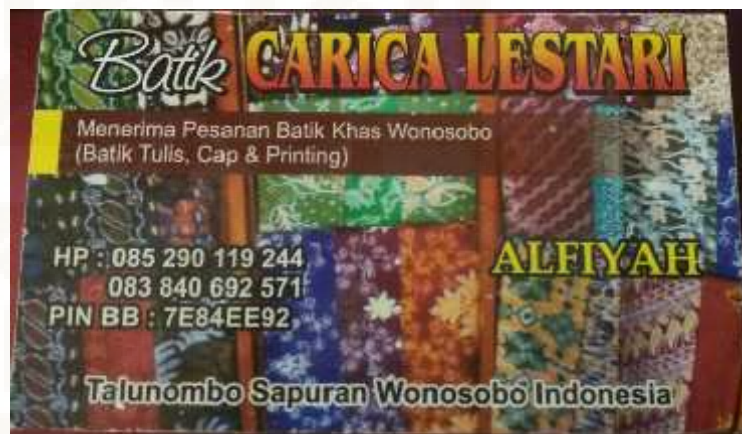
Gambar 9. Leflet/kartu nama batik carica lestari

“kita memasarkan batik secara online, dulu ada alamat web nya tapi sekarang sudah gak pake lagi, kita ngejual online nya lewat BBM maupun WA karena itu lebih efektif mbak, selain itu pemasaran juga bisa langsung via SMS maupun telephon langsung juga bisa, pemasaran kita sudah sampai Jakarta dan Semarang. Kita juga sering ikut pameran-pameran mbak” 17 .