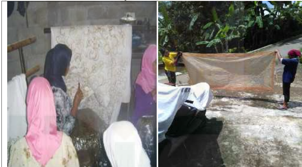
Gambar 14. Partisipasi kelompok Batik Carica Lestari dalam proses membatik 26 .

“partisipasi kita sebagai kelompok jadi semakin baik, kita bekerja bersama-sama, memproduksi batik juga bersama-sama, jadi partisipasi kita sebagai anggota kelompok ya semakin meningkat, dengan kita sama-sama kompak, pekerjaan kita untuk memproduksi batik jadi cepet selesai, ya meskipun juga butuh waktu berhari-hari sampai selesai betul”.