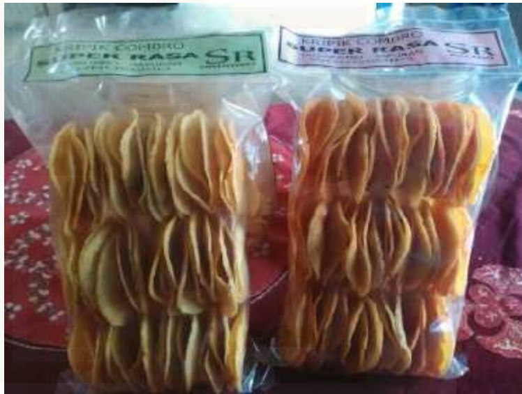
Gambar 15. Produk combro yang di produksi oleh Ibu Suprapti anggota kelompok Batik carica Lestari.

“sekarang yang biasa ngebantu saya itu tetangga saya mbak, tetangga saya itu ya dapet gaji mbak, saya gaji beliau itu sistemnya perjam. Dulu itu perhari Rp 50.000, tapi karena memproduksi gak tiap hari dan gam menentu jadi saya gaji perjam, yang penting saya masih untung dan beliau juga tidak merasa rugi tenaga”.