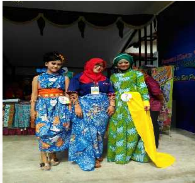
Gambar 11. Pameran yang diikuti di Mendala wonosobo

Pemasaran produk tentu sangat penting sebab bila barang yang diproduksi tidak laku, maka proses produksi barang bisa saja terhenti. Oleh sebab itu, penguasaan pasar dalam arti menyebarkan/memasarkan hasil produksi merupakan faktor yang paling menentukan dalam sebuah industri. Agar pasar dapat dikuasai maka kualitas dan harga barang harus sesuai dengan selera konsumen dan daya beli/kemampuan konsumen.