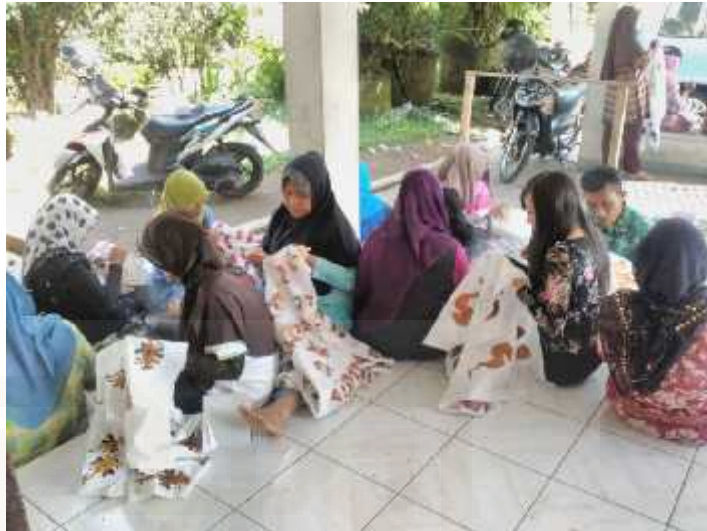
Gambar 5. Kegiatan pelatihan membatik yang diikuti oleh 40 peserta dari berbagai kecamatan, yang didampingi oleh Kelompok batik carica Lestari bekerja sama dengan Dinas Perekonomian Wonosobo

Tujuan dari diadakannya kegiatan membatik ini yaitu agar batik khas Wonosobo ini yaitu agar daerah-daerah lain juga ada industri batik yang memproduksi batik khas Wonosobo, sehingga industri batik ini bukan hanya di Desa Talunombo melainkan di desa-desa lain, jadi batik khas Wonosobo ini akan tetap lestari. Seperti yang disampaikan oleh mbak Eli.