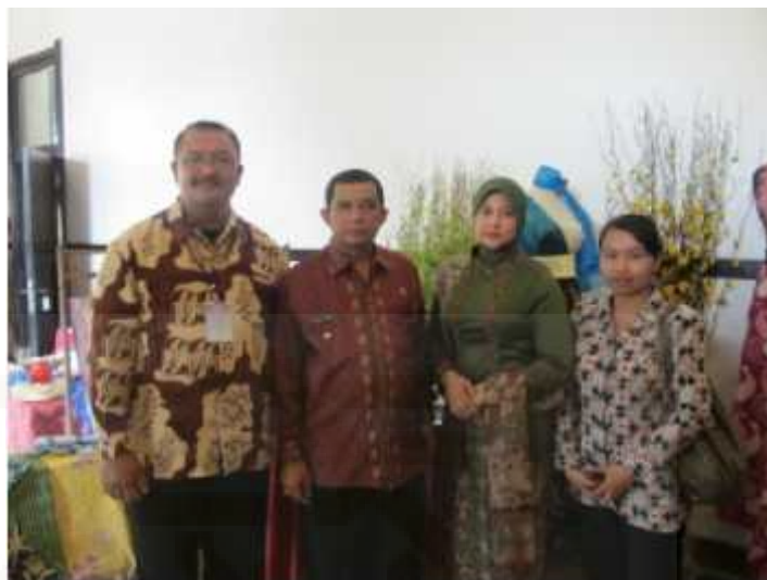
Gambar 13. Batik motif kombinasi buah dan daun carica yang digunakan sebagai seragam Dinas Koprasi Wonosobo

Penuturan serupa juga tidak jauh beda dengan yang diungkapkan oleh Ibu Khowiyah yang merupakan pengrajin/anggota kelompok batik carica lestari.