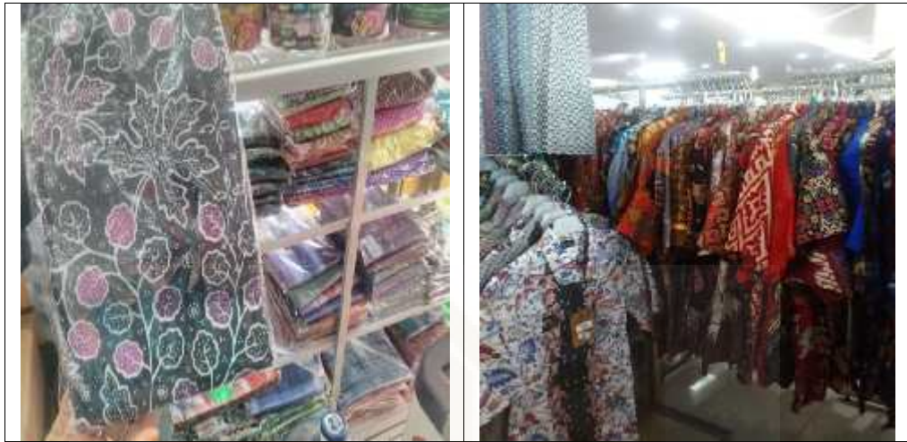
Gambar 7. Kain batik khas Wonosobo yang dijual di Dinas Kesehatan Kabupaten Wonosobo dan di Swalayan Trio 14

Gambar di atas merupakan jaringan bisnis industri batik Desa Talunombo yang ada di Dinas Kesehatan dan juga Swalayan Trio. Dari pemaparan diatas dapat disimpulkan bahwa melakukan jaringan bisnis/kerjasama dengan pihak-pihal lain sangatlah penting, karena dengan begitu pemasaran yang dilakukan oleh industri batik di Desa Talunombo ini tidak hanya di sekitar desa saja, tetapi sudah sampai ke daerah-daerah diluar Desa Talunombo.