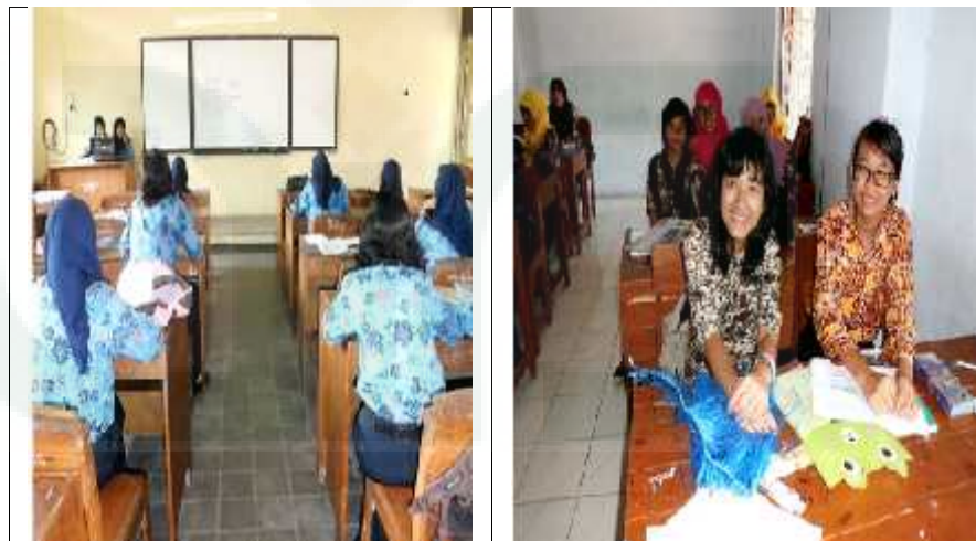
Gambar 12. Batik motif carica digunakan sebagai seragam sekolah SMK 1 Wonosobo dan SMP 1 Wonosobo

“sekarang ini sekolah-sekolah juga sudah mewajibkan murid-muridnya menggunakan batik, jadi sudah banyak yang menggunakan batik, khususnya batik khas Wonosobo ini, diantaranya di SMP 1 Wonosobo yang sudah 4 tahun menggunakan batik khas Wonosobo ini, ya meskipun gak semuanya seragam satu motif, terus di SD 4 Kalibawang, SMK 1 Wonosobo, SD 1 Talunombo, bahkan TK dan PAUD di Desa Rempak juga menggunakan batik khas Wonosobo sebagai seragam sekolahnya, sama buat seragam-seragam dinas dan guru-guru. Ya alhamdulillah pesanan semakin banyak dan pendapatan juga semakin meningkat mbak” 20 .