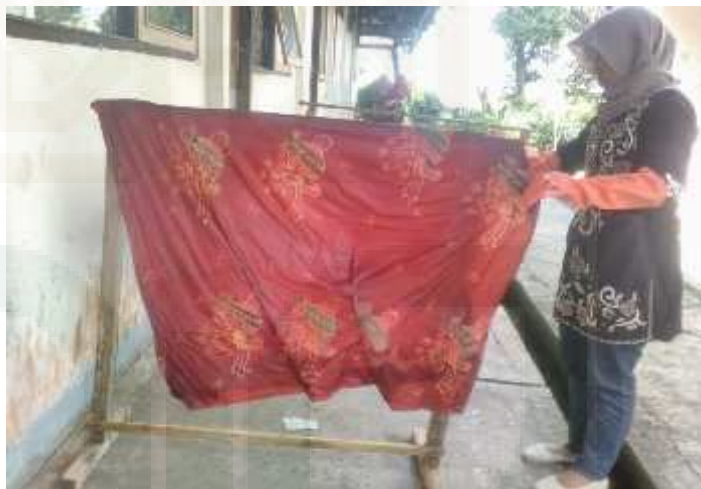
Gambar 6. Kegiatan penjemuran kain batik dengan cara diangin-anginkan yang dilakukan oleh peserta pelatihan membatik.

Dalam kegiatan pelatihan membatik ini, para peserta sangat antusias, hal tersebut terlihat dari semangatnya para peserta mengikuti kegiatan membatik tersebut. Mulai dari para remaja, ibu-ibu dan bahkan ada bapak-bapak juga yang mengikuti kegiatan pelatihan membatik tersebut. Pelatihan membatik dimulai dari tahap awal dari proses pembuatan motif, proses pemblokkan kain, proses pewarnaan, sampai proses pengeringan. Pengeringan disini dilakukan dengan dua cara yaitu pengeringan yang langsung terkena sinar matahari dan pengeringan dengan cara hanya diangin-anginkan 9 .