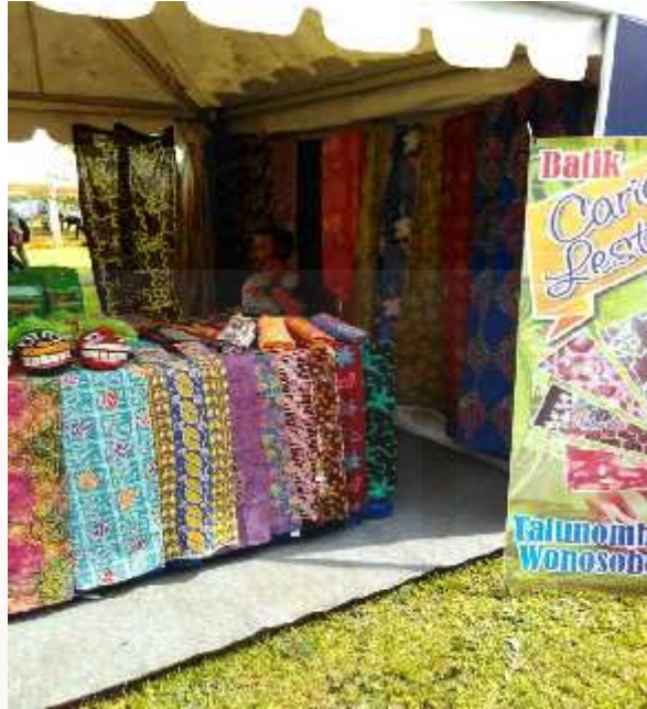
Gambar 10. Pameran yang diikuti oleh Kelompok Batik Carica Lestari di halaman Borobudur Magelang

“Pameran yang diikuti oleh batik carica lestari yang diselenggarakan di halaman candi Borobudur Magelang, dalam acara persatuan Bank BPD se Indonesia, pada hari Minggu tanggal 15 Mei 2016. Selain itu batik carica lestari ini juga mengikuti pameran yang diselenggarakan di Wonosobo dalam acara Paeran Klaster Wonosobo Pasar Agropolitan pada tanggal 4 Mei sampai 7 Mei 2016 salah satunya dengan kegiatan fashion show” 18 .