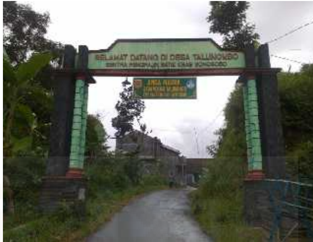
Gambar 2. Pintu Gerbang Desa Talunombo 9

Industri batik di Desa Talunombo sempat mati total karena tidak ada kelanjutan pelatihan, kemudian pada tahun 2008 dari dinas koperasi dan UMKM yaitu Ibu Siti Nurma Asiyah memberi saran untuk mengembangkan lagi industri batik yang telah mati, industri ini mulai aktif kembali, dari situlah terbentuk kelompok batik carica lestari, sebagaimana diutarakan oleh Ibu Alfiah sebagai berikut :