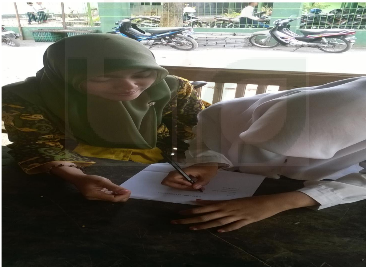
Gambar 10: Siswa Mengisi Data Diri Sebagai Narasumber