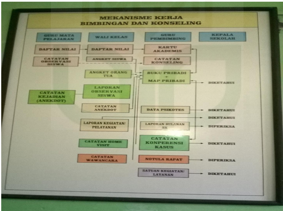
Gambar 8: Mekanisme Kerja Bimbingan dan Konseling