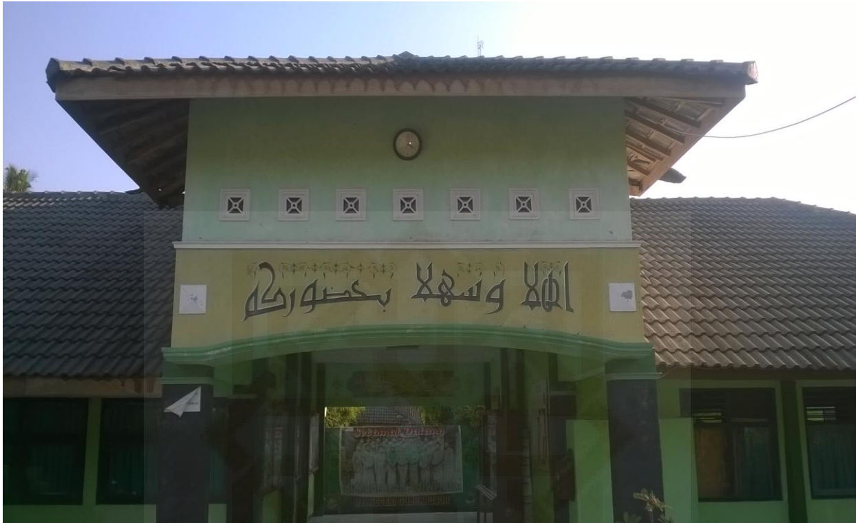
Gambar 1: Depan MTs N Gubukrubuh