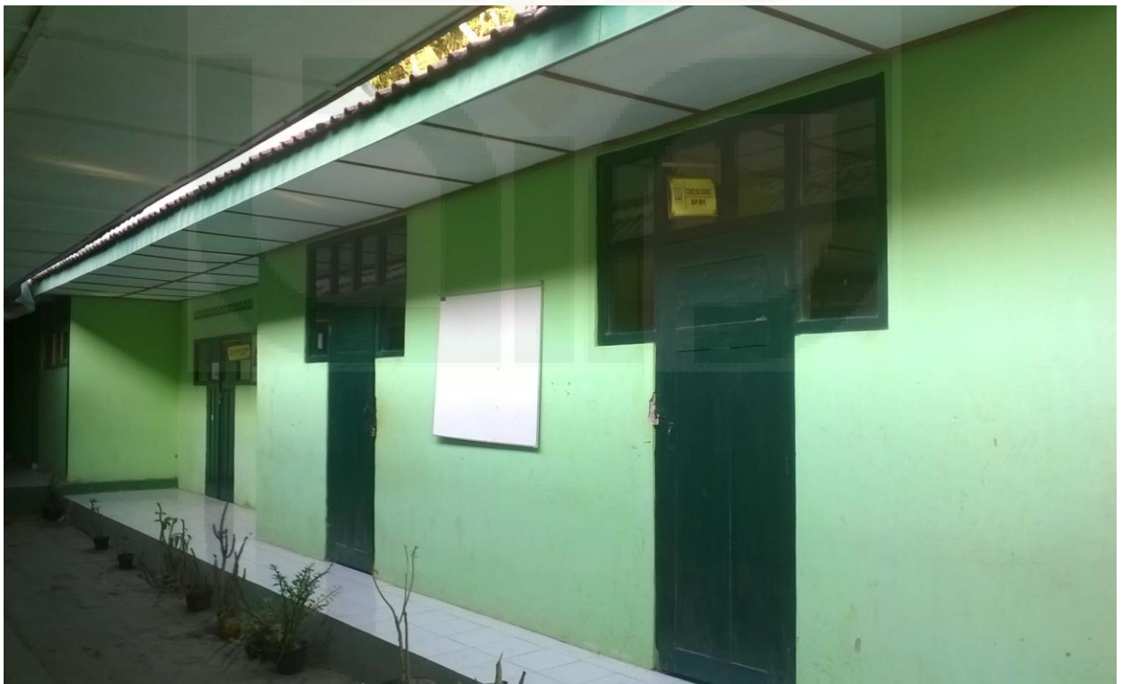
Gambar 2: Depan Ruang Bimbingan dan Konseling